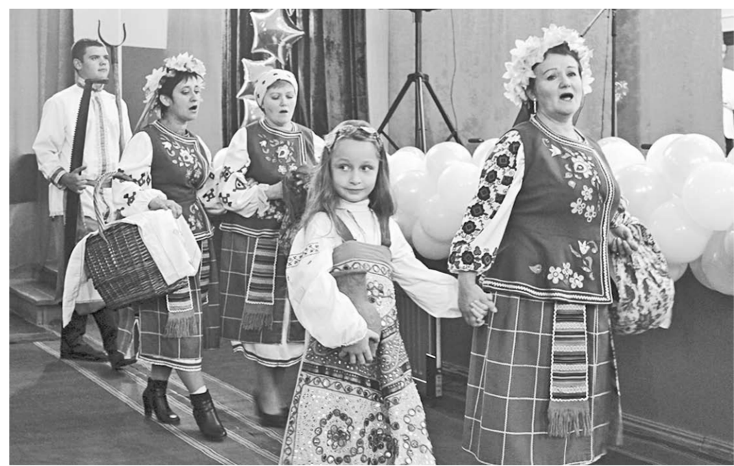
На торжествах в Алфёровке со сцены прозвучали задушевные песни в честь тех, кто много потрудился на благо родного села.

Сегодня, подчеркивает Владимир Жириновский, любые идеи насчет того, чтобы «вернуть» Крым Украине, смехотворны. Можно еще попробовать вернуть Крым генуэзцам. Или туркам. Или монголам. Но тогда сперва пускай США вернут Техас Мексике.