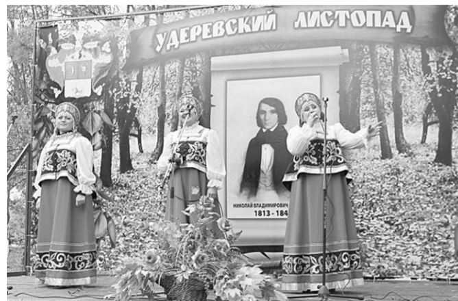
Фестиваль – настоящее путешествие в мир Николая Станкевича.

Непривычное многолюдье под сенью ещё не сброшенного золотого осеннего листа Удеревского парка. На его аллеях принимал гостей с ближних и дальних «волостей» двадцатый литературно-музыкальный праздник «Удеревский листопад».