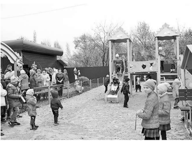
В посёлке Некрылово открылась современная детская площадка.

В посёлке Некрылово торжественно открыли места для семейного отдыха и детскую площадку «Островок добра».