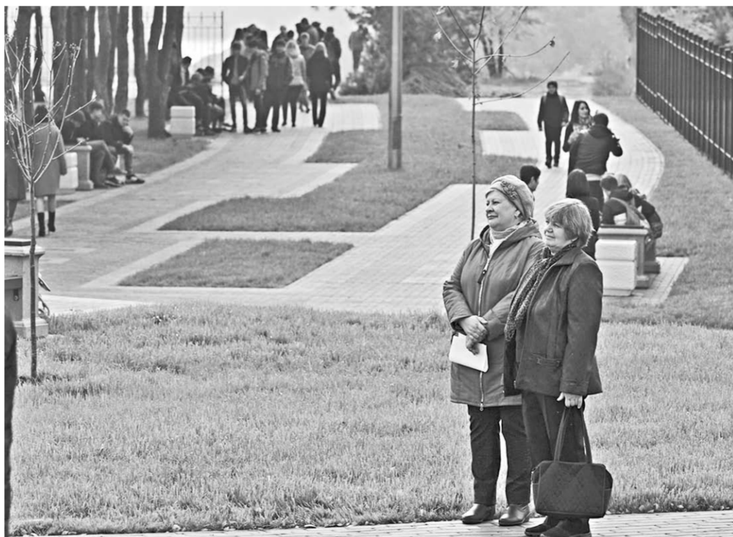
После завершения строительства сквера лискинцы получат полноценный прогулочный маршрут.