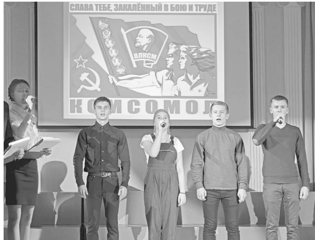
На сцене студенты ГПК.