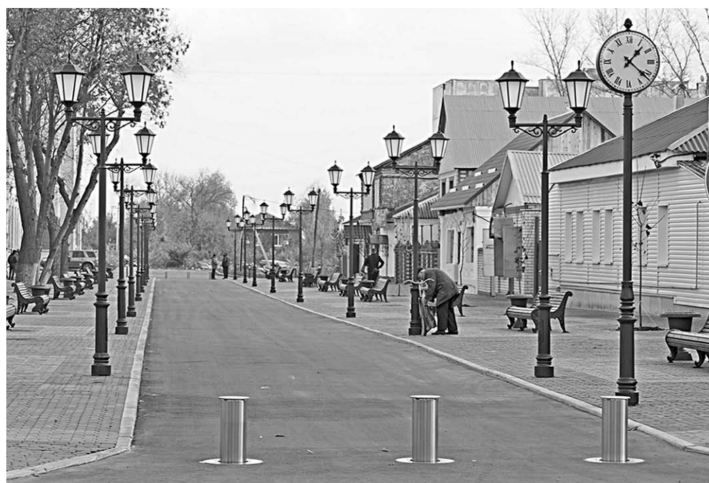
В Боброве появилась первая пешеходная улица, оформленная под старину.

Богатому Когда в Лисках попадаешь в сквер по улице Коминтерна, то сразу ощущаешь аромат сосновой хвои. Затем уже обращаешь внимание и на колоннаду входной группы, и на скамеечки с урнами, и на вымощенные плиткой дорожки. Это место, ведущее к озеру Богатое, когда-то было песчаным пустырем. Сейчас же благодаря десяти миллионам рублей, выделенным в рамках приоритетного проекта «Формирование ком-