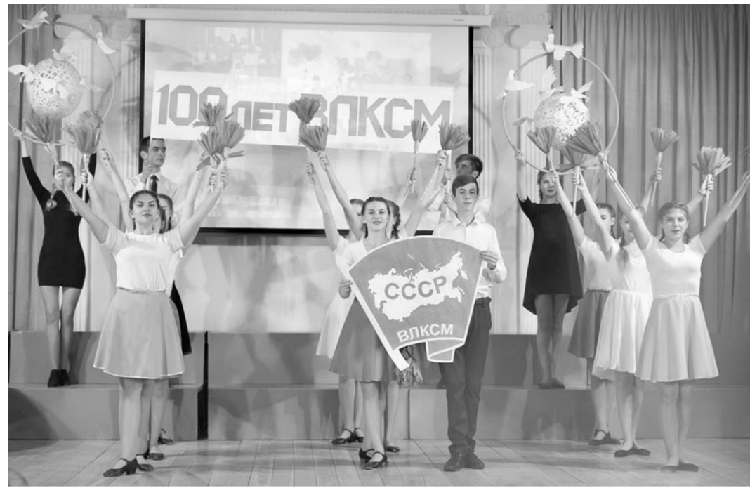
Традиция художественно-спортивных выступлений в Губернском педагогическом колледже продолжается и в наши дни.

С сентября 2017 года на базе Губернского педагогического колледжа реализуется программа подготовки специалистов среднего звена с использованием дуальной формы обучения, при которой не менее 50 процентов времени студенты проводят в условиях учебной и производственной практик, то есть в школах и детских садах. По такой программе занимаются более 470 студентов первых-вторых курсов.