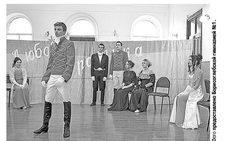
На сцене – юные артисты из Борисоглебска.

Лучшие школьные театры Воронежской области подвели итог регионального фестиваля школьных театров, посвящённого 190-летию первой постановки комедии «Горе от ума» Александра Грибоедова.