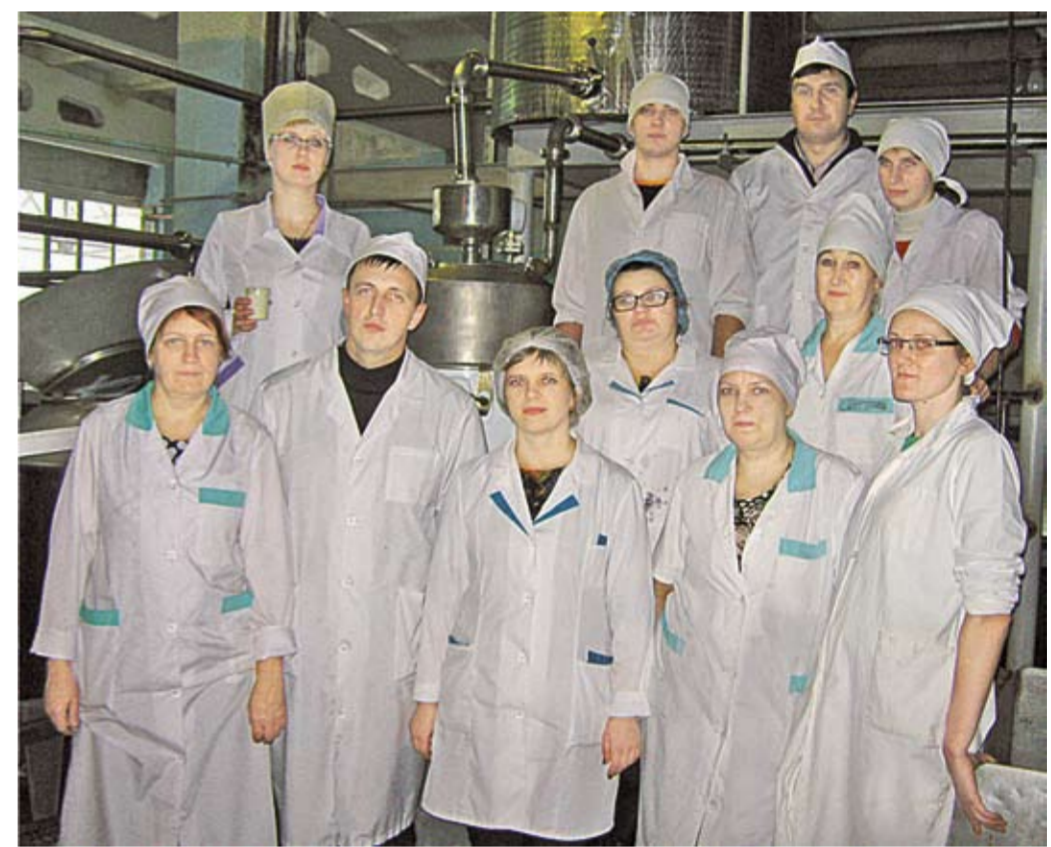
Коллектив Россошанского молочного завода на запуске нового оборудования.

За девять месяцев 2017-го объём реализации составил 103 процента к соответствующему периоду прошлого года. Завод удерживает лидирующие позиции в отрасли и остаётся одним из крупнейших налогоплательщиков Россошанского района. Наше предприятие гордится своими наградами, завоеванными на всероссийских и международных агропромышленных выставках. Когда наш продукт признают настоящие специалисты и эксперты, да ещё и далеко за пределами родного края, получаешь дополнительный мощный стимул для дальнейшего развития. Однако наше самое ценное достижение – народная любовь, заслуженная и искренняя.