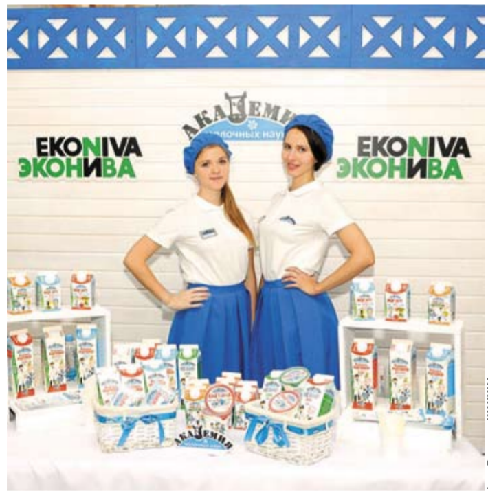
Сотрудничеству с ведущими агрохолдингами региона в Воронежском ГАУ придается большое значение.

нящий день Воронежский государственный аграрный университет является подлинной кузницей кадров для нашего региона и всей страны в целом. С целью повышения результативности работы АПК России и конкретно воронежских аграриев намечена программа широкого применения практического опыта ведения сельского хозяйства в Баварии. Правительство Воронежской области и германская сторона подписали договор о намерениях и будут на его основании