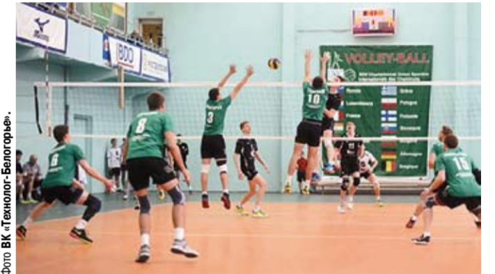
Волейболисты «Кристалла» (на переднем плане) поделили очки поровну в упорном противостоянии с «Технологом-Волгоград».

В Саранске состоялся первый тур первенства России по волейболу среди мужских команд первой лиги. Острогосский «Кристалл» уступил с одинаковым счётом 0:3 по партиям «Саранскабель-Мордовию» и ВК «Тамбов» и одержал победу над калужским «Юниором» — 3:2.