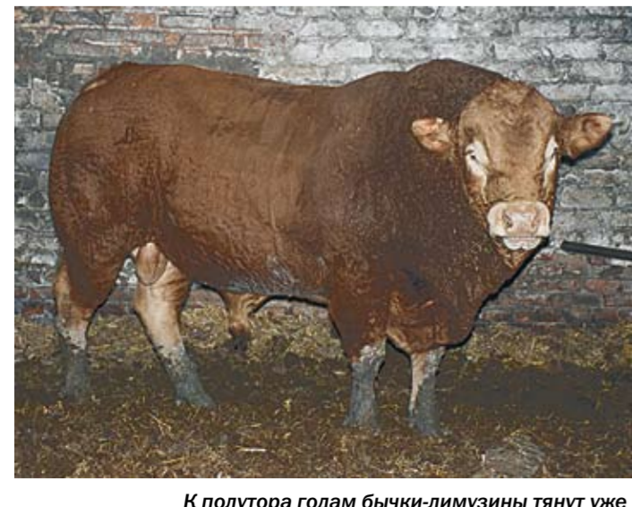
К полутора годам бычки-лимузины тянут уже на 800 килограммов, а в два года весят более тонны.

С такими подходами руководителю «Большевику» предстоит многое по плечу.