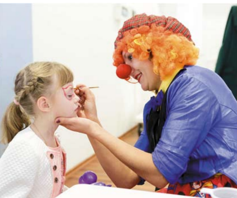
Праздник «Белых лепестков» в Воронежском перинатальном центре отмечают в шестой раз.

года специалисты Центра в работе с детьми начали применять так называемый розовый шум — запись звуков, которые ребенок слышит, находясь в утробе матери. Маленькие колонки, которые воспроизводят шум плаценты, ставятся персонально в каждый кювет (инкубатор интенсивной терапии новорожденного). Это помогает малышу успокоиться и почувствовать себя в безопасности.