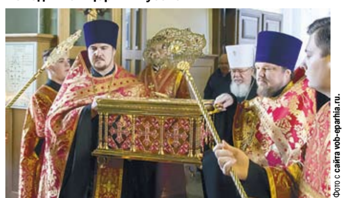
Во время встречи мощей в Благовещенском соборе.

В день 100-летия избрания на Патриарший престол святителя Тихона в Воронеж принесён ковчег с частицами мощей святых новомучеников и исповедников Церкви Русской.