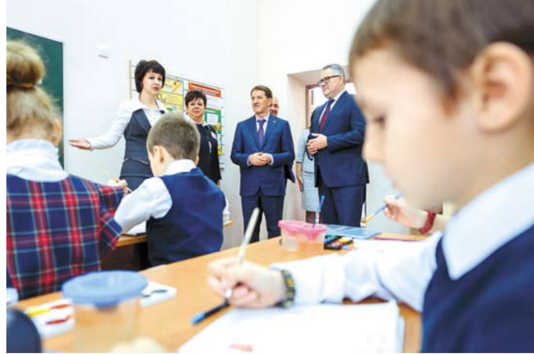
Новые учебные классы помогли решить проблему второй смены.

Необходимость реконструкции школы №12 в Лисках про-