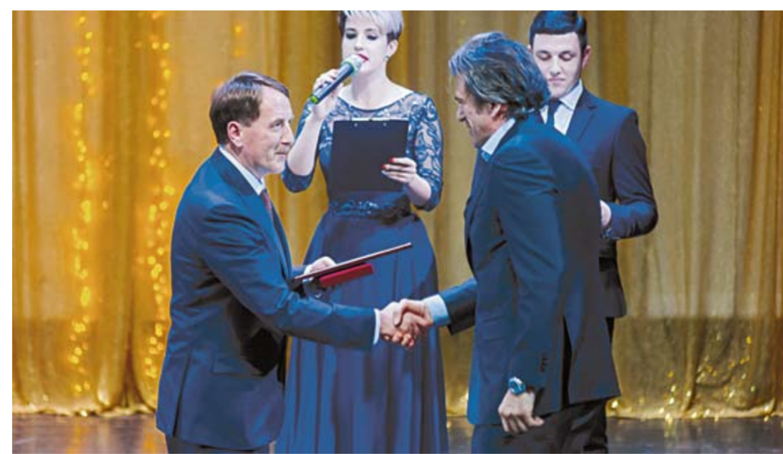
Губернатор Алексей Гордеев вручил награды сотрудникам ОАО «Маяк».

Власть | «Лискинский район – место, где хочется жить и работать», – отметил в ходе своей поездки в муниципалитет губернатор Воронежской области Алексей Гордеев