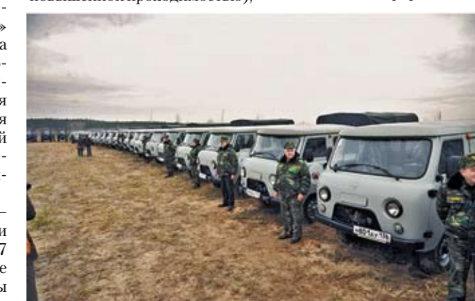
На закупку техники потрачено 50 миллионов рублей.

Завершилась церемония символическим флешмобом — собравшиеся построили композицию в форме ёлки.