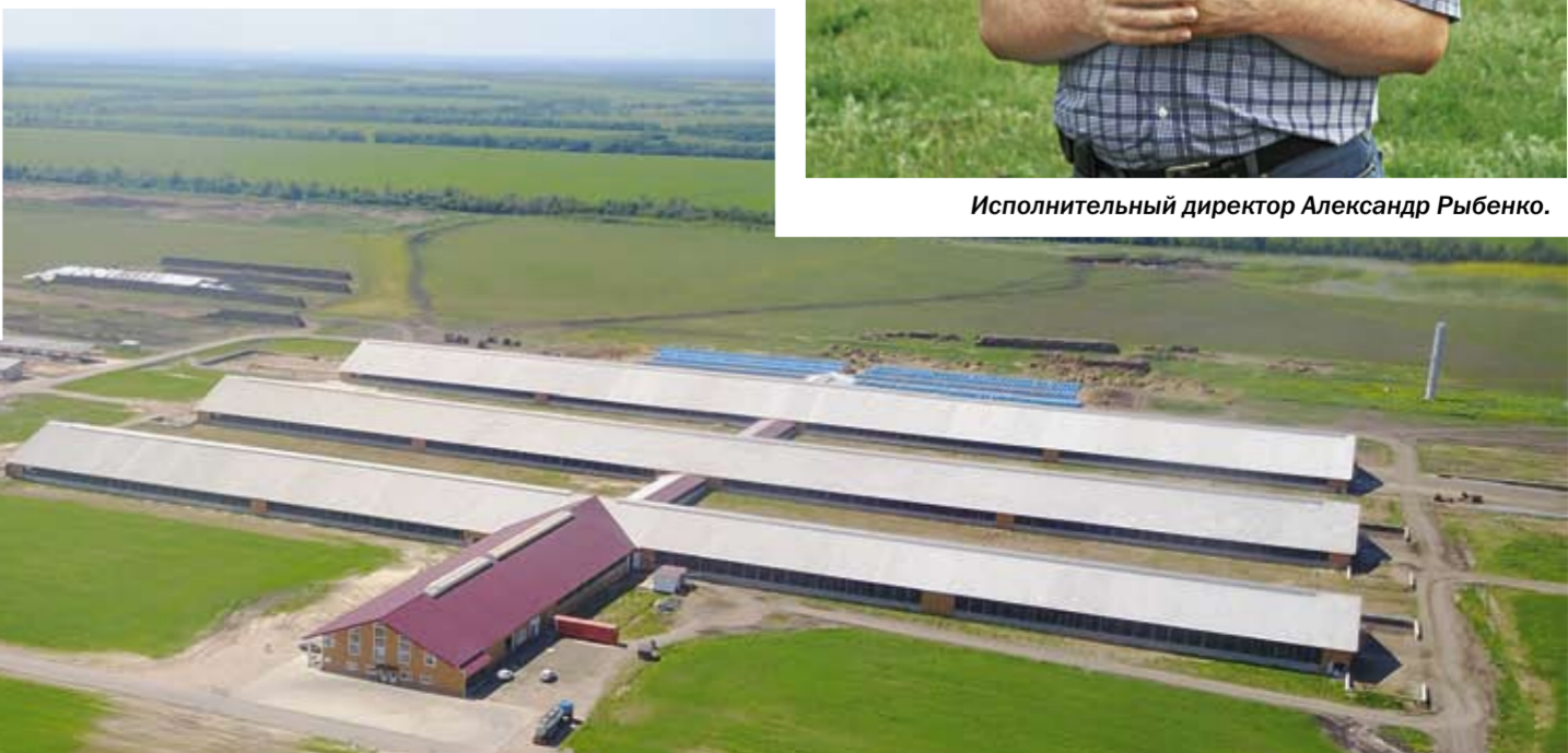
Так с высоты птичьего полёта выглядит животноводческий комплекс в Верхнем Икорце Бобровского района.

близиться к животным. ЭкоНиваАгро регулярно повышает квалификацию: посещают крупнейшие российские и зарубежные выставки, проходят стажировку в Израиле, Австрии, США, Германии.