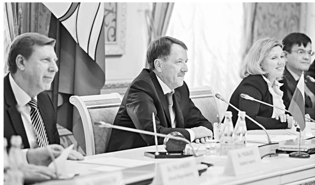
Алексей Гордеев: «Существует целый ряд направлений, где мы можем расширять сотрудничество: промышленность, аграрная сфера, медицина, образование».