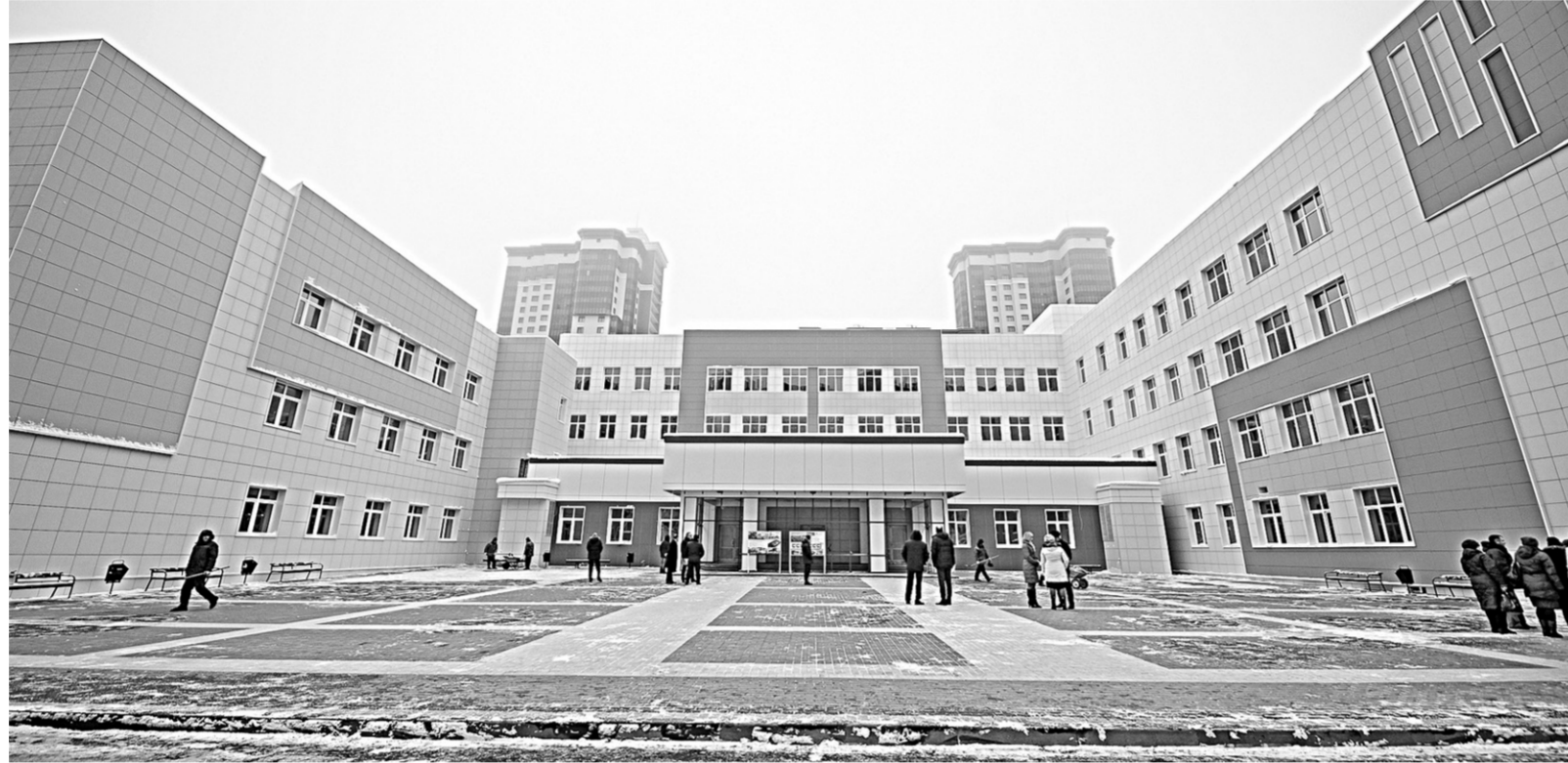
Вот такое замечательное современное здание в ближайшее время получат воронежские школьники.

Педсовет | Уже совсем скоро, в январе 2018 года, откроет свои двери общеобразовательная школа № 102, расположенная на улице Шишкова областного центра