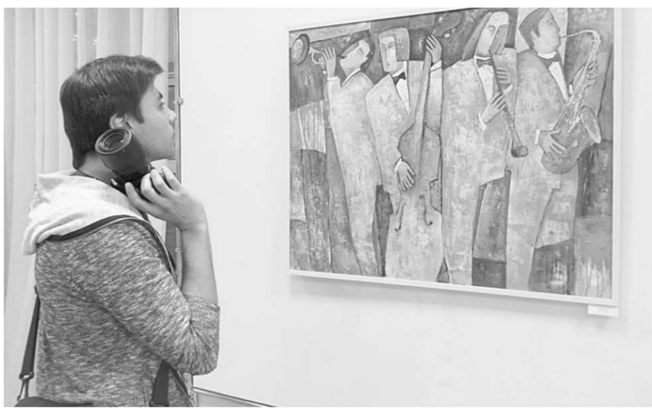
Выставка даёт адекватное представление о творческих поисках живописца.

Этот художник, как отмечают коллеги, обращается ко многим жанрам, двигался