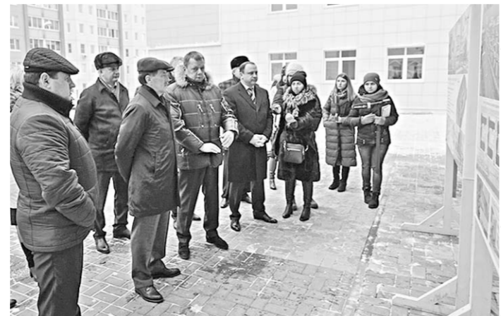
Губернатор Алексей Гордеев ознакомился с планом обустройства новой школы.

Отметим то, что в 2017 году ремонтные работы проведены в 230 образовательных организациях, расположенных на территории 30 муниципалитетов области.