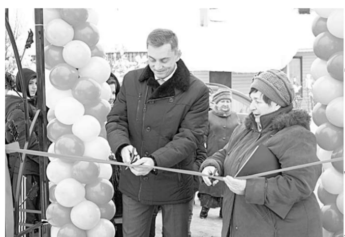
В народный сквер – с праздничным настроением.

На улице Маршала Шапошникова в Воронеже состоялся праздник по случаю открытия нового сквера. Он получил то же имя, что носит и улица – Маршала Советского Союза Бориса Михайловича Шапошникова.