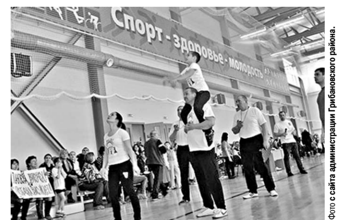
Обновлённый спортзал Нижнекарачанской сельской школы.

Нижнекарачанские школьники – спортивные лидеры района, они часто занимают призовые места на районных и областных соревнованиях по волейболу, баскетболу, теннису, легкой атлетике. Большой интерес у них вызывает туризм. Вот почему в школе появился складом. Он поможет укрепить мышцы рук и ног, стать выносливее. Но самое главное: после всех этих преобразований спортзал стал удобным для тренировок. На ремонтные работы из областного бюджета было выделено почти полтора миллиона рублей.