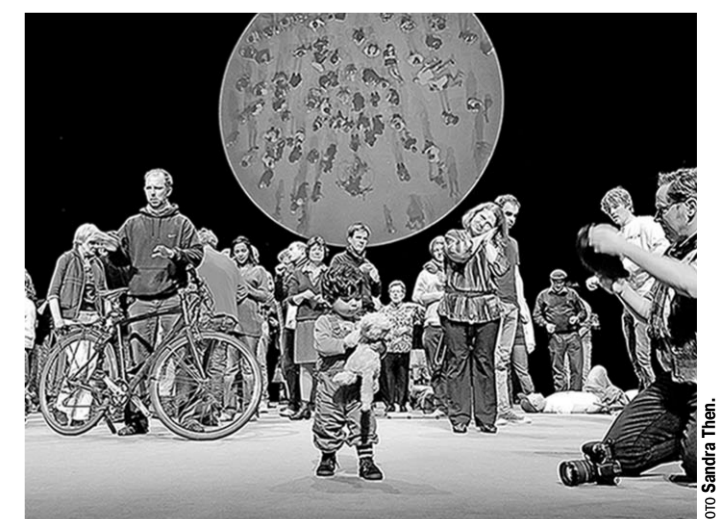
Идеи «100% Города» уже были реализованы в Лондоне, Вене, Амстердаме, Токио, Париже.

Это документальный спектакль, основанный на статистических данных, в нём участвуют не актёры, а реальные жители города. Rimini Protokoll знакомы российским театральным сообществам прежде всего по постановкам, осуществлённым в нашей стране – таким, как променада-спектакль Remote. Петербург и Remote Moscow, спектакль-путешествие CargoMoscow и номинированный на «Золотую маску»-2018 проект «В гостях. Европа». Все работы самой, пожалуй, известной европейской театральной компании, созданные в различных точках земного шара, основаны на реальных фактах и дают зрителям исключительный опыт узнавания и сопереживания, помогая