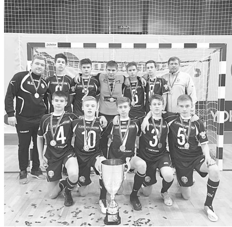
Команда юношей 2001 г.р. – чемпионы России по мини-футболу в 2017 году.

Начало положено в 1993 году: в школе №73 был открыт первый специализированный спортивный класс по футболу для юной 1980 года рождения. На базе школы был создан Футбольный центр ФЦШ-73, который известен далеко за пределами нашего региона. Команды СОШ № 73 различных возрастов становились в 2008 году чемпионами России по футболу, в 2017-м – чемпионами России по мини-футболу, в 2013 году – серебряными призёрами чемпионата России, дважды – победителями первенства