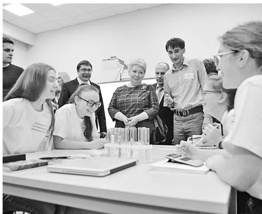
В пансионате «Солнышко» одарённые дети глубоко изучают любимый предмет, а также отдыхают.