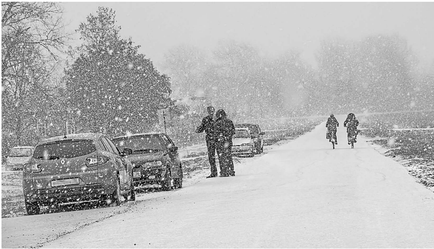
Декабрьским днём на улицах села Ярки.

Время перемен | В сёлах Яркового сельского поселения жители стали улыбаться чаще: на их улицах обновили дороги, а отдыхают они в благоустроенном парке