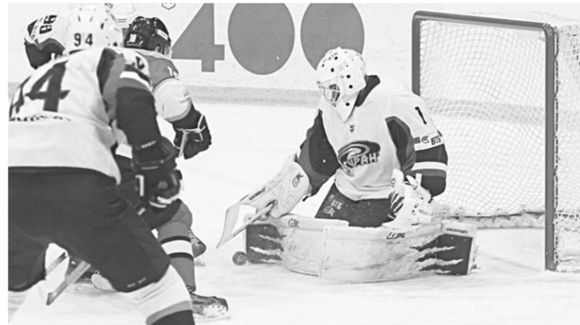
«Металлург» – «Буран». Опасный момент у ворот воронежцев.