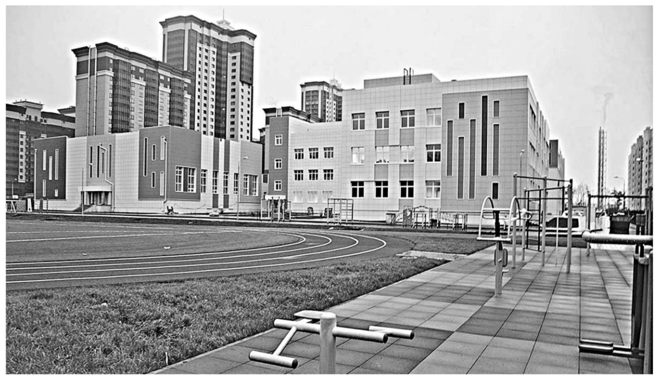
Так выглядит уникальная во всех отношениях школа №102 в областном центре.