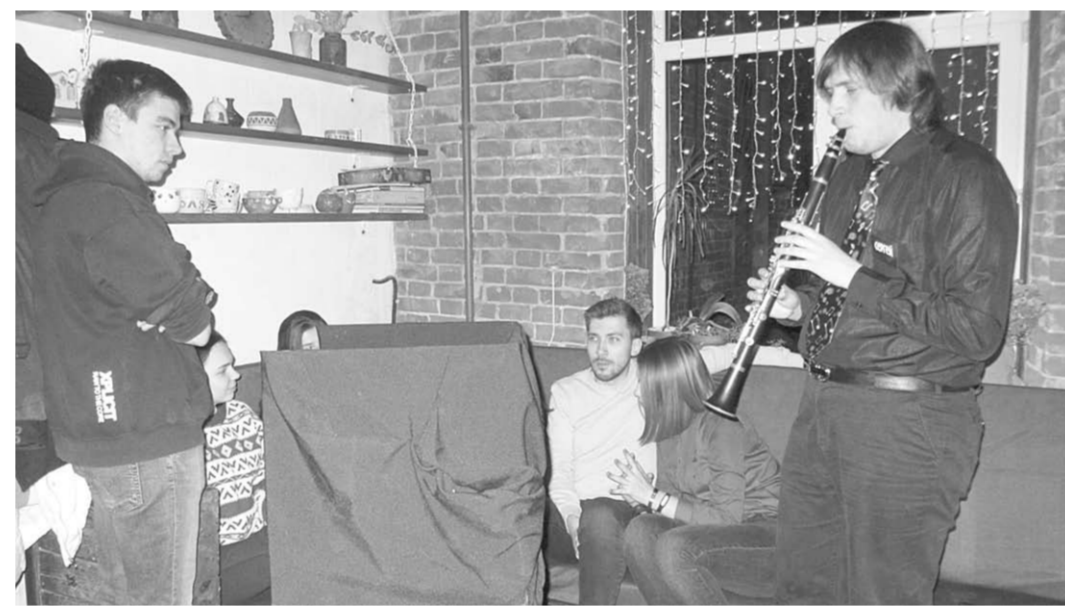
На протяжении вечера в стенах школы звучала живая джазовая музыка.

...Открываю дверь и погружаюсь во мрак. Лишь рука организатора выставки служит ориентиром в пространстве. Двигаюсь против часовой стрелки вслед за другими посетителями, переходю от одной композиции к другой. Гладкая невидимая мне фигурка из