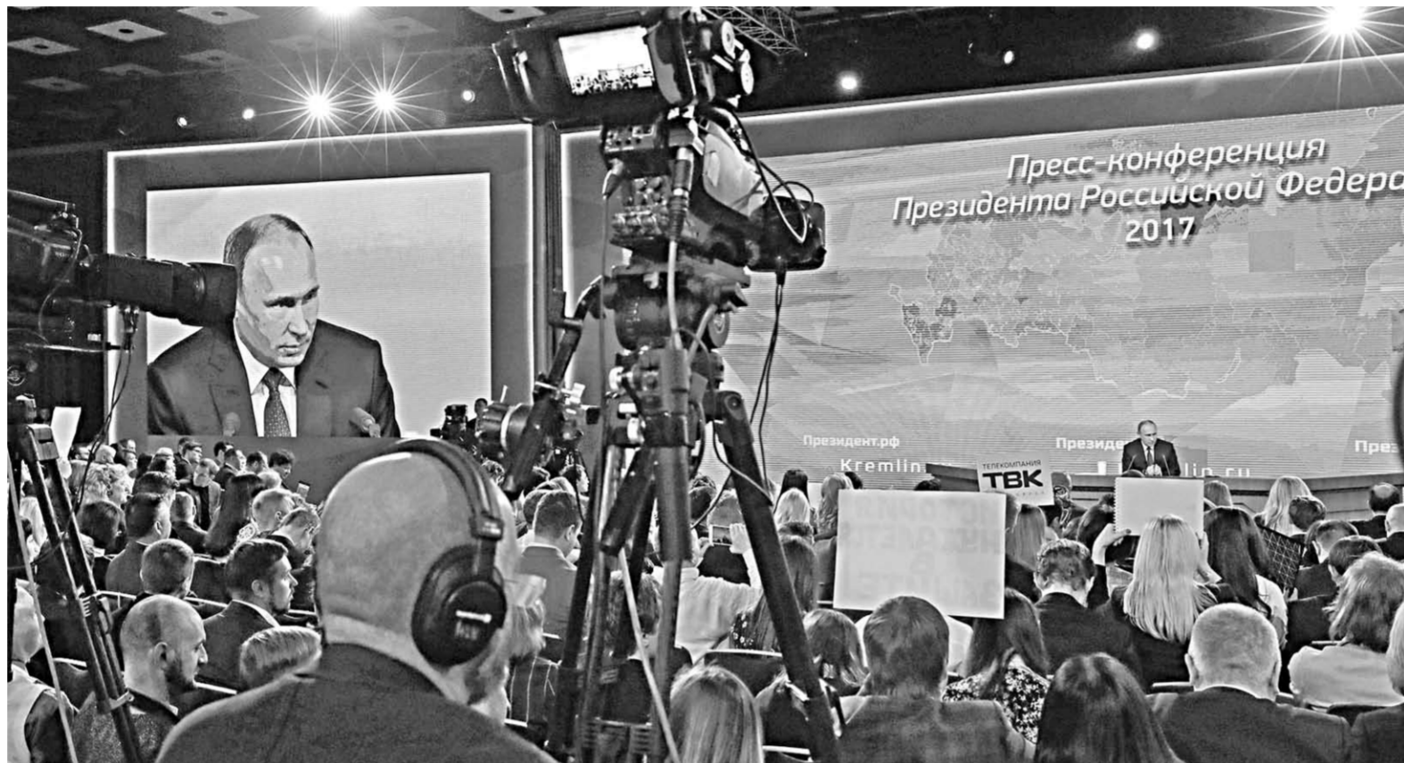
В огромном море журналистов каждый во что бы то ни стало пытался задать вопрос Президенту, но удалось только пятидесяти пяти.

Репортаж | Закулисье большой пресс-конференции Президента России Владимира Путина не менее интересно, чем само выступление главы государства