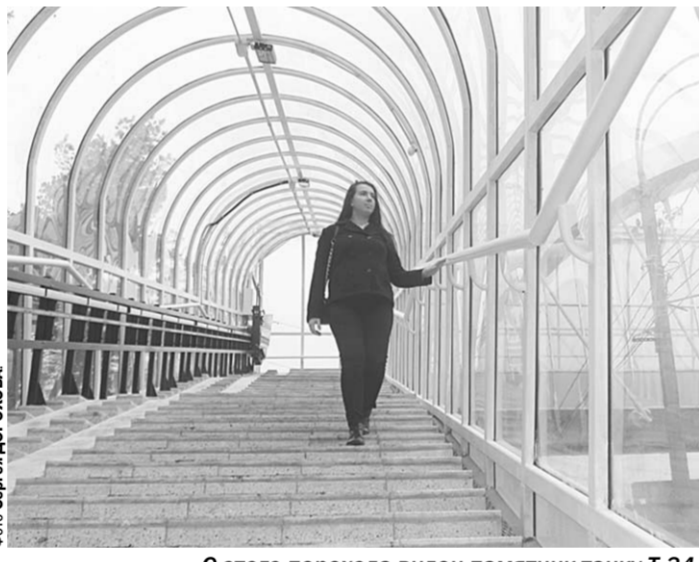
С этого перехода виден памятник танку Т-34.

Город | В Воронеже на одной из оживлённых трасс, на проспекте Патриотов, 12 декабря открыли надземный пешеходный переход