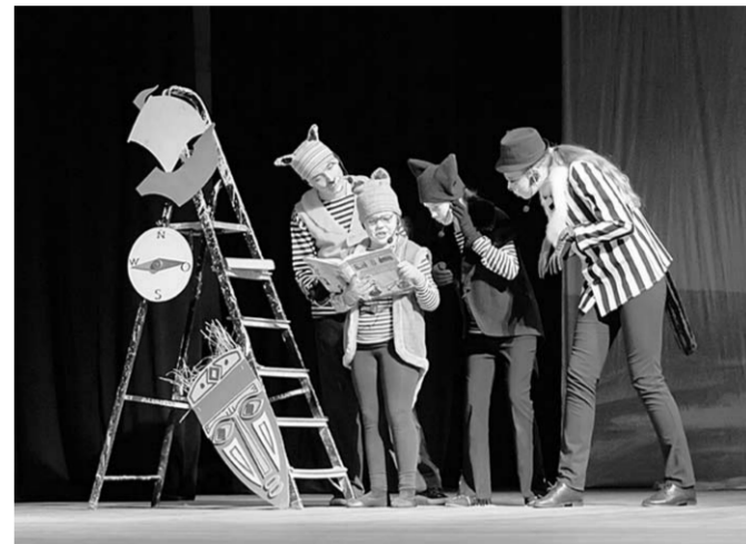
Сцена из спектакля «Мама-кот».

В ДК Железнодорожников прошёл благотворительный показ спектакля-мюзикла в рамках фестиваля «Дети – детям!», который уже третий год подряд проводит творческий коллектив Студии детского мюзикла «Наш город». Этот спектакль – подарок Студии детям, оказавшимся в трудной жизненной ситуации.