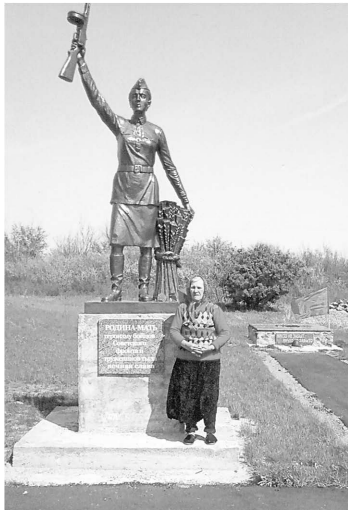
Памятник «Родина-мать» занял достойное место в композиции «Малый Сталинград».

Женщины стремились сделать для Победы всё, что можно, и даже больше. Все они, каждый на своём месте, ковали Великую Победу народа над фашистской Германией. Это поколение испытало на себе все тяготы войны, выстояло и победило. И мы не должны об этом забывать, – говорит пред-