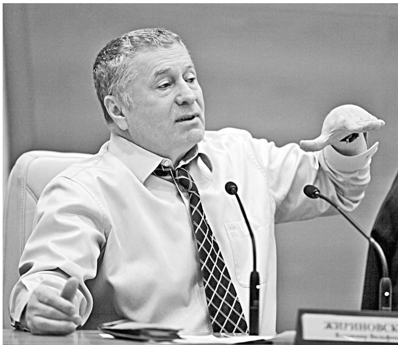
Владимир Жириновский: «Главное право человека — это право на выбор».

Известно, что каждый человек, попадая в новый коллектив, начинает приспосабливаться к его атмосфере, вести себя «как все», чтобы стать частью этого сообщества. Но в этом, по мнению лидера ЛДПР, и заключается ошибка. Полностью подчиняясь коллективному разуму, индивидуум теряет самостоятельность: «Коллектив,