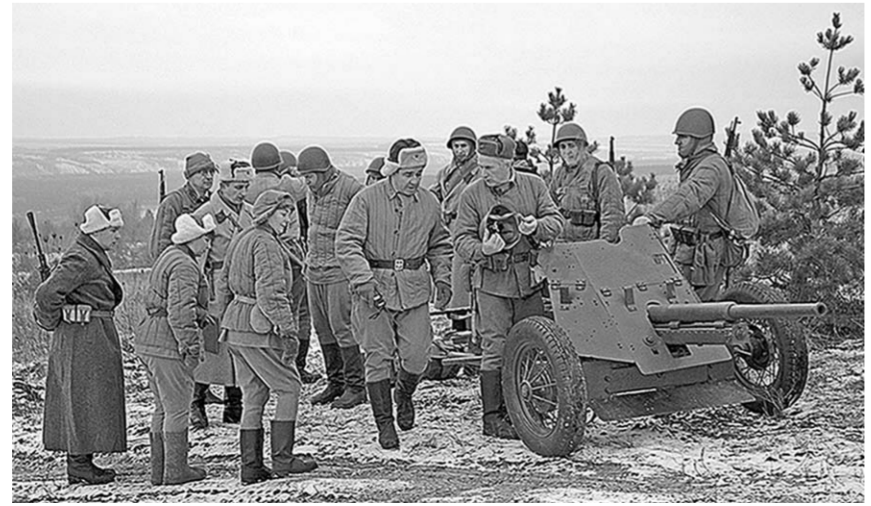
Один из эпизодов военной реконструкции «Малый Сатурн».