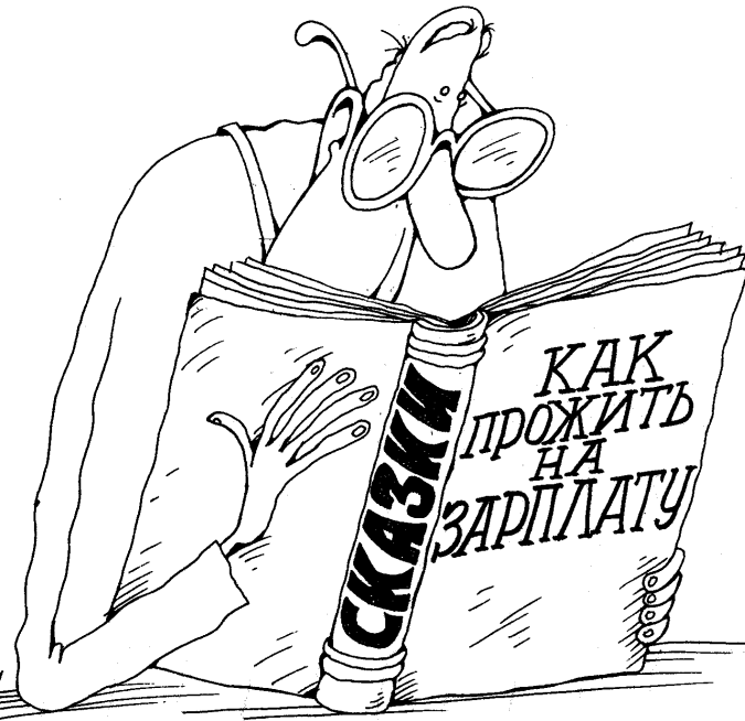
Рисует Михаил ПАРЧЕНОВ.

сокращения занятости (!), с надеждой на приток