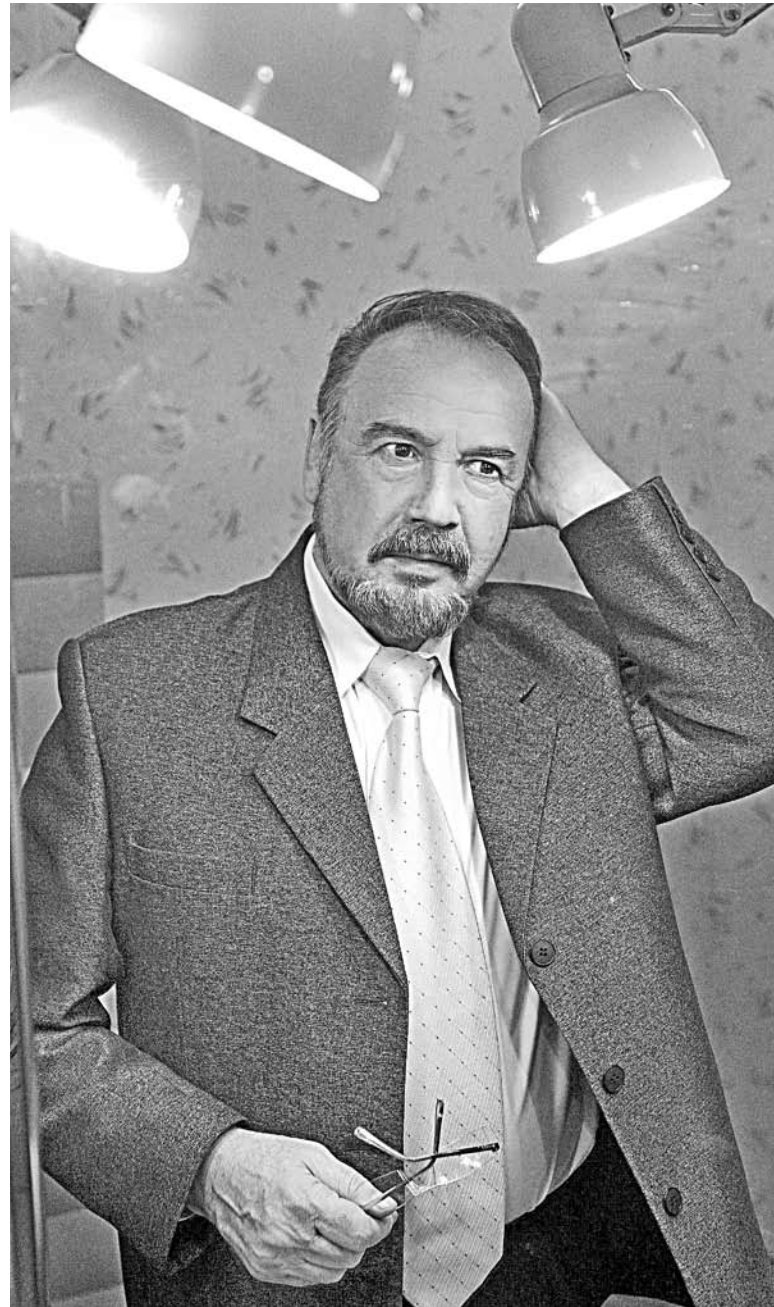
Народный артист России Анатолий Гладнев.

Мало плакать безутешно О приятелях былых: В нас ещё живут надежды, Неисполненные в них.