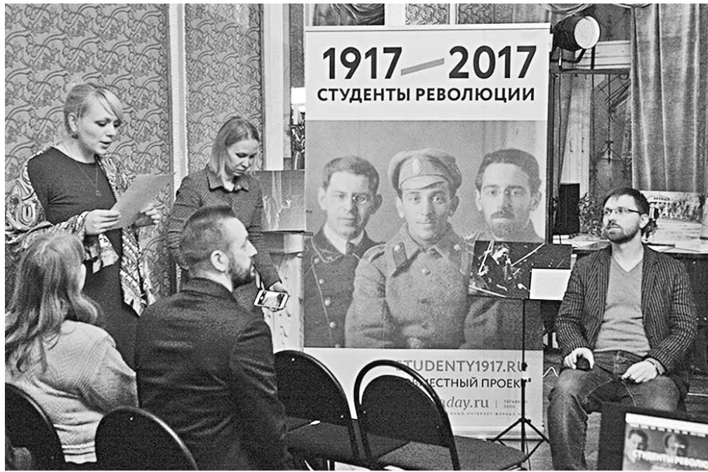
Презентация проекта состоялась в Доме композиторов.

Далёкое – близкое | В Воронеже прошла презентация уникального проекта, рассказывающего о роли студенчества в событиях 1917 года