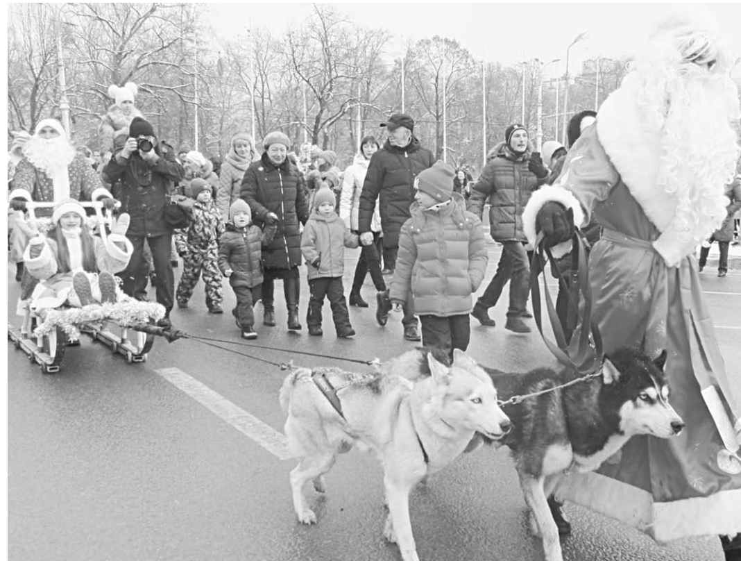
К праздничной колонне присоединялись десятки воронежцев с маленькими детьми.

Репортаж | В центре Воронежа 23 декабря прошёл ежегодный парад Дедов Морозов