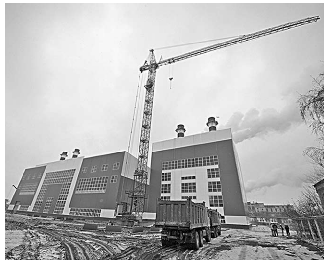
Возведение нового энергоблока ведётся в отдельном стоящем корпусе по схеме двух дубль-блоков.