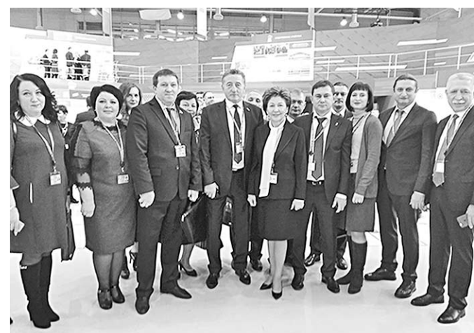
Делегация воронежцев на съезде.

В Москве завершился XVII съезд Всероссийской политической партии «Единая Россия». Его участниками стали около 2500 человек, в числе которых находились 455 делегатов от всех 85 региональных отделений, руководители федеральных министерств и ведомств, депутаты Государственной Думы, представители исполнительной и законодательной власти регионов, секретари региональных политсоветов «Единой России», представители партийных платформ, члены экспертного и научного сообществ.