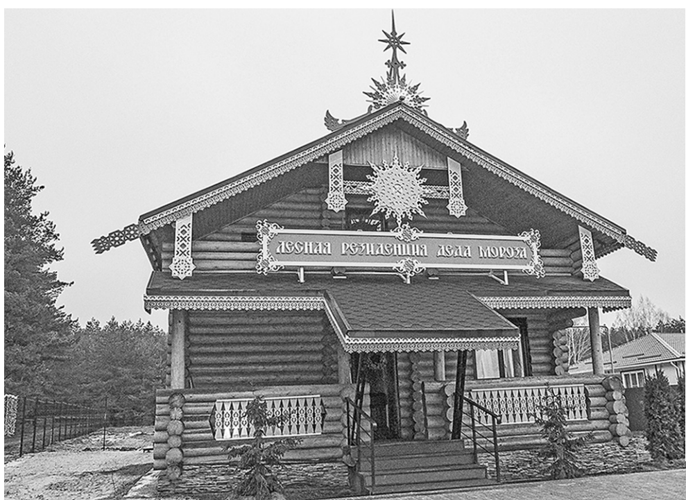
Терем Деда Мороза привлекает красотой и загадочностью.

Однако корреспонденты «Коммуны» нашли таинственный портал, открывающий двери в сказку, и отправились в Нелжу. Там, в волшебном бору, расположилась Лесная резиденция Деда Мороза – удивительное место, где происходят чудеса и сбываются мечты.