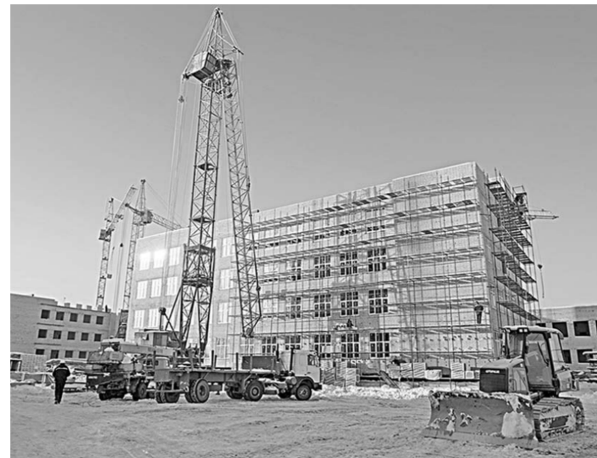
Общая площадь возводимой школы составляет 21 тысячу квадратных метров.

— Школа современная, поэтому хотелось бы, чтобы её наполненность была высокой. Правильно, что параллельно с жильём строятся объекты социальной инфраструктуры. Кроме того, важно не превращать застройку в унылый спальный район. Должно быть кварталное общественное пространство — небольшие скверики, где люди могли бы гулять и общаться, — отметил