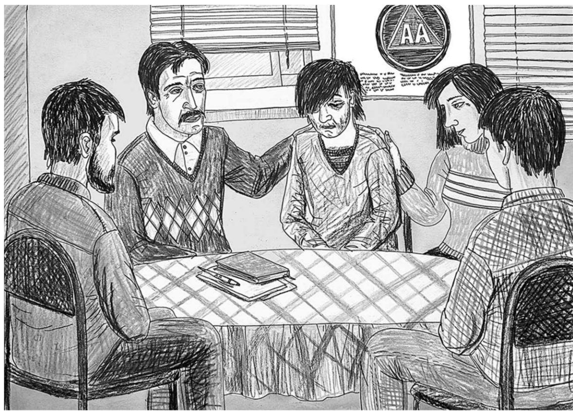
Рисунок Натальи КОНЫШКИНОЙ

Помощь в сообществе бесплатная, основанная на программе «12 шагов» и описанная в книге «Анонимные Алкоголики». Единственное условие для членства — желание бросить пить. Чтобы легче было двигаться в сторону избавления от алкогольной зависимости,