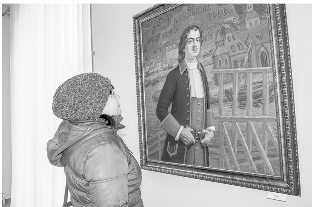
Таким видится художнику Пётр I в молодые годы.

Александр Михайлович, можно так сказать, пламенный певец воронежского края. Художника глубоко волнует история родной земли и люди, которые так или иначе, оказа-