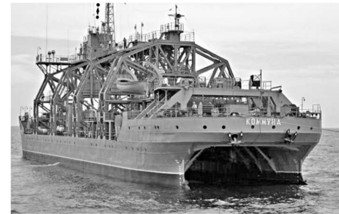
«Коммуна» на морских просторах.

Спасатель подводных лодок Черноморского флота «Коммуна» обрабатывает задачи в море.