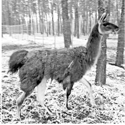
Фима - завидный жених.

Фиму воронежцам подарил коллеги из зоопарка Ростова-на-Дону, информирует областная департамент природных ресурсов и экологии. На новом месте Фима ведёт себя спокойно, немного настороженно. Специалисты намерены «поженить» Фиму с Глашей - самой гуанако, которая живёт в Воронежском зоопарке уже более двух лет. Один детёныш - дочка - у Глаши уже есть. Но Матрёшка уже подросла и обходится без мамы. Её нигде не переведут, она останется на выставке в зоопарке и будет радовать ребятшек и взрослых посетителей.