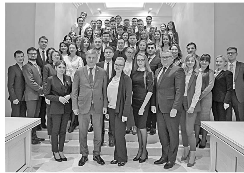
В расширенном заседании Молодёжного парламента приняли участие представители четвёртого и вновь избранного пятого состава.

Одно из важных направлений — поддержка молодёжных проектов. В 2017 году на конкурс премий Молодёжного правительства был подан 121 проект, 40 из них получили поддержку. Авторам вручили денежные премии в размере от 20 до 100 тысяч рублей. Также в прошлом году продолжена практика проведения конвейера молодёжных проектов в