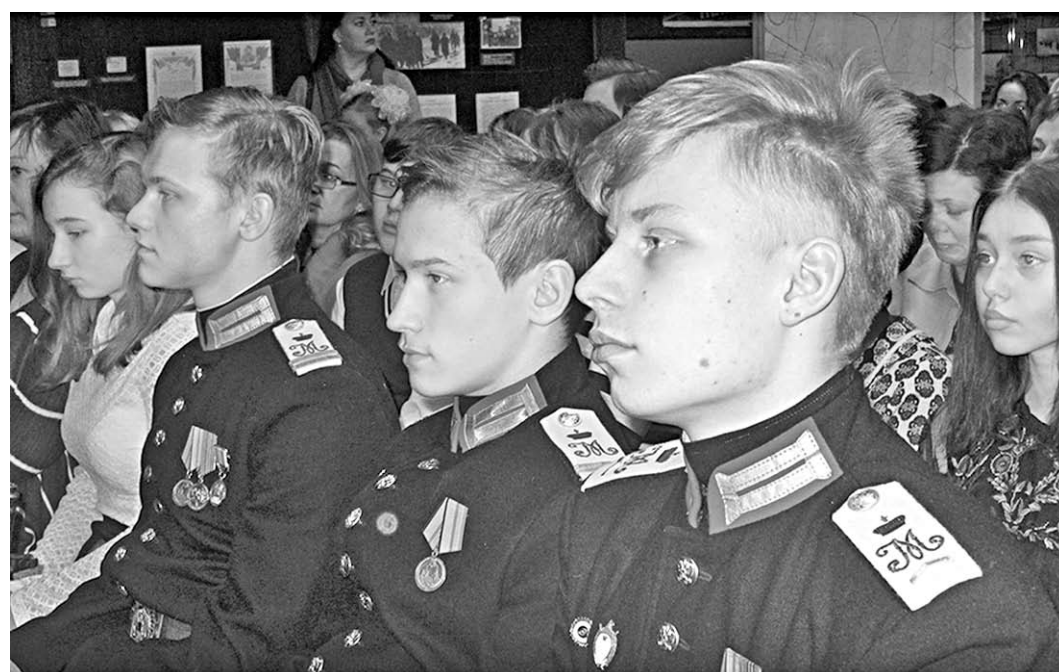
Конкурс привлёк внимание и школьников, и кураторов.