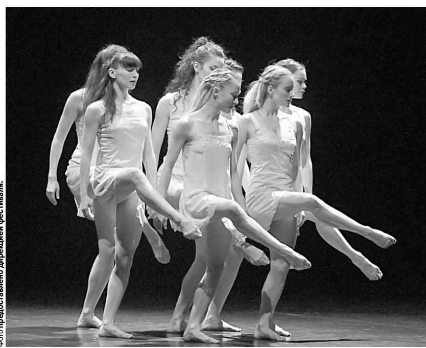
Фестиваль даёт шанс увидеть хореографию Анжелены Прельжожаки.

Практически одновременно на сцене концертного зала будет показана La Verita Компании Финци Паска (Швейцария).