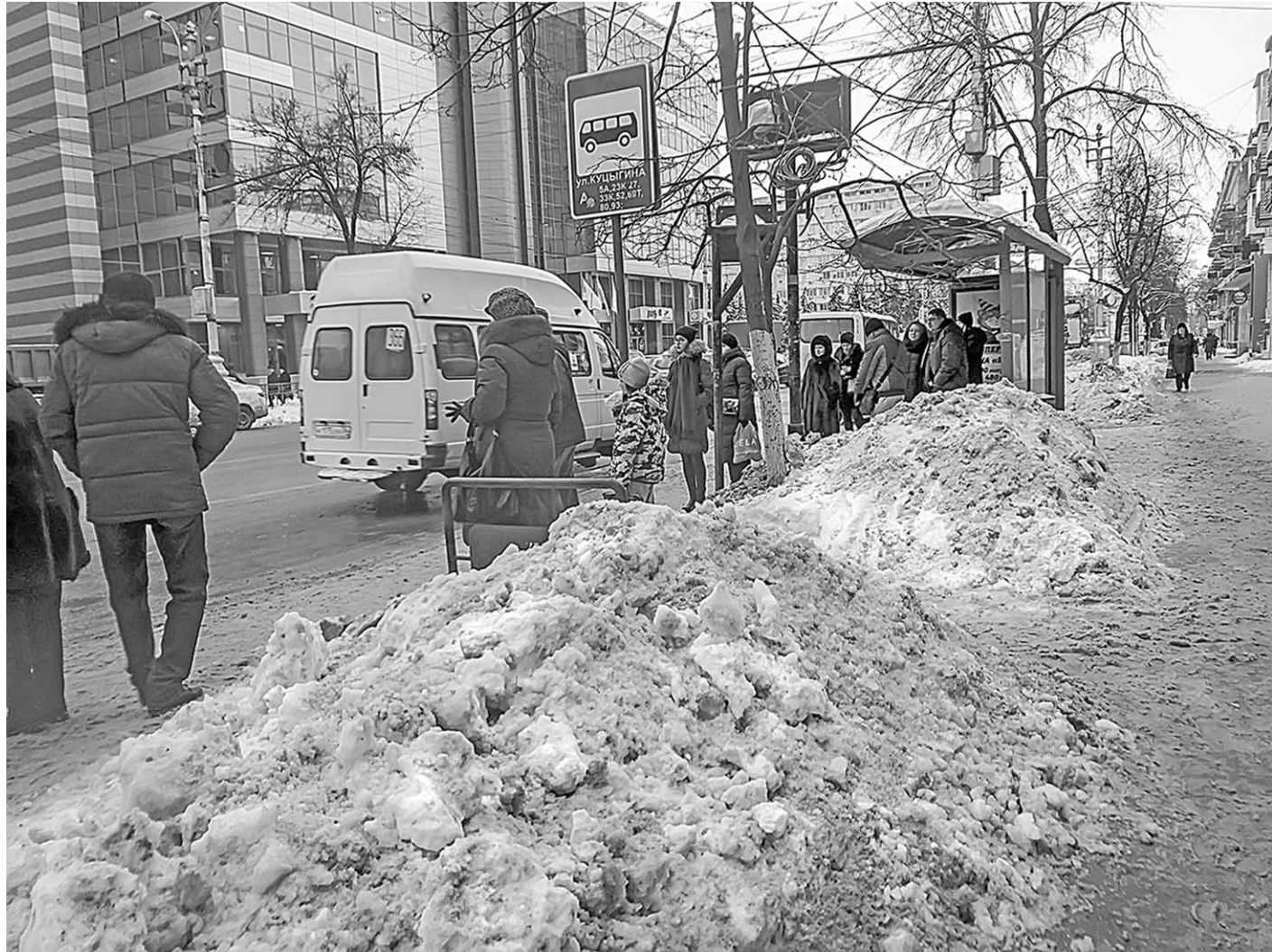
Привычные для наших широт зимы всё ещё преподносят сюрпризы коммунальщикам.

Ситуация | Нынешняя зима складывается в точности как сказано у классика: «Зимы ждала, ждала природа. Снег выпал только в январе». Дождались. Сначала один снегопад, затем другой... И народ застонал: вновь завалены снегом улицы и дворы