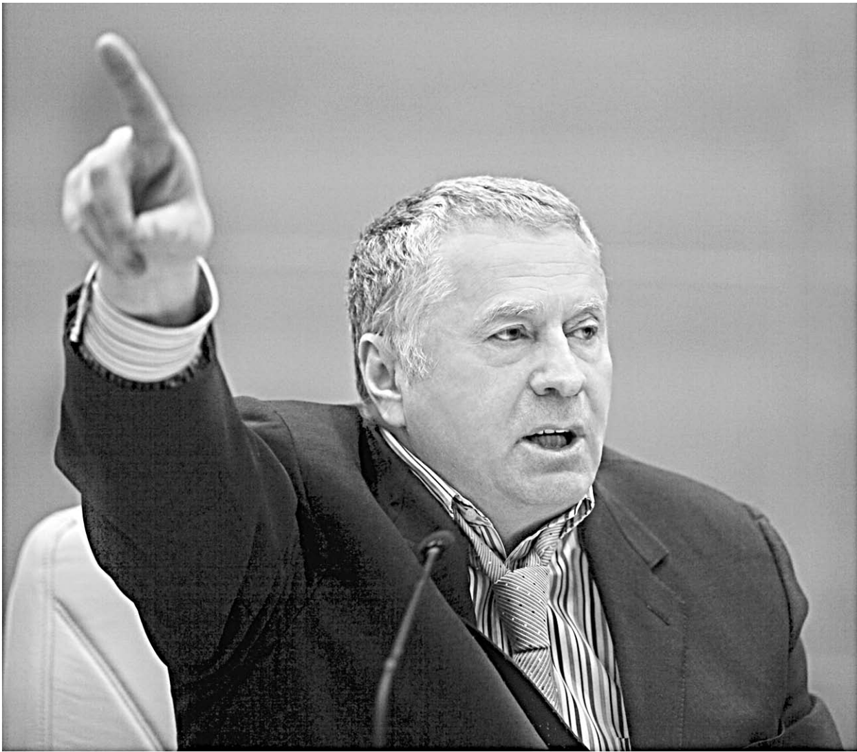
Владимир Жириновский: «Демография и образование – две ключевые проблемы страны».

Кроме того, следует обратить внимание на ситуацию, когда женщина, родившая двух детей, получает право на выплату материнского капитала, даже если дети рождены от разных отцов. При этом мужчина, у которого второй ребенок родился в новой семье, ничего не получает. Лидер ЛДПР отмечает: «Когда мужчина другую семью создает и он реально отец двух детей, государство ему ничего не платит. Это наносит удар по мужской части населения».