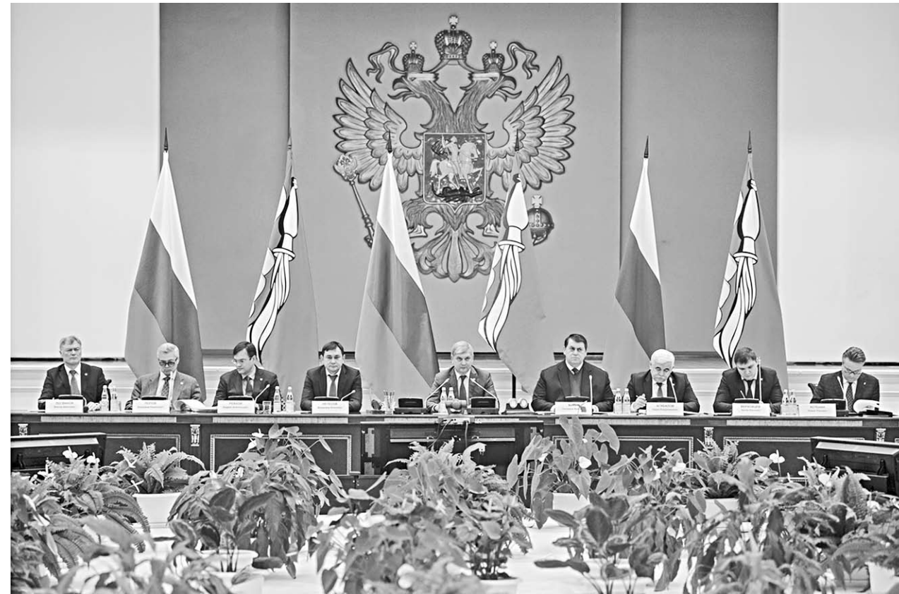
На заседании правительства Александр Гусев обозначил основную задачу – ускорить темпы развития экономики.

По мнению докладчика, поставленные задачи вполне решаемы. Так, в ближайшее время власти намерены заняться актуализацией инвестиционных паспортов районов, содержащих конкретные предложения по инвестиционным площадкам, инфраструктуре и возможным мерам поддержки инвесторов. Но это не всё. Анатолий Букреев назвал ряд приоритетных направлений работы для глав районов и департаментов. Основные – это определение точек роста экономики и увеличение объёма инвестиций, мобилизация доходов бюджета и борьба с теневой занятостью, участие в федеральных программах и проектах. А ещё – стимулирование жилищного