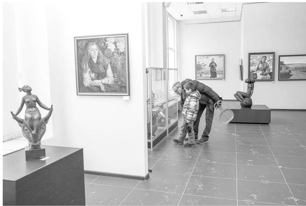
На выставке курских художников.