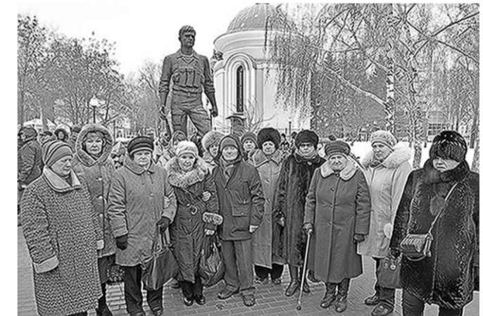
По традиции церемония возложения цветов посетили матери и вдовы погибших в локальных конфликтах.

В день 29-летия вывода советских войск из Афганистана, 15 февраля, воронежцы почтили память погибших солдат и офицеров, выполнявших свой воинский долг за пределами Отечества.