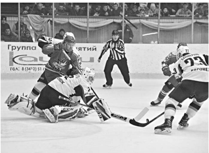
После разгромного поражения в Альметьевске «Буран» в упорном поединке одолел «Ижсталь».

«Ижсталь» (Ижевск) – «Буран» (Воронеж) – 1:3