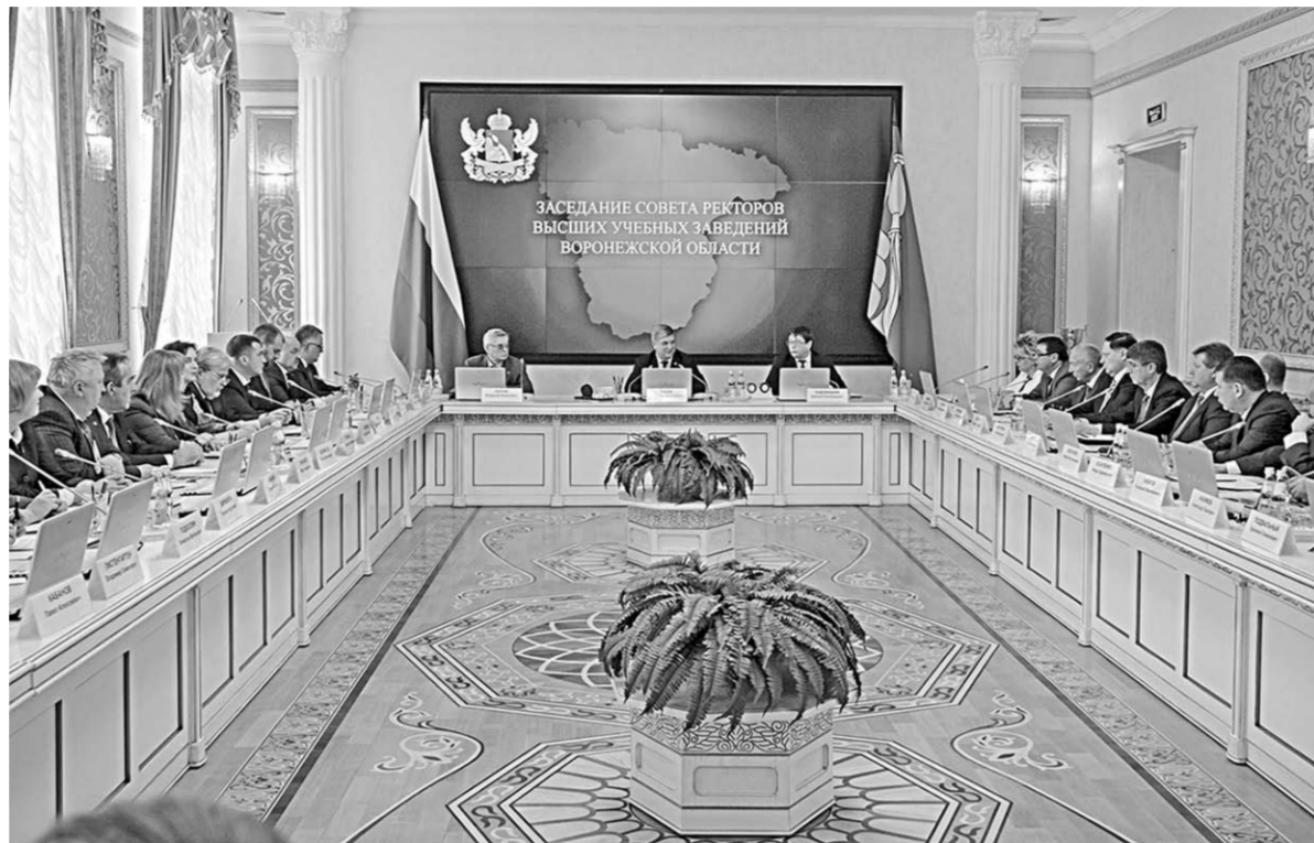
В заседании Совета ректоров высших учебных заведений Воронежской области приняли участие и победители конкурса «Кубок инноваций».