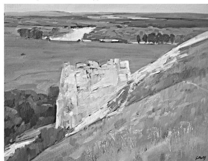
«Дивногорский мотив» – одна из работ Дмитрия Савинкова, представленная в «Подъёме».

нальной вклейке и обложке. Сдержанная цветовая гамма, точный рисунок и благородство художественного зренья отличают эти полотна – портреты, пейзажи, натюрморты. На фоне многочисленных подделок под искусство картины Савинкова как будто свидетельствуют: красота живет вокруг нас, важно только вглядеться, и тогда ее чистые волны согреют и замузуют сердце современного человека.