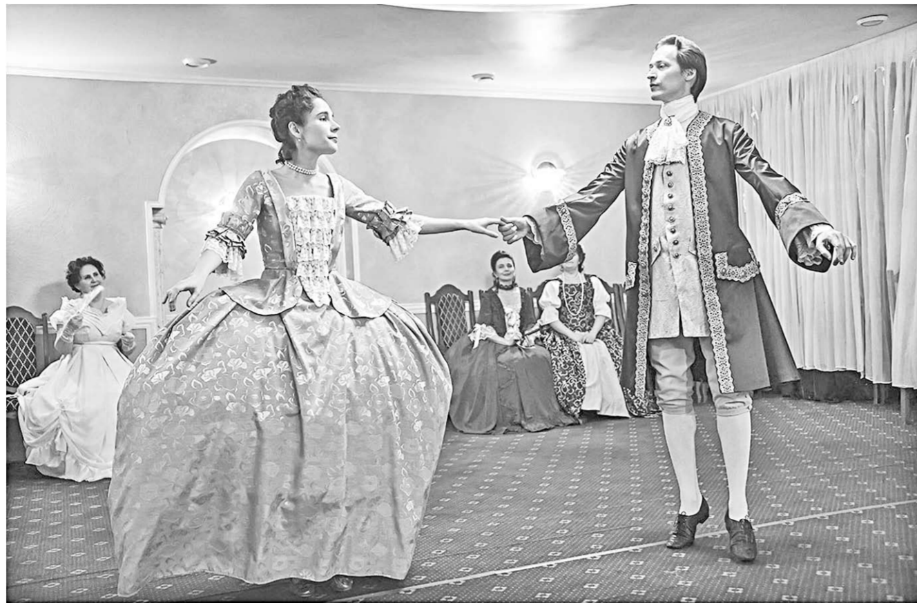
Удивительно грациозными выглядят танцевальные пары.

Жизнь вне Интернета | Увлечение старинными бальными танцами — способ общения и изучения мировой культуры, в частности, хореографии