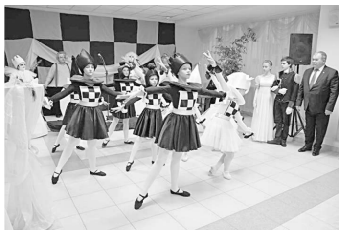
На благотворительном балу.

В рамках вечера был проведён благотворительный