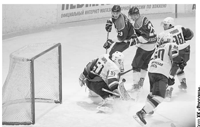
«Липецк» – «Россошь». Опасный момент у ворот фарм-клуба «Бурана».