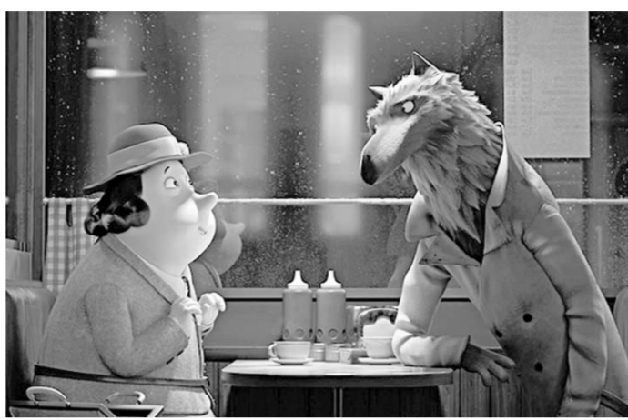
Кадр из мультфильма «Хулиганские сказки».

Этот мультфильм воронежцы увидели за месяц до его выхода в российский прокат. Программа фестиваля, проводимого при поддержке Фонда Михаила Прохорова, условно поделена на две части – зарубежную и российскую. В блоке «Премьеры» представлено всё самое новое и интересное, что происходит в отечественной анимации. Новшеством стал отказ от отдельного блока студенческой анимации. Все фильмы молодых режиссёров оказались перемешаны с работами маститых профессионалов. Значительную часть российской программы составили работы, появившиеся на известной студии «Союзмультфильм».