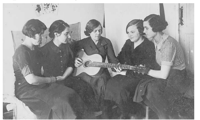
Студенты в новом общежитии. 1939 год. 1941 г.

Университет существует 22 года, и за это время он подготовил более 5000 специалистов, работающих на различных участках социалистического строительства.