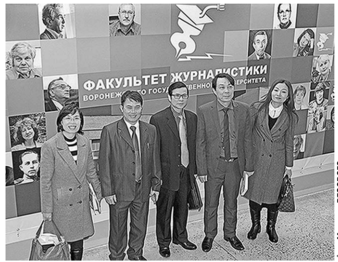
Делегация Вьетнама – гость ВГУ.

ВГУ подписал меморандум о сотрудничестве с Военным университетом культуры и искусства Вьетнамской народной армии.