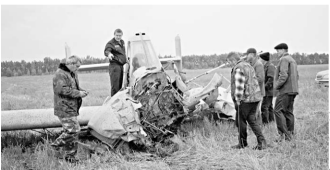
Первый кадр после авиакатастрофы.

Комиссия Межгосударственного авиационного комитета (МАК) завершила расследование происшествия с частным самолетом «Ежик» RA-0343G, произошедшего на территории района в прошлом году.