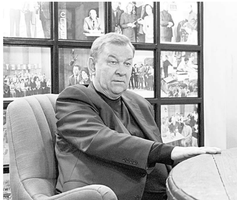
Генеральный директор Большого театра Владимир Урин.

Говоря о Платоновском фестивале, директор Большого театра