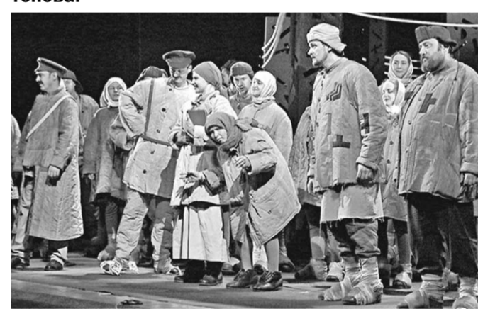
Сцена из оперы «Родина электричества».

Воронежский театр оперы и балета привёз в Москву, на фестиваль спектаклей-номинантов российской национальной театральной премии «Золотая маска» первую в мире оперу по произведениям Андрея Платонова.