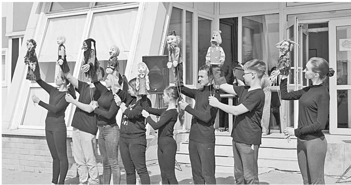
Участники театра-студии «Кукломания».