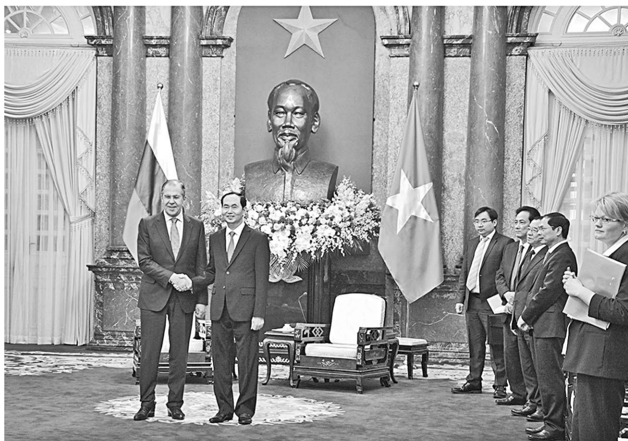
Министра Сергея Лаврова приветствует президент Социалистической Республики Вьетнам Чан Дай Куанг.

Переговоры с министром иностранных дел Японии Таро Коно проходили в Доме приемов «Икикура». На совместной пресс-конференции по итогам переговоров руководителей внешнеполитических ведомств было озвучено, что «проведен обстоятельный обмен мнениями по широкому спектру вопросов российско-японских отношений». Министры обсудили состояние и перспективы двустороннего политического диалога, торгово-экономического сотрудничества и связей в культурно-гуманитарной сфере в контексте проведения в 2018-м Годов России в Японии и Японии в России. Основное внимание уделено подготовке предстоящего в мае 2018 года рабочего визита премьер-министра Японии Синдзо Абэ в Россию для участия в Петербургском международном экономическом форуме и