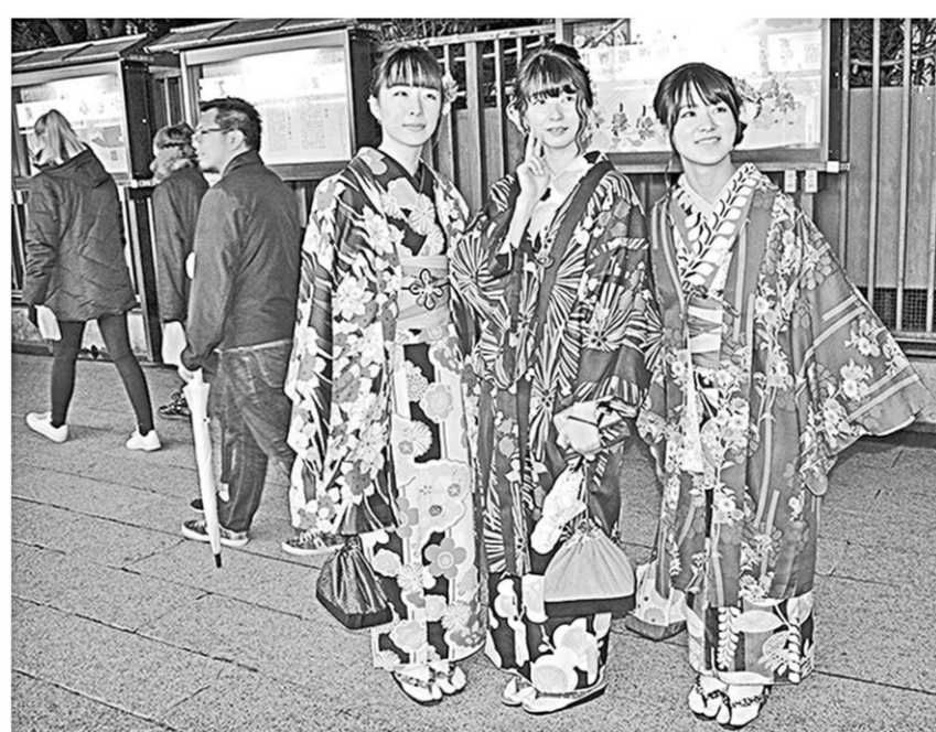
Японки в национальных нарядах – не такая уж и редкость на улицах столицы.

Российская сторона удовлетворена активизацией политических, межпарламентских контактов. Ситуация же в торгово-экономической сфере по-прежнему остается неоднозначной: в прошлом году товарооборот между странами вырос на 13,9 процента, достиг 18,3 миллиарда долларов США, однако он не отвечает масштабам экономики двух стран. За последние пять лет (время пребывания Синдзо Абэ у власти) объем прямых инвестиций из Японии в Россию упал с 757 до 18 миллионов долларов США.