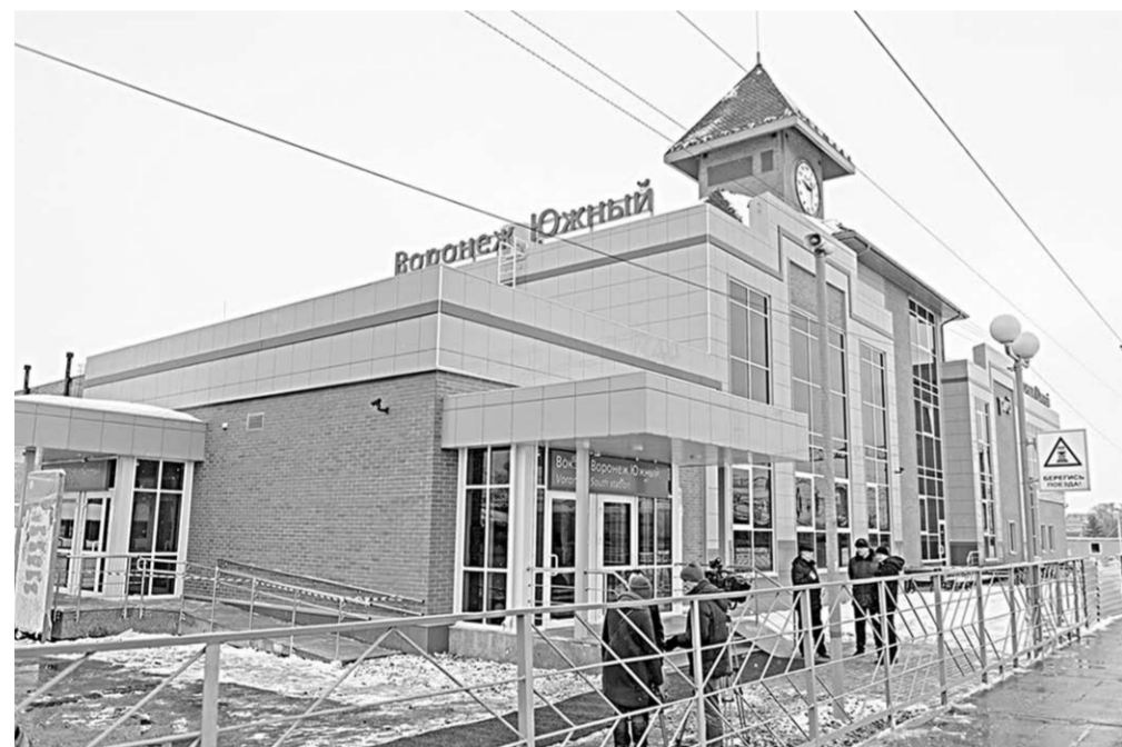
Уже в мае вокзал «Воронеж-Южный» примет первых пассажиров.

Экономика | Железнодорожный вокзал «Воронеж-Южный» на станции Придача откроют в конце мая