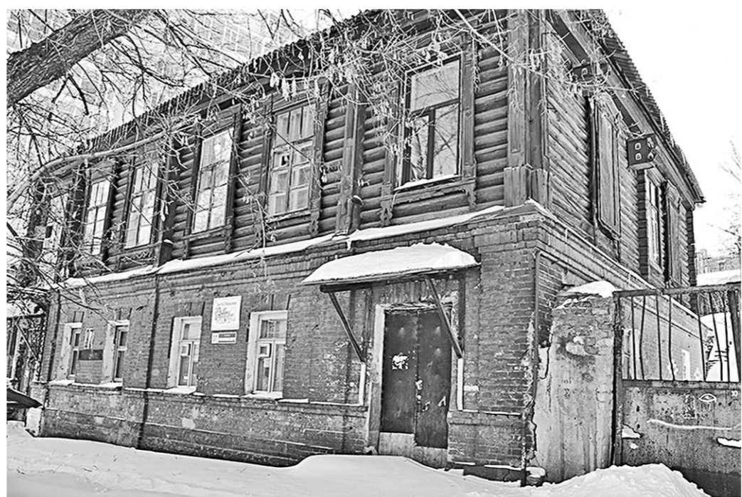
Этот дом на улице Помяловского – настоящий памятник истории.

в жизни страны и Воронежа, нашим замечательным землякам, чьи имена мы гордимся. И каждый раз приходится искать помещение для подобных мероприятий. Так пусть оно будет в центре города, а не на его задворках. Дом Медведевой – идеальное место для такого благого дела. Он расположен в шаговой доступности от гостиниц. Так что сюда всегда можно будет привести туристов. Им будет что показать, о чем рассказать. История Воронежа того стоит.