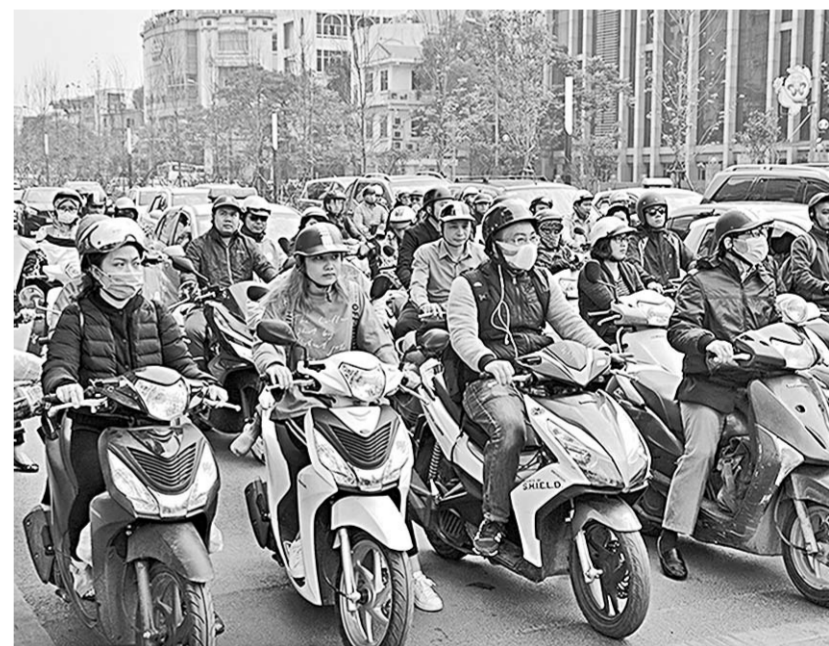
Основное средство передвижения в Ханое – это мопед.

Объем взаимной торговли в 2017 году вырос на 36,2 процента и составил