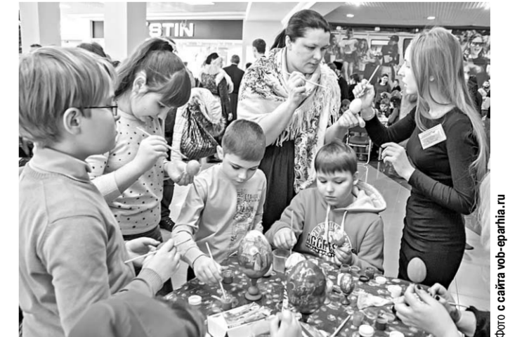
Дети с увлечением расписывали пасхальные яйца.

творчества. Не осталось без внимания и большое, в человеческий рост, пасхальное яйцо. Как всегда, каждый желающий мог приложить свою руку к его украшению и росписи. Созданные сувениры будут представлены на благотворительной выставке-ярмарке, которая пройдет на территории Сити-парка с 1 по 15 апреля. Средства, вырученные от продажи сувениров, направят на благотворительные проекты Воронежской епархии.