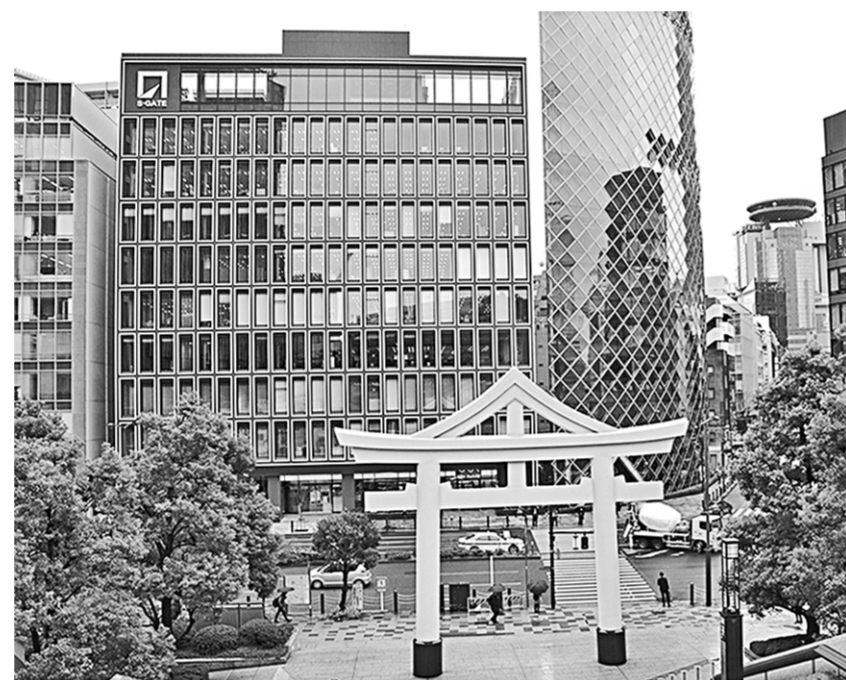
Сочетание восточных традиций и современности – отличительная особенность архитектуры Токио.

В столице Узбекистана 26-27 марта проходит Международная конференция высокого уровня по Афганистану «Мирный процесс, сотрудничество в сфере безопасности и региональное взаимодействие». Без участия России этот процесс невозможен, а значит, на форуме обязательно должен присутствовать министр иностранных дел Сергей Лавров.