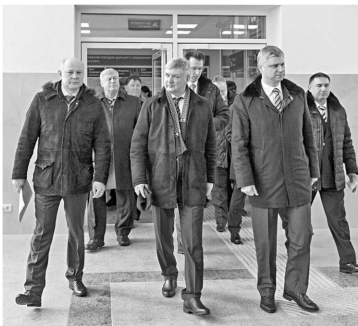
Врио губернатора Александр Гусев и глава РЖД Олег Белозёров осмотрели новое вместительное здание вокзала.

Об этом стало известно на встрече временно исполняющего обязанности губернатора Воронежской области Александра Гусева и главы ОАО «РЖД» Олега Белозёрова, посетившего регион с рабочим визитом в четверг, 22 марта.