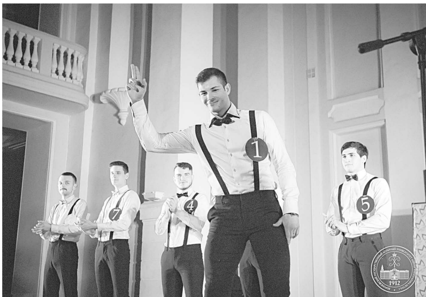
Один из моментов конкурса.