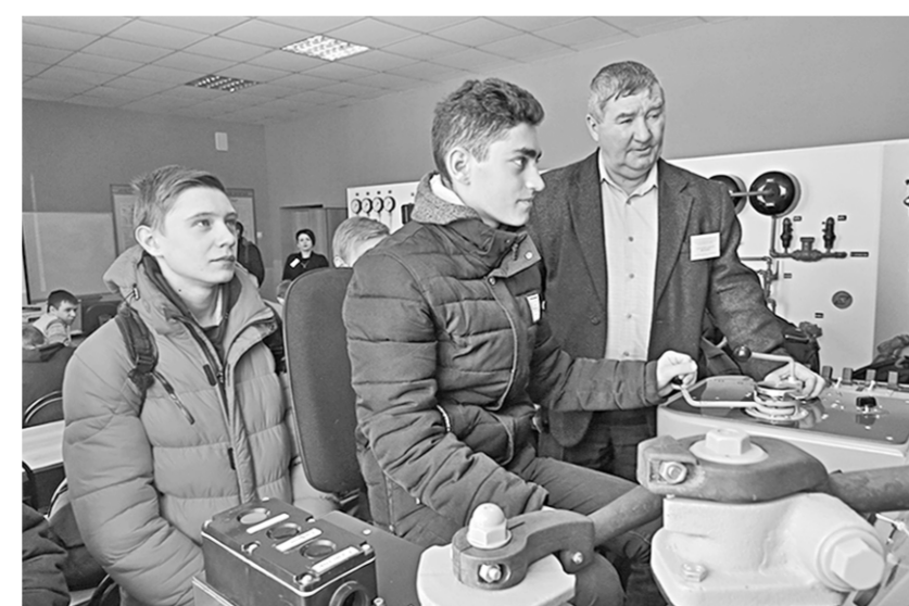
Первое прикосновение к профессии машиниста.