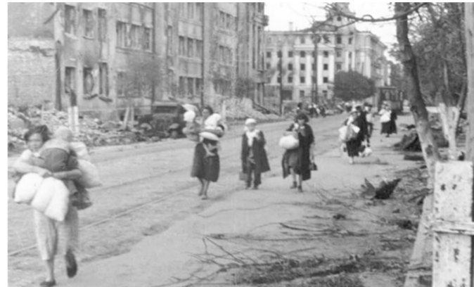
Мирные жители на улице оккупированного Воронежа. Лето 1942 года.