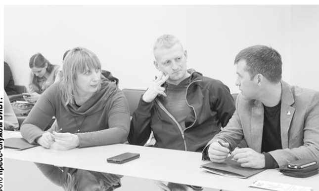
За «круглым столом» ЦГВ – старые друзья и новые лица.