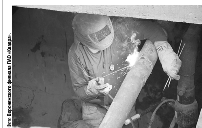
Подготовка к ремонту.

«Квадра» в этом году заменит более тридцати километров тепловых сетей, а также отремонтирует генерирующее оборудование ТЭЦ и котельных.