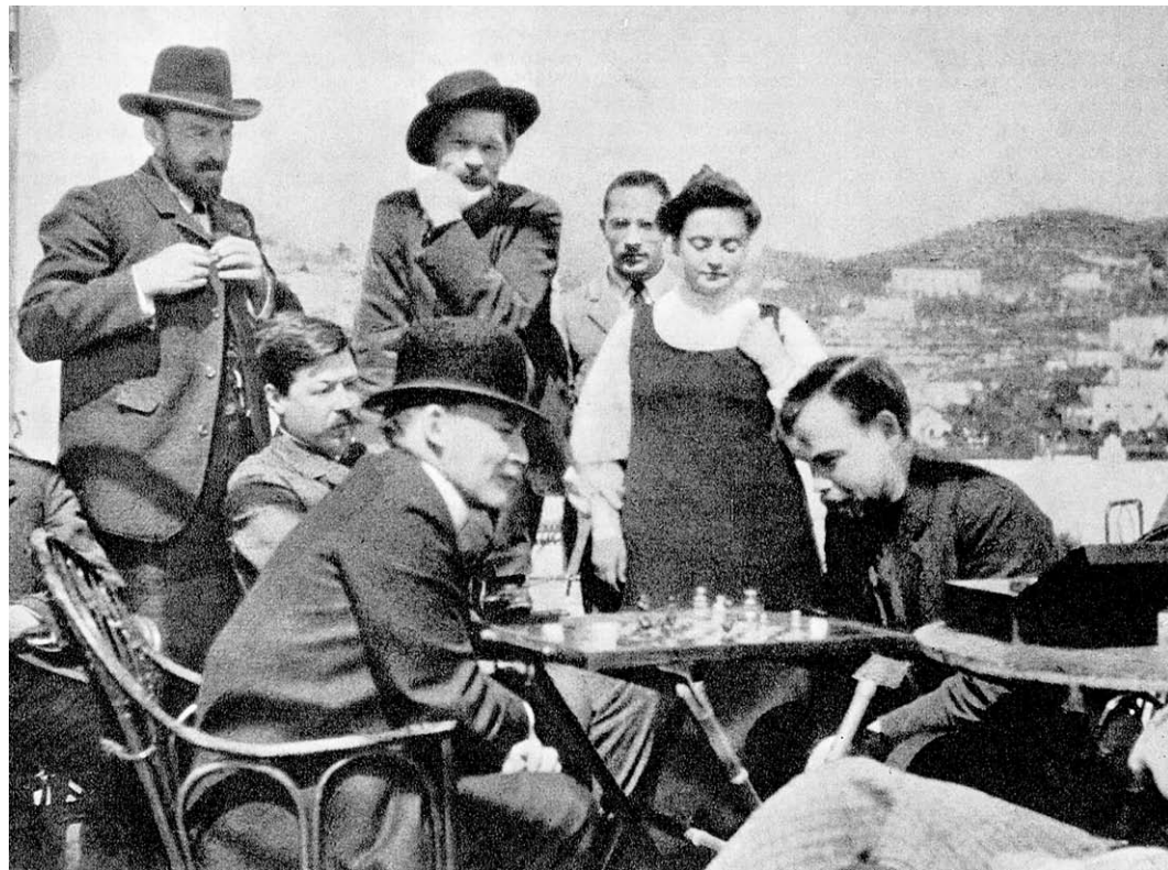
Тот самый снимок, который в советское время многократно тиражировали – «Ленин на Капри у Горького».

других точек показывает всю группу отдыхающих. Ленин на фотографиях выглядит непривычно: без бороды, с большими усами и гладко вы-