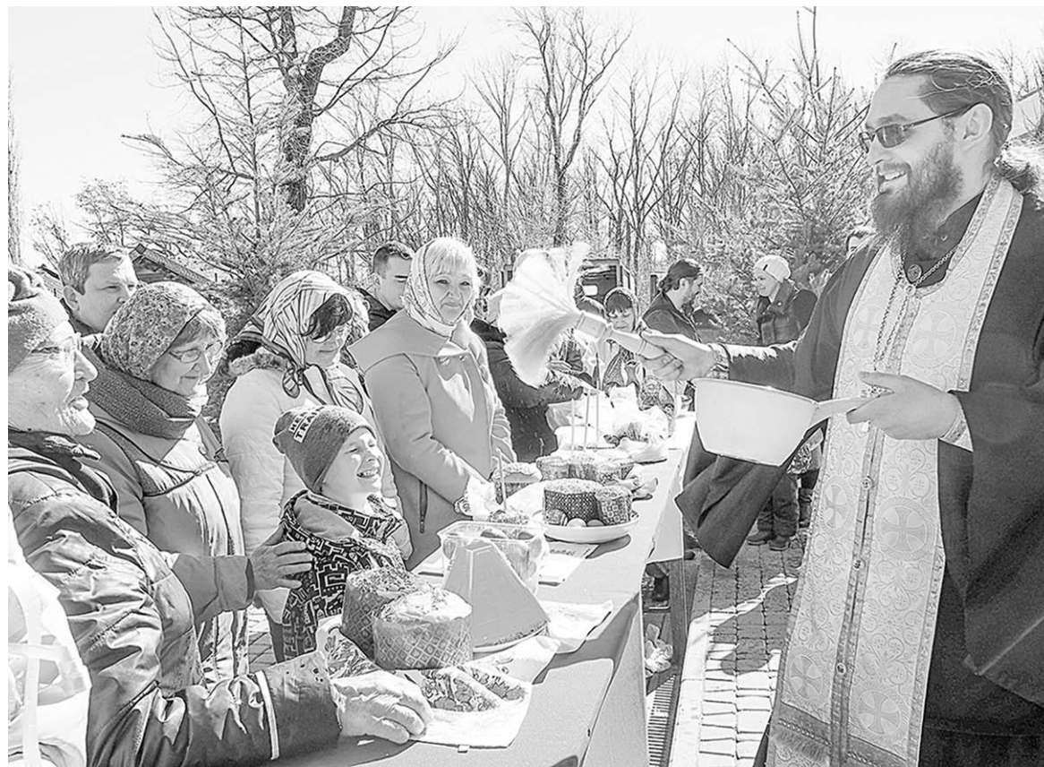
Пасхальные куличи – символ православной Пасхи. Настоящий праздник без них немислим.

Торжество и радость Светлой седмицы дополнил ещё и подарок – творческий. Красивой традицией стало выступление в рамках Московского Пасхального фестиваля Симфонического