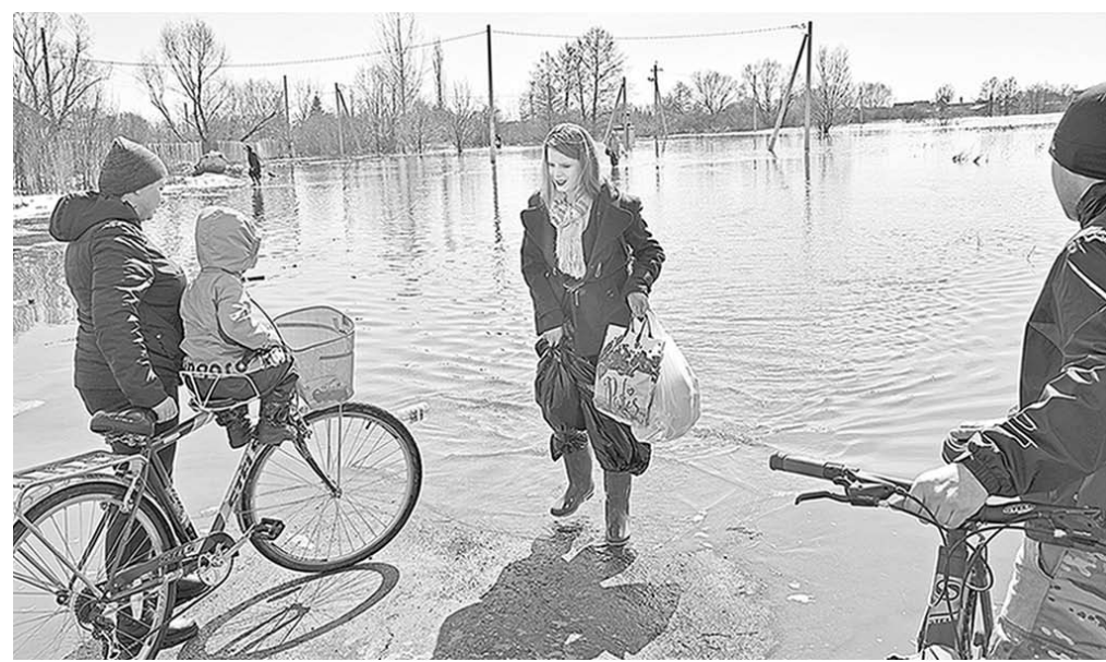
Этот снимок сделан в минувшее воскресенье на окраине села Новая Усмани. Вода в некоторых местах подступила к жилым домам.

Талая вода продолжает прибывать. По информации пресс-службы ГУ МЧС России по Воронежской области, к вечеру воскресенья в Воронежской области оказались затопленными 19 низководных мостов, расположенных в 12 муниципальных образованиях региона. По три моста подтоплено в Таловском и Грибановском районах области, по два – в Калачеевском, Новохопёрском, Эртильском и Лискинском районах. По одному – в Борисоглебском городском округе, в Петропавловском, Бутурлиновском, Терновском и Подгорненском районах. В результате подтопления мостов нарушилось транспортное сообщение в селах Заброды Калачеевского района и Вязда Бутурлиновского района. Силами местной администра-