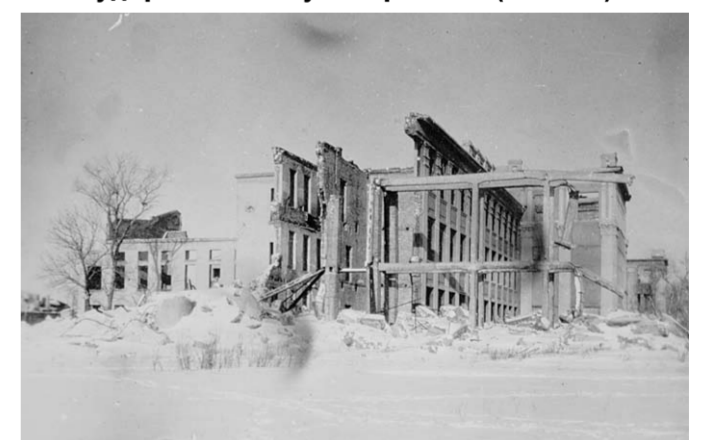
Развалины нового корпуса ВГУ на улице Ф.Энгельса, 1944 год.