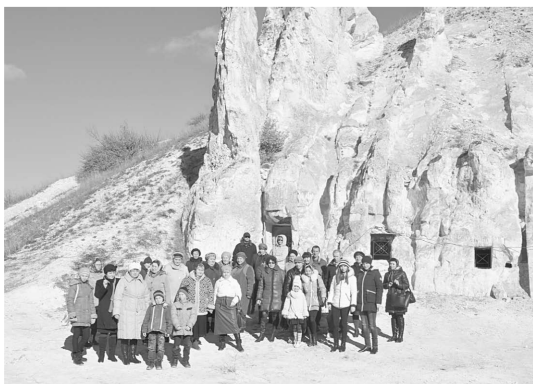
Туристы у меловых див.

Однако возрастающий интерес к «жемчужине Придонья» диссонирует с состоянием её нынешней инфраструктуры. Существующая автомобильная дорога к Дивноегорью, по словам сотрудников ГИБДД, не отвечает требованиям безопасности при пассажирских перевозках, а железнодорожная станция фактически представляет собой обычную открытую платформу на остановой площадке 143-го километра. На устраи-