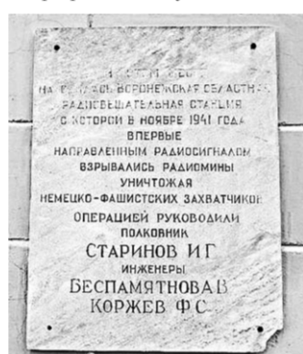
Памятная доска на здании больницы в Семилуках.

Старинов, получив от штаба обороны до 25 человек подрывников, успел расставить на Белгородском шоссе и городе на площади Тевелева (сейчас это площадь Конституции) ряд мин и сюрпризов. Водохранилище в Лозовенко было уничтожено взрывом накануне боя полковником Стариновым. Инженерными частями фронта под руководством Старинова произведены работы по устройству мино-подрывных сооружений замедленного действия (МЗД) на подступах к Харькову, в самом городе и Чугуеве. Заградительные работы по устройству МЗД произведены на дорогах, ведущих из Харькова в Новую Воллогу, Богодухов, Вадики, Чугуев, Марфа. Всего установлено