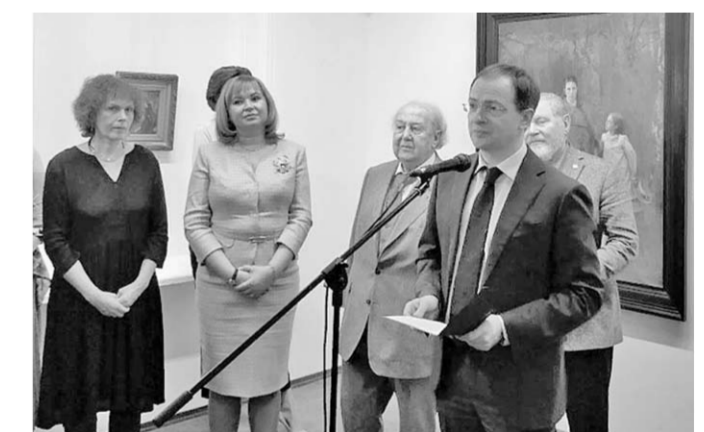
Выставку И.Н.Крамского открыл министр культуры РФ Владимир Мединский.

В Галерее искусств Зураба Церетели Музейно-выставочного комплекса Российской академии художеств открылась выставка «В кругу товарищей. К 180-летию со дня рождения И.Н.Крамского».