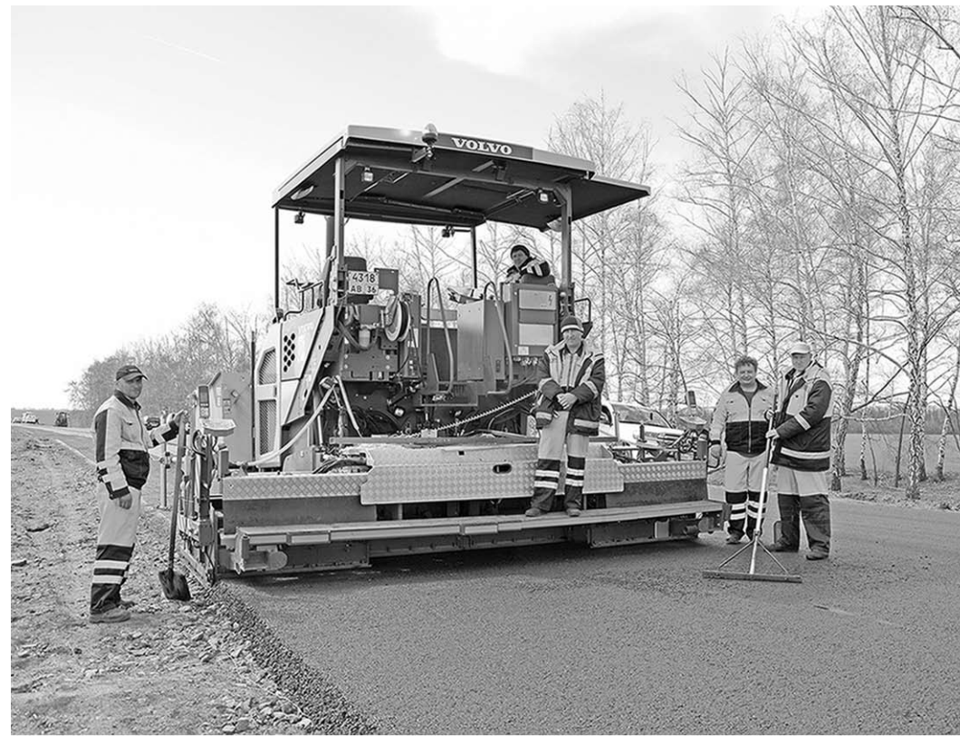
Прямо на глазах за несколько часов на ремонтном участке появляется свежее дорожное полотно.

результате дороги расширили на два метра и произвели укладку армирующей сетки. На этом участке очень интенсивное движение.