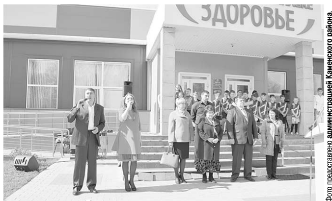
Ведущие рассказали о целях акции «Живи долго!».

В Каменском РДК в рамках областного межведомственного проекта «Живи долго!» прошла оздоровительная акция. Каменцам рассказали много нового о современных методах лечения болезней.