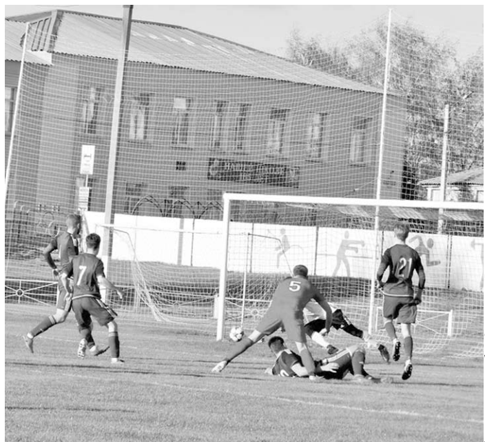
«Спартак» (Россошь) – «Атом» (Нововоронеж). Опасный момент у ворот команды гостей.

В минувший уик-энд состоялись матчи второго тура первенства России по футболу среди команд третьего дивизиона МОА «Черноморье».