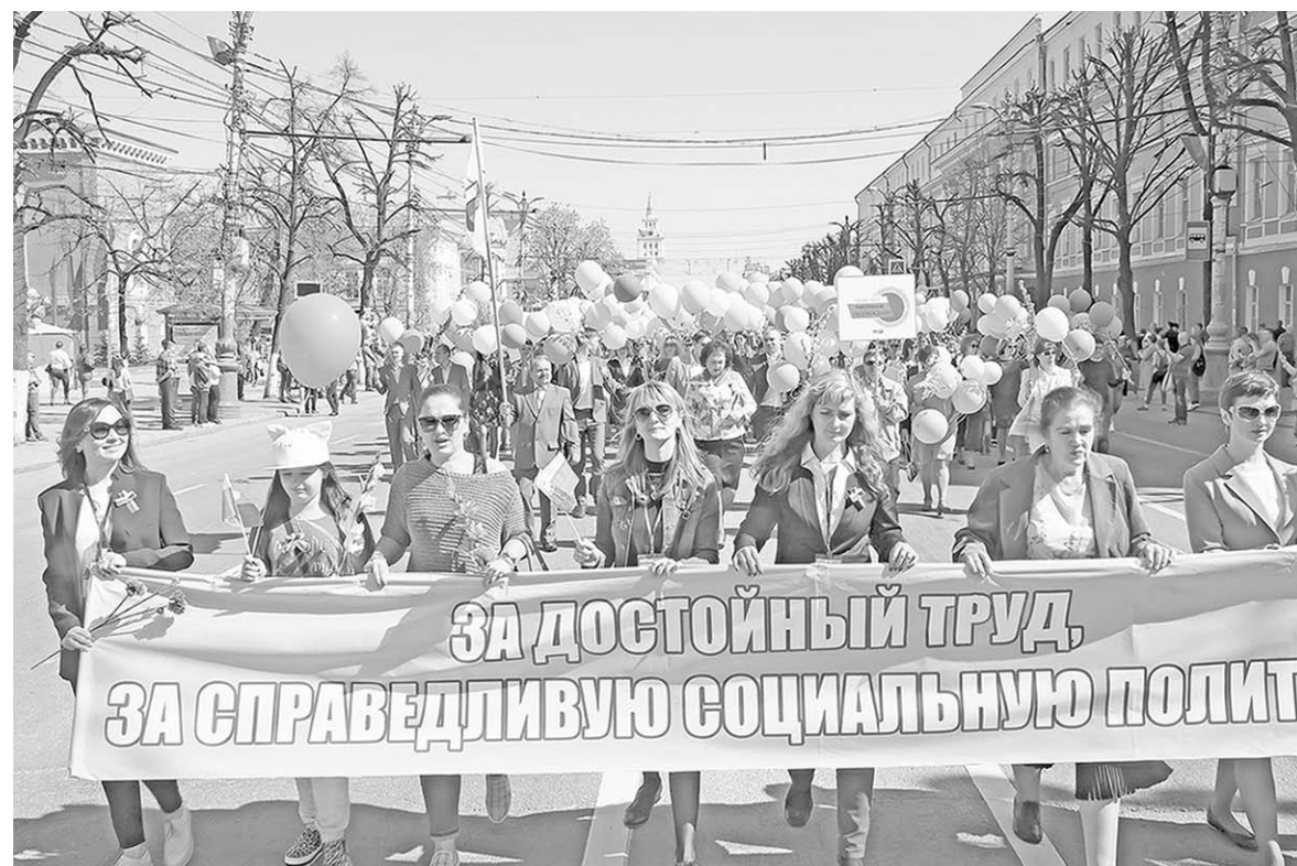
В Первомайских колоннах – трудовые коллективы Воронежа.

В этот раз шествие прошло под девизом «За достойный труд и справедливую социальную политику!» Среди лозунгов самыми заметными были: «Единство, солидарность, справедливость!», «Мир, труд, братство – жизнь без войны и санкций!», «Достойный труд, достойная зарплата, достойная пенсия!». Однако им было непозволительно конкурировать с новым персонажем Первомайского шествия – танцующим медведем, который украшал колонну пар-