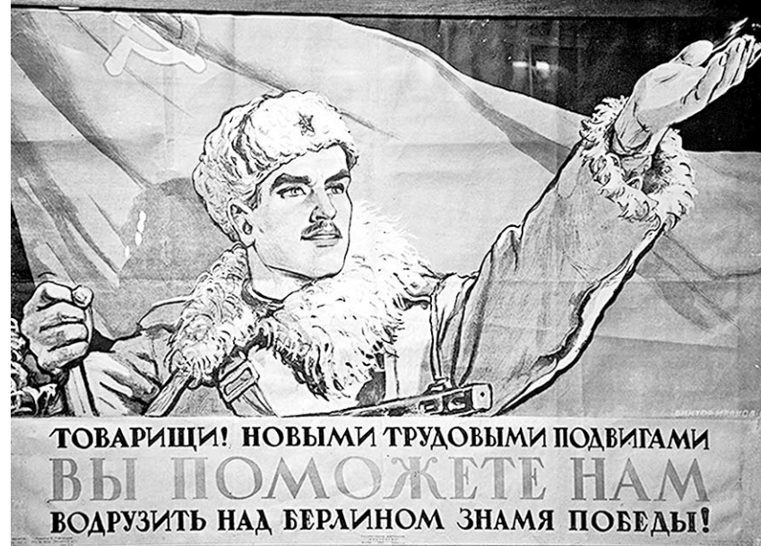
Плакат Виктора ДЕНИСОВА

необыкновенную силу воздействия на массы. Газета «Правда» писала о нем: «Сделать врага смешным – наполовину побить его». Образ этого врага, как и образ народа, силотившегося для защиты Родины, ярче всего представлен на плакатах военного времени, поднимавших пропагандистское искусство на небывалую высоту.