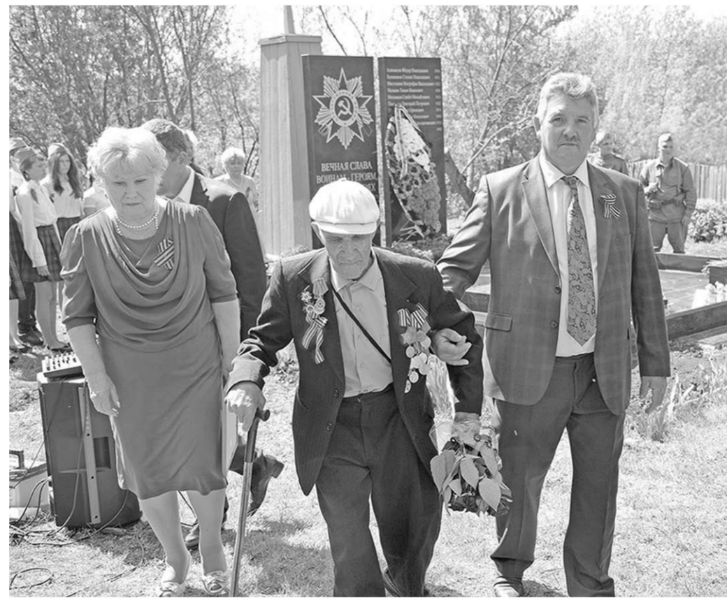
У обновлённого обелиска.

День Победы | В хуторе Россошка Хохольского района торжественно открыли новый обелиск воинам-освободителям