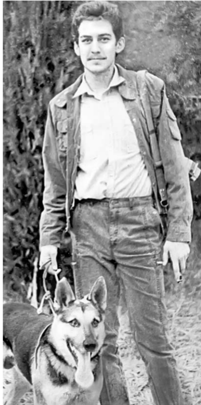
Воронежские чекисты, ветераны войны в Афганистане, поздравляют своего земляка, соратника по Афганской войне, выполнявшего интернациональный долг в составе подразделений КГБ СССР.

Крепко жму руку! Б.И. ГРИБАНОВ, генерал-лейтенант в отставке, командующий Западной группой Погранвойск России (1994-2001).