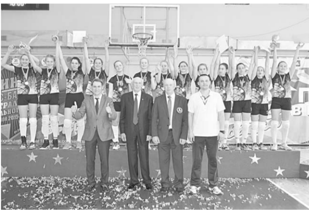
Сборная Воронежской области по волейболу – победитель турнира «Летающий мяч».

Отрадно отметить, что в турнире «Летающий мяч» среди девушек первое место заняла сборная Воронежской области, опередившая на пьедестале почёта команды Челябинской и Свердловской областей! У юношей в тройку призеров вошли: «Москва-73-Виктория», «Москва-Олимп» и Красноярский край. А сборная Воронежской области заняла последнее, двенадцатое, место.