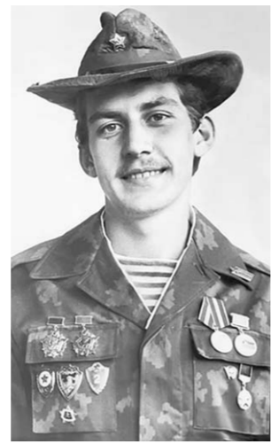
Уважаемый Евгений Валерьевич!

– временно исполняющему обязанности заместителя губернатора – первого заместителя председателя правительства Воронежской области