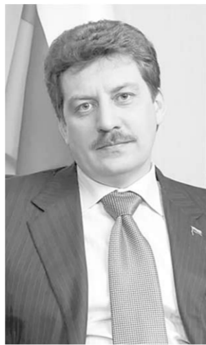
стойко прошли все испытания. Вам довелось нести особую и нелёгкую службу в одной из провинций Афганистана.

Знаю, что Вы с радостью и желанием шли служить в пограничные войска. До-