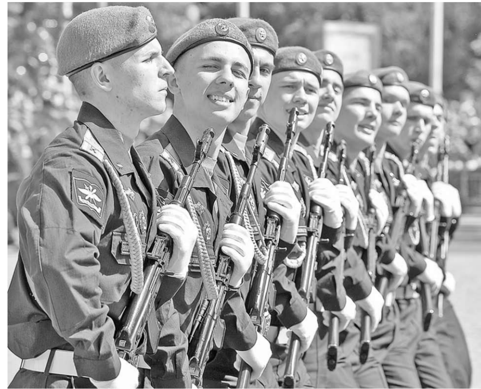
В парадном строю – курсанты военной академии.