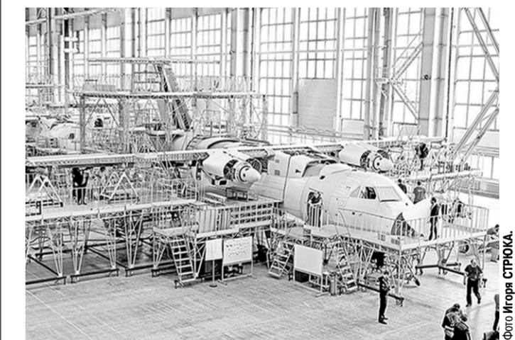
Самолёт Ил-112В – на сборке.

Лётный образец перспективного лёгкого военно-транспортного самолёта Ил-112 В успешно прошёл первую проверку на герметичность и влагонепроницаемость фюзеляжа на заводе-изготовителе ПАО «Воронежское акционерное самолётостроительное общество». Об этом сообщает пресс-служба Дивизиона транспортной авиации ПАО «Объединённая авиастроительная корпорация».