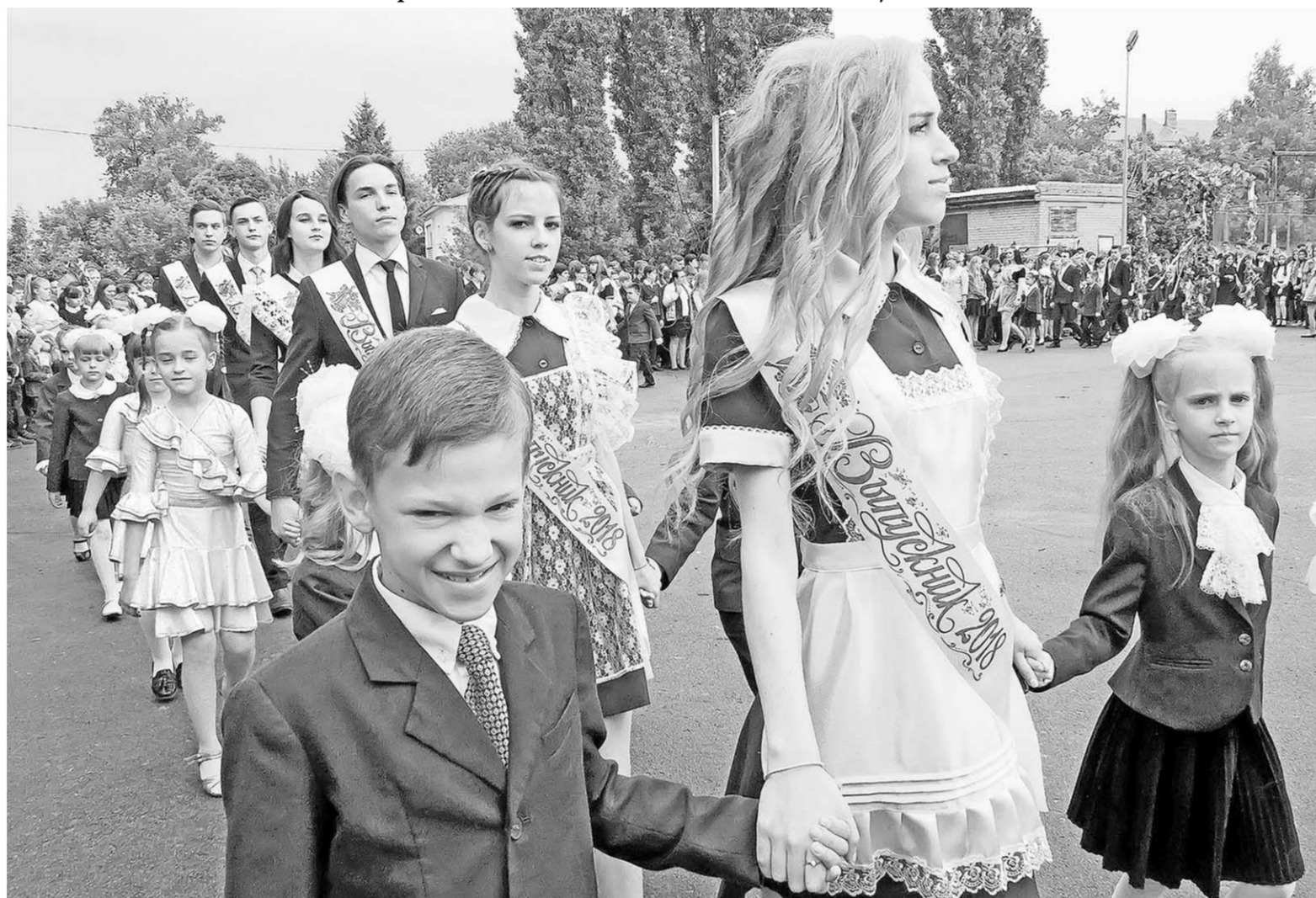
Нынешние и будущие выпускники Новоусманского лицея.

Репортаж | Для воронежских школьников в эти дни звучит последний звонок