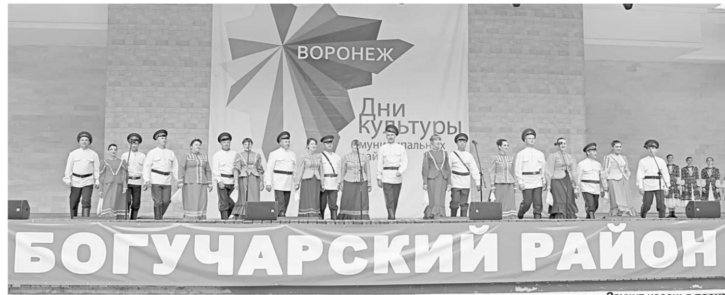
Звучит казачья песня.

В этом же ключе предельно искреннего игрового исполнительства работает фольклорный ансамбль «Черешенька». Не знаю, как у кого, но у меня