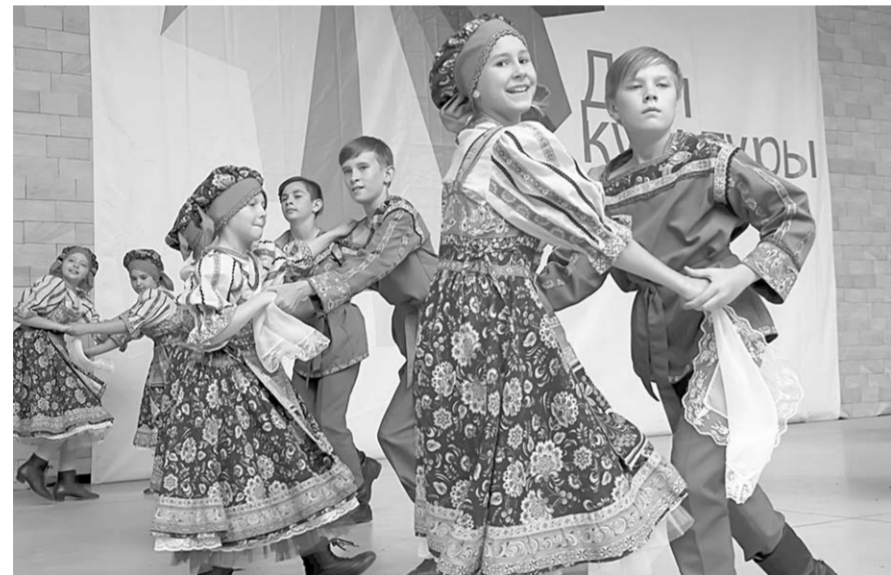
Ребята танцевали с настоящим азартом.