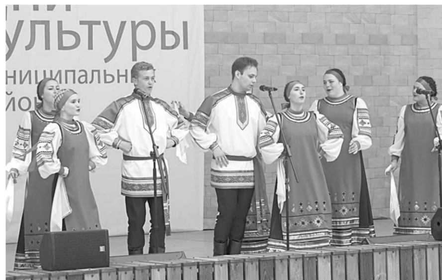
Поют ребята из ансамбля «Ивушка».