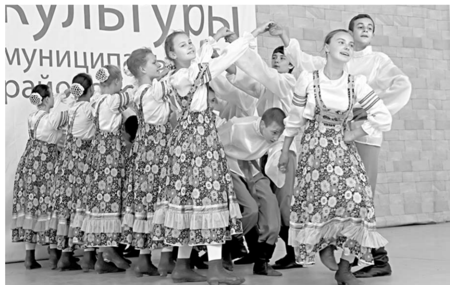
Безудержно веселье разливалось, когда на сцену выходили танцоры из ансамбля «Каблочки».

вату на свою малую родину в Коршево. И всю жизнь учил ребят родному языку и родной словесности.