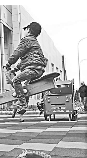
На площадке детского сада «Ромашка».

На территории Абрамовского сельского поселения и сегодня находятся промышленные и сельхозпредприятия, развиваются крестьянско-фермерские и личные подсобные хозяйства.