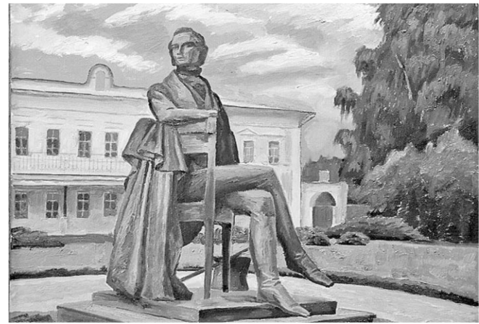
Одна из картин, представленных в «Подъёме». А.Пименов «Памятник Д.В.Веневитинову».