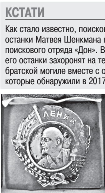
Тот самый орден Ленина.