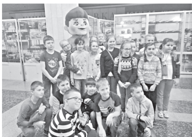
Победители фестиваля «Звезда спасения».

В музее Победы на Поклонной горе в Москве состоялся гала-концерт, на котором представители МЧС России наградили победителей II Всероссийского героико-патриотического фестиваля детского и юношеского творчества «Звезда спасения».