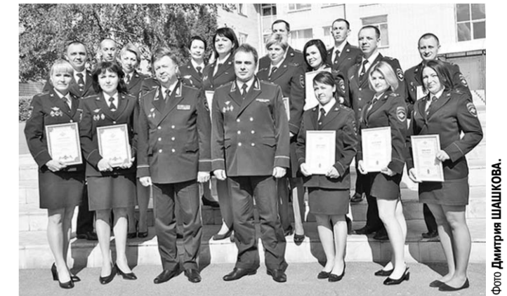
Победители и призёры конкурса с наградами.

Подведены итоги Всероссийского конкурса профессионального мастерства среди сотрудников территориальных органов МВД РФ на звание «Лучший по профессии», который прошёл в Воронежском институте МВД России. В числе его победителей – представитель ГУ МВД России по Воронежской области.