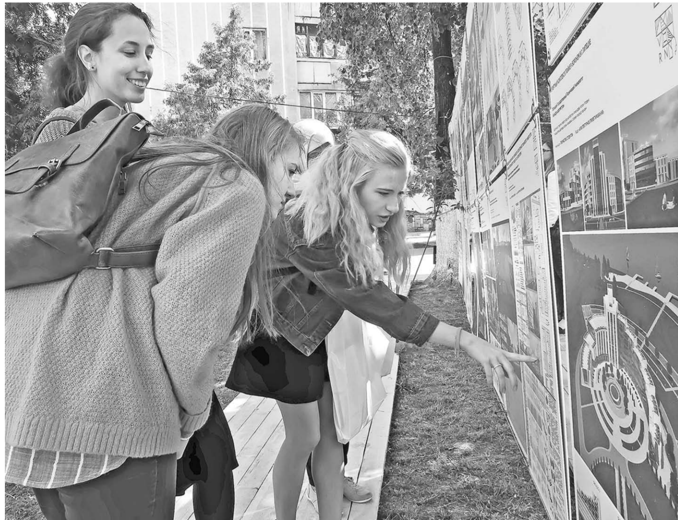
Воронежцы с большим интересом изучали проекты молодых архитекторов.

Общество | Архитектурный форум «Зодчество VRN 2018» привлёк внимание не только профессионалов