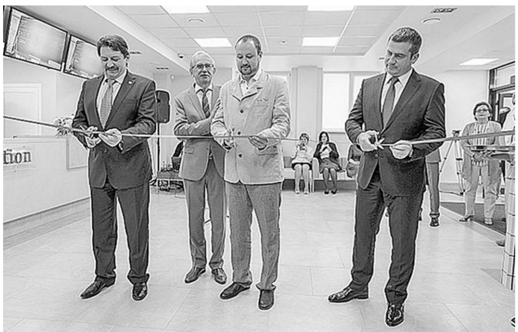
Здесь самые смелые идеи воплощаются в жизнь.

В Воронеже открыта круглосуточная клиника детской хирургии, травматологии и ортопедии