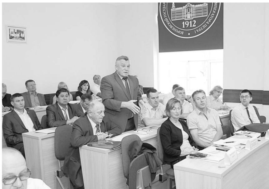
Выступления баварцев нашли живой отклик у воронежских участников семинара.