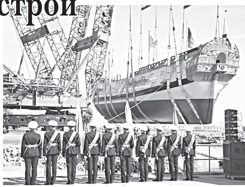
Спуск «Полтавы» на воду.

морского наследия России, начинается с традиций. Лидер ДПФ напомнил о построенной четыре года назад в Воронеже копии первого российского линейного корабля-музея «Гото Предестинация», в открытии которого он принимал участие. После завершения строительства и оснащения «Полтавы» корабль станет центром большого современного интерактивного музейного комплекса, посвящённого морской истории России. В этой связи лидер ДПФ предложил подумать о создании на базе таких морских исторических центров общероссийского мультимедийного историко-просветительского проекта, который позволил бы поднять дело популяризации морского наследия и океанского будущего России на должную высоту. — Сегодняшнее событие — один из важных примеров удачных и само-