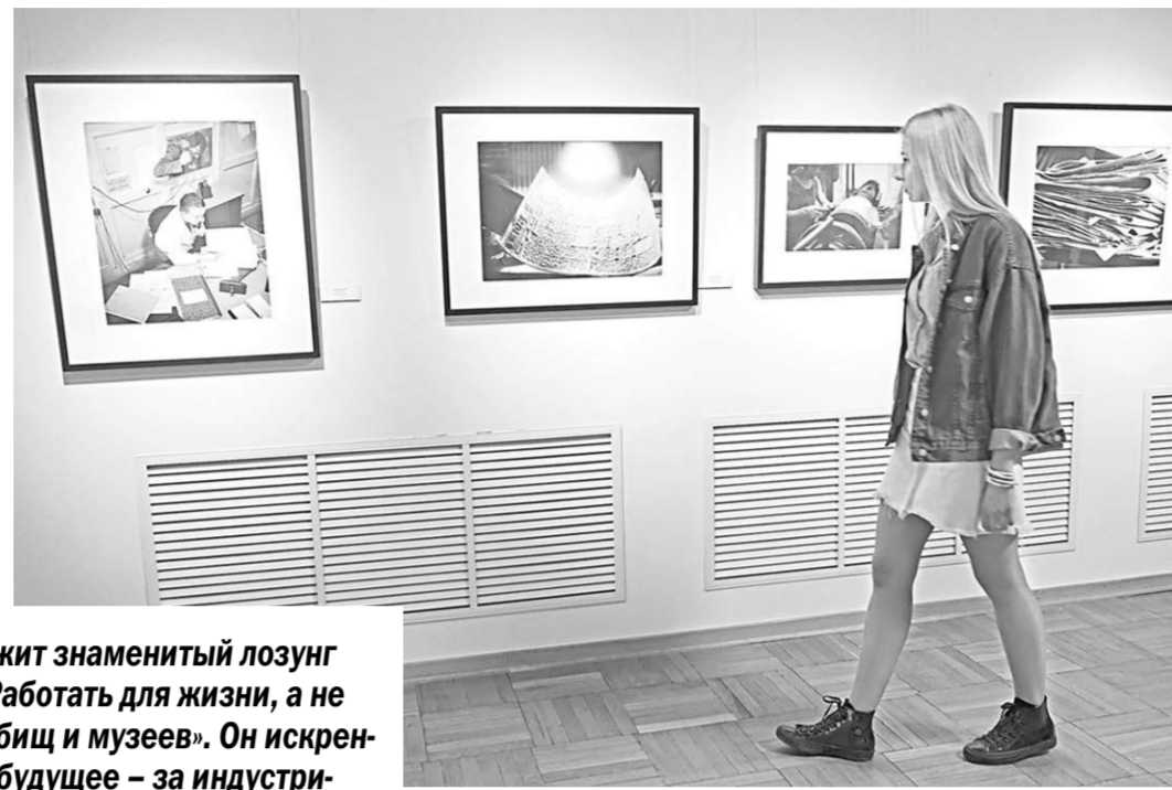
На выставке можно увидеть, как работали в 1920-е заводы и газеты, а также результаты их труда.

графий, посвящённых жизни московских заводов: «АМО» и «МОГЭС», на которых производилась сборка автомобилей, а также электрические лампочки и собирались генераторы для электростанций. Внимательно изучив снимки Родченко, мож-