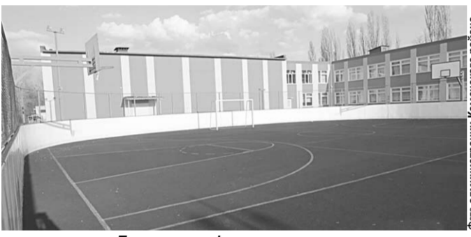
Такая многофункциональная спортивная площадка появится скоро у школы №2.

Несмотря на финансовые трудности, Каменский район не останавливается в своём экономическом развитии.