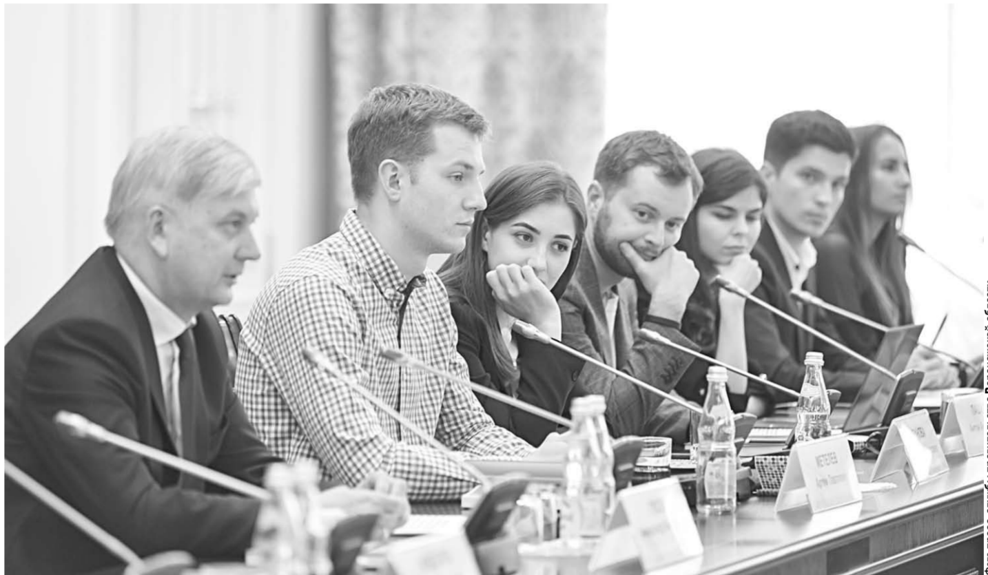
Глава региона напомнил, что в 2018 году существенно вырастет поддержка волонтерского движения в Воронежской области.