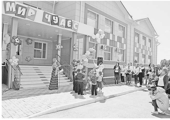
Открытие детского сада стало настоящим подарком для ольховатцев.

Отныне об очереди в дошкольные учреждения родителям и их малышам можно забыть. «Мир чудес», построенный в посёлке Большие Базы Ольховатского городского поселения, готов принять 220 ребят от полутора до семи лет. Большинство ребят придут сюда из старого здания и детсада «Белочка».