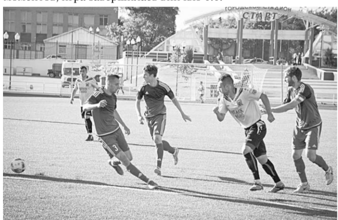
Футболисты Нововоронежа и Смоленска провели немало времени в атаке, но поразить ворота соперника так и не смогли.

Один из фаворитов турнира – нововоронежский «Атом» – принимал на своем поле дерзкого дебютанта – смоленский клуб «Красный-СТАФКСТ». Несмотря на обилие голевых моментов, игра завершилась ничью 0:0.