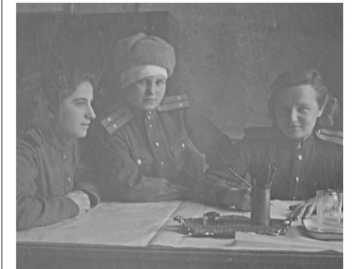
Студентки биофака ВГУ – офицеры Советской Армии.