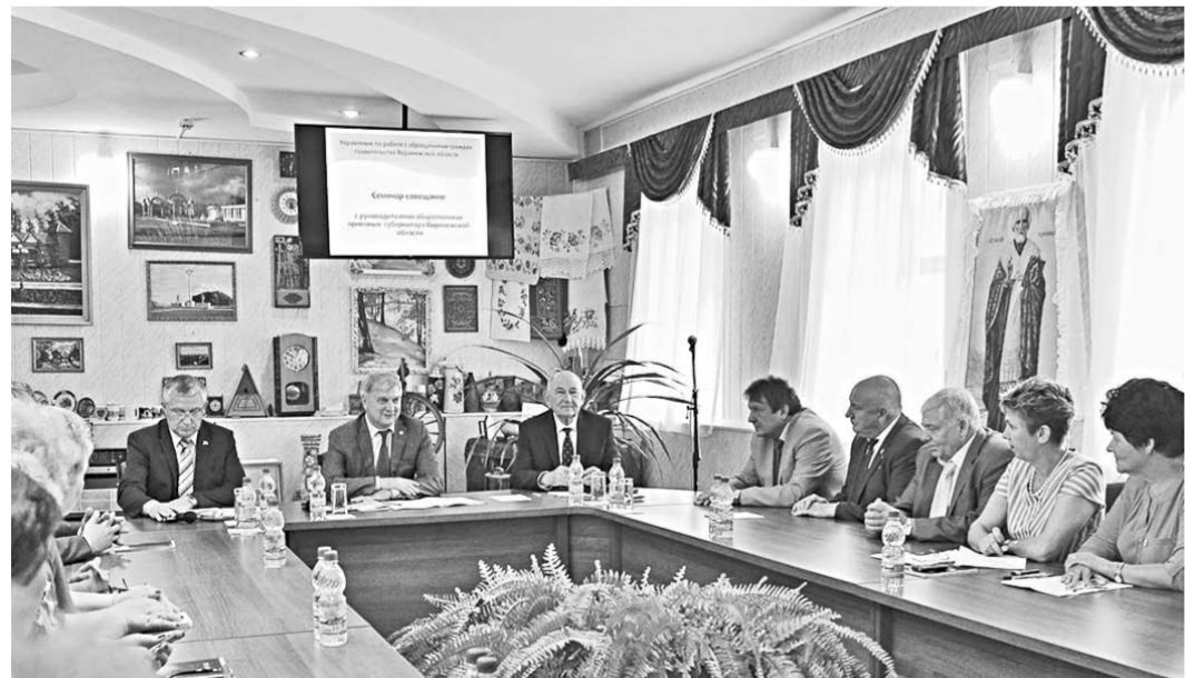
Александр Гусев на встрече с руководителями общественных приёмных губернатора обозначил векторы развития работы с населением.

политических партий, депутаты разных уровней, члены различных гражданских и общественных институтов. В последние годы приёмы стали проводить с участием правоохранительных органов, сотрудников прокуратуры на местах, что позволяет оперативно реагировать на правонарушения, если информация о них поступает в ходе проведения приема граждан. Для консультации граждан по правовым вопросам на многих приёмных сегодня организуются бесплатные юридические консультации. «За последние годы нам удалось выявить и устранить немало «болеющих» точек, но самое главное – существенно сократить расстояние между властью и обществом», –