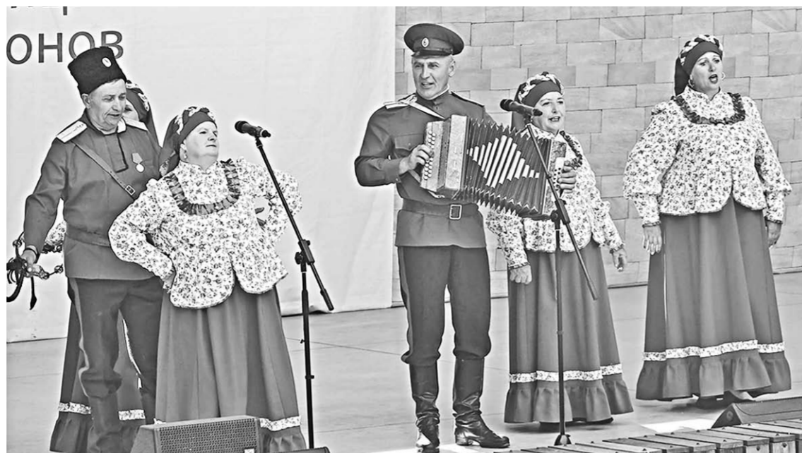
У верхнемамонцев казачья песня в чести.