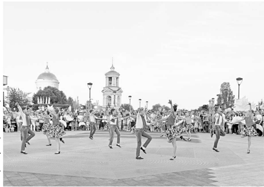
Нa прaздникe вoрoнeжцeв рaдoвaли свoими вьступлeниями вoкaльнoе и хoрeгрaфичeскie кoллeктивы.