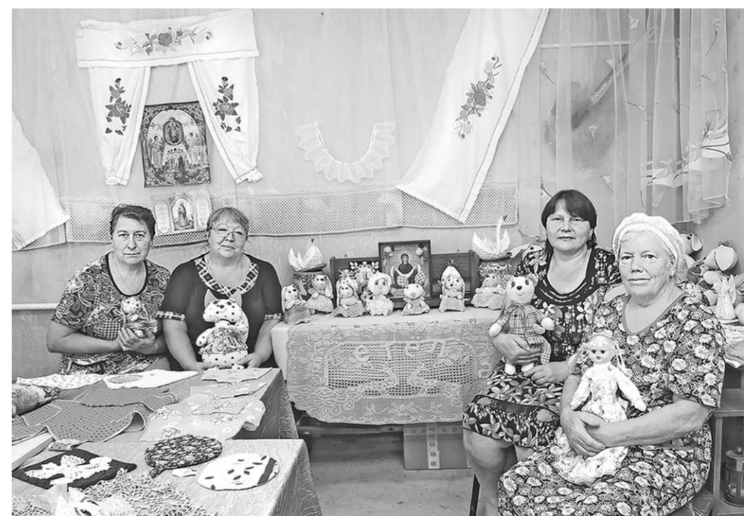
Мастерницы из шуберской «Светёлки».

Из натуральных материалов делают и так называемые «пряничные игрушки». Фи-