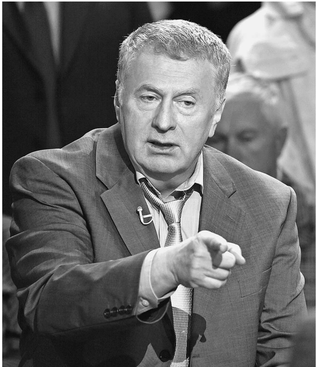
ЛДПР знает, как повысить пенсии, не повышая пенсионный возраст.

«Пуская повышение пенсионного возраста неизбежно, но ведь нет никаких предпосылок для того, чтобы делать это именно сейчас. Дайте людям прийти в себя от повышения цен на бензин! Разберитесь с