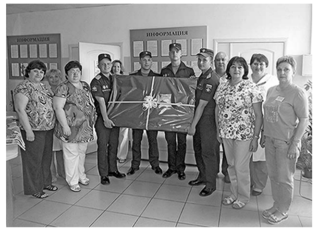
Сотрудники Воронежского областного центра социальной реабилитации ветеранов и инвалидов боевых действий.

Выпускники факультета летательных аппаратов Военно-воздушной академии имени профессора Н. Е. Жуковского и Ю. А. Гагарина посетили Воронежский областной центр социальной реабилитации ветеранов и инвалидов боевых действий.