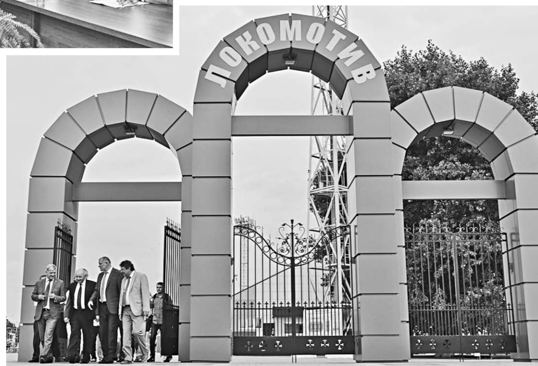
Стадион «Локомотив» является важным социальным объектом для Лисок. Его средняя посещаемость – 500-600 человек в день.

Врио губернатора рекомендовал как можно активнее использовать новые форматы работы с населением. В частности, обращать внимание на социальные сети и СМИ. По его мнению, руководство приёмных может более оперативно узнавать о проблемах и решать их до того, как люди