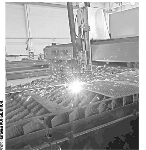
Плазменная резка металла в цехе металлоконструкций – пример внедрения на предприятии высоких технологий.

скота (хедлокки, разделители, решетки, крепеж хедлокков и калиток). Кстати, это как раз пример импортозамещения, так как раньше те же хедлокки приобретались за рубежом, в Польше. Чугунные автоподъемники, скреперные установки (являются аналогом импортных), навесные разбрасыватели удобрений, приспособления для транспортировки жаток – всё это, произведенное в ООО «Промавторемонт» в Митрофановке, пользуется спросом у аграриев.