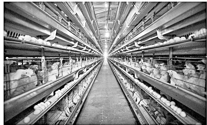
Так выглядит птицефабрика изнутри.

Строители обещают сдать под ключ новый культурно-досуговый центр в селе Третьяки раньше намеченного срока.