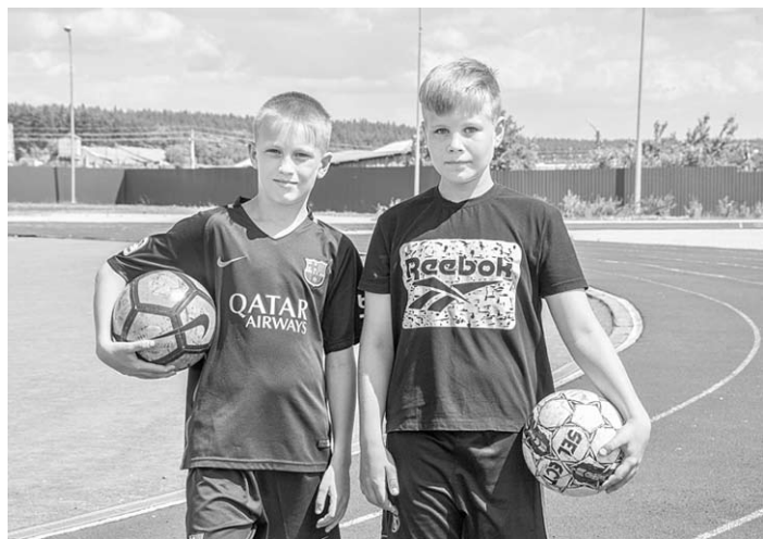
На стадионе – юная спортивная смена.