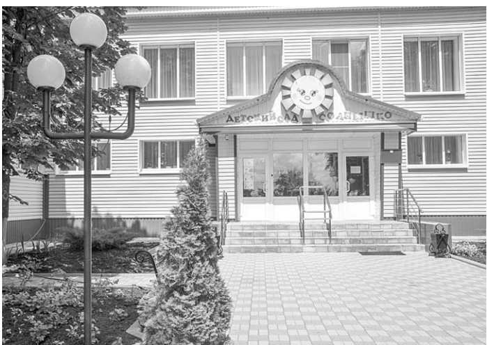
Детский сад «Солнышко» радует красотой, комфортом и добрым отношением к малышам.