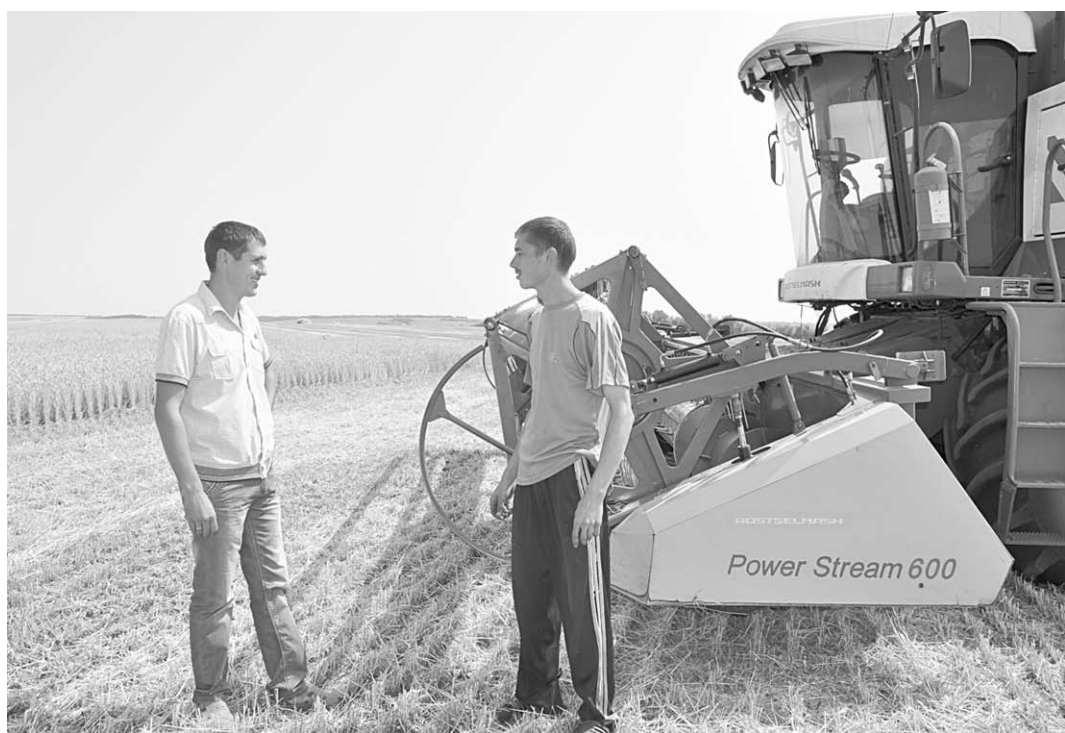
С полей Репьёвского района уже намолочено 30 тысяч тонн зерновых.

Промышленный потенциал района – это уверенное развитие ООО «Синтез-Ойл». Уникальный коммерческий проект направлен на производство свободных жирных кислот из соапсток (светлых