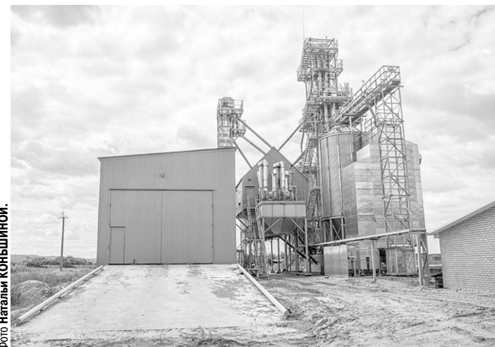
Элеваторный комплекс в Колбино – визитная карточка района.

Очевидные конкурентные преимущества этой земли видны и не нуждаются в отдельном представлении. Те, кто всерьёз рассматривает Воронежскую область как место для долгосрочных инвестиций, открыли для себя высокий потенциал Репьёвского района в плане развития сельскохозяйственного производства и переработки продукции АПК. Оценили качество социальной инфраструктуры района (образование, культура, спорт). Ощутили, какой серьёзный ресурс заложен в чистой реке Потудань, в щедрости дзешней природы, гарантирующей этим местам яркий взлёт туристического бизнеса. И сами репьёвцы со свойственной им активностью охотно подключаются к таким проектам, потому что жить без движения, без новых интересных дел не в их характере. Потому что у жителей самого маленького района есть очень большая мечта: создать для своей земли, для своих детей прочную экономическую основу и одержать новую победу в соревновании за лучшее будущее для своей малой родины.