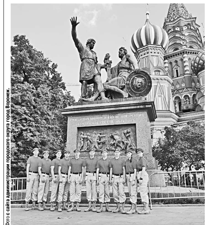
Ребята стали первыми среди 85 команд-участниц Всероссийских соревнований.

Воронежцы достойно выступили на всех этапах, а первое место заняли в тестировании на историческом этапе игры. К слову сказать, ребята стали первыми среди 85 команд-участниц со всех регионов нашей страны.