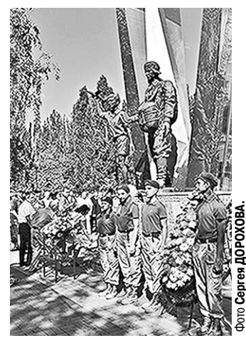
Возложение цветов к мемориалу «Воронеж – родина ВДВ».

Центром торжества стал парк Победы в Северном микрорайоне города, где установлен памятник «Воронеж – родина ВДВ». Именно в этом районе второго августа 1930 года высадился первый десант из 12 человек. Венки и цветы к мемориалу возложили десятки воронежцев – действующие военнослужащие, ветераны, их родные и близкие. А затем в парке стартовала большая праздничная про-