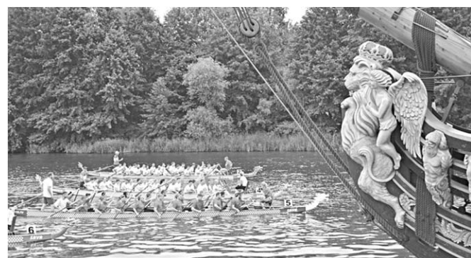
Интерес у воронежцев к соревнованиям по гребле на лодках-драконах заметно вырос.

Состязания на «драконах» впервые прошли в нашем городе в прошлом году. В первых стартах в гонке приняли участие 16 команд, а в этом их было уже 26. Участники представляли две группы – команды предприятий и организаций и «свободный класс».