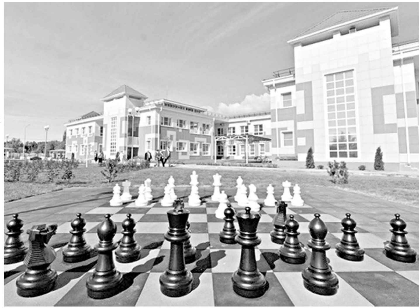
Новохоперск. Детский сад «Пристань детства».

– жилые дома и две школы: средняя школа на 1101 место в посёлке Боровое по улице Ф.Тютчева и Калачевская СОШ №6. Строительство школы в Боровом только начато, ещё впереди год строительных работ. А вот в Калаче, где идут реконструкция старого здания, пристройка актового зала, спортзала и пищеблока, работы почти завершены. Существующее здание школы заметно преобразилось: выполнена замена кровли, закончены внутренние отделочные работы. Нарядный фасад радует жителей города, итрая красками современных отделочных материалов. Кроме реконструкции старого здания возведена пристройка, в которой размещены актовый зал на 210 мест, современный спортзал и пищеблок с обеденным залом на 220 чело-