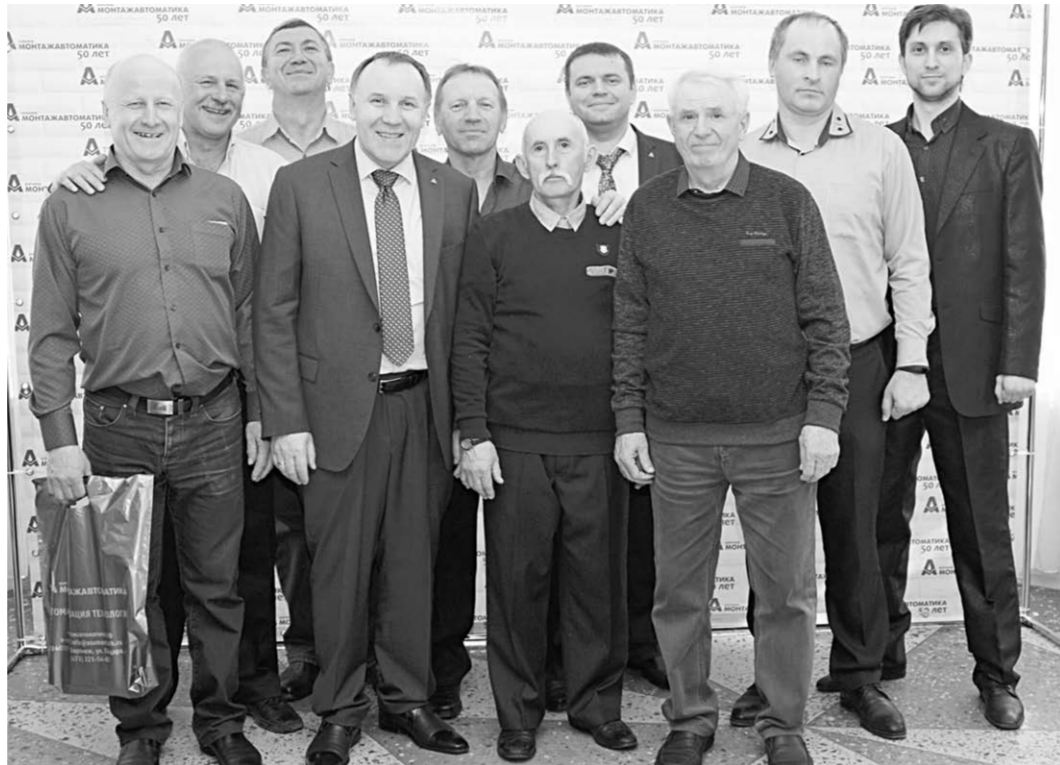
Энергичный коллектив ООО «Монтажавтоматика» умеет добиваться высоких результатов.