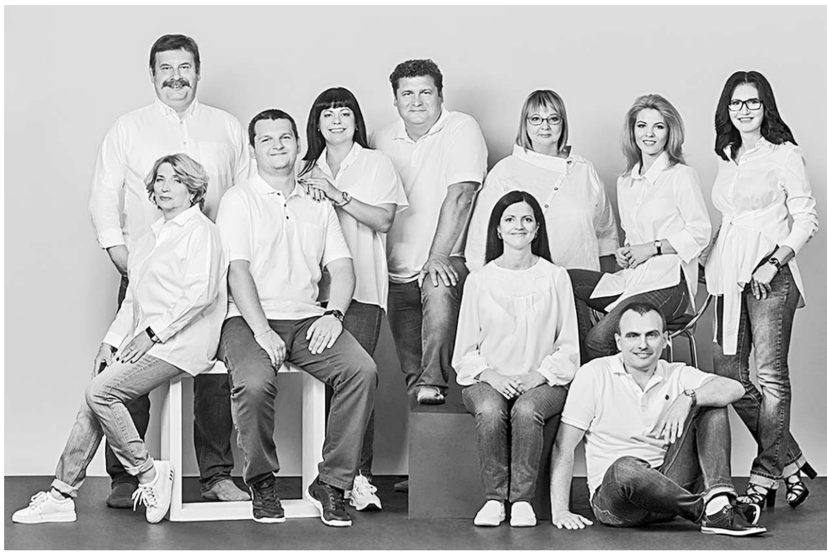
Дружная команда ГК «Крайс».