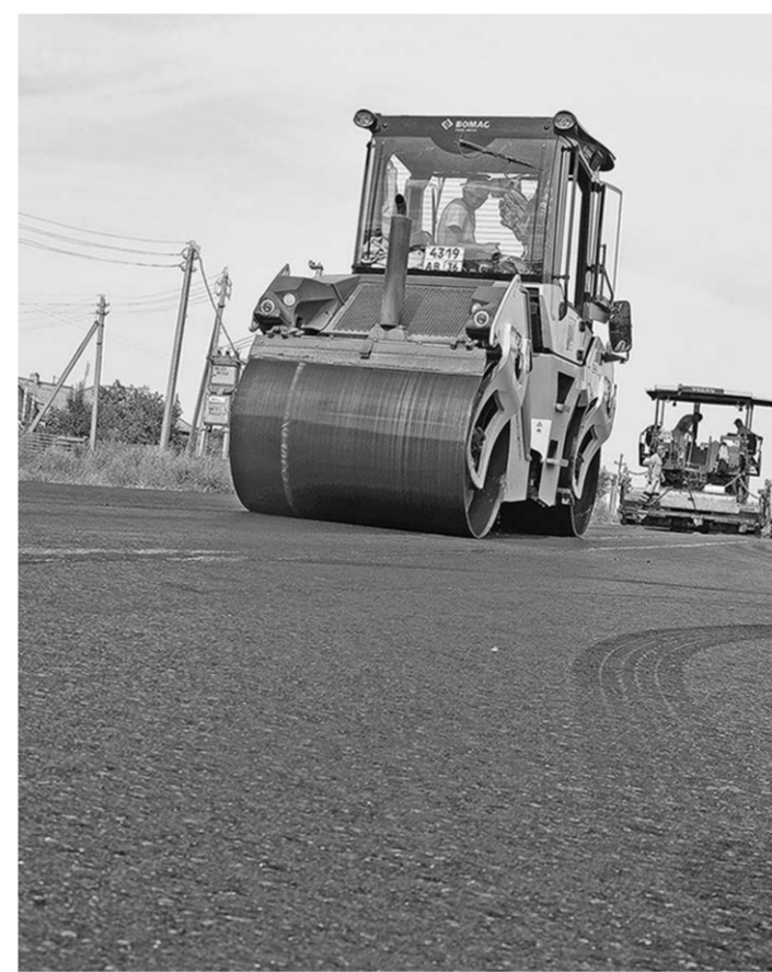
Успеть справиться с большими объёмами работ дорожным строителям помогает современная техника.