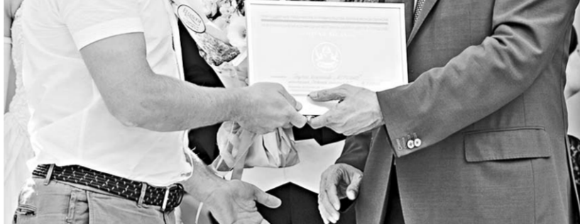
Награды победителям фестиваля вручил Александр Гусев.

Кроме конкурсной программы, в эти дни на разных площадках Воронежского центрального парка проходили лекции, мастер-классы и обучающие занятия по садово-парковому искусству от специалистов зелёной отрасли. Почётными гостями праздника,