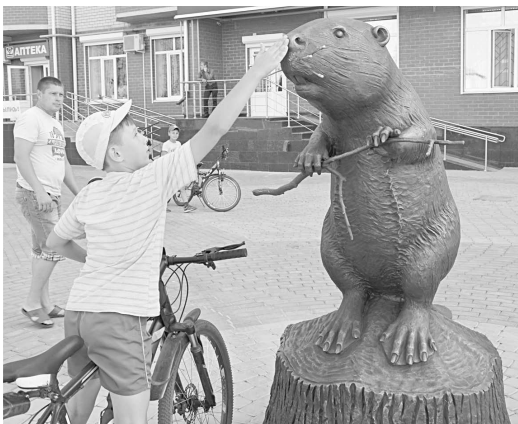
Симпатичный бронзовый бобр сразу же полюбился детворе.

«Сотрудниками филиалов уголовно-исполнительной инспекции совместно с представителями волонтерских объединений было организовано участие подучётных лиц