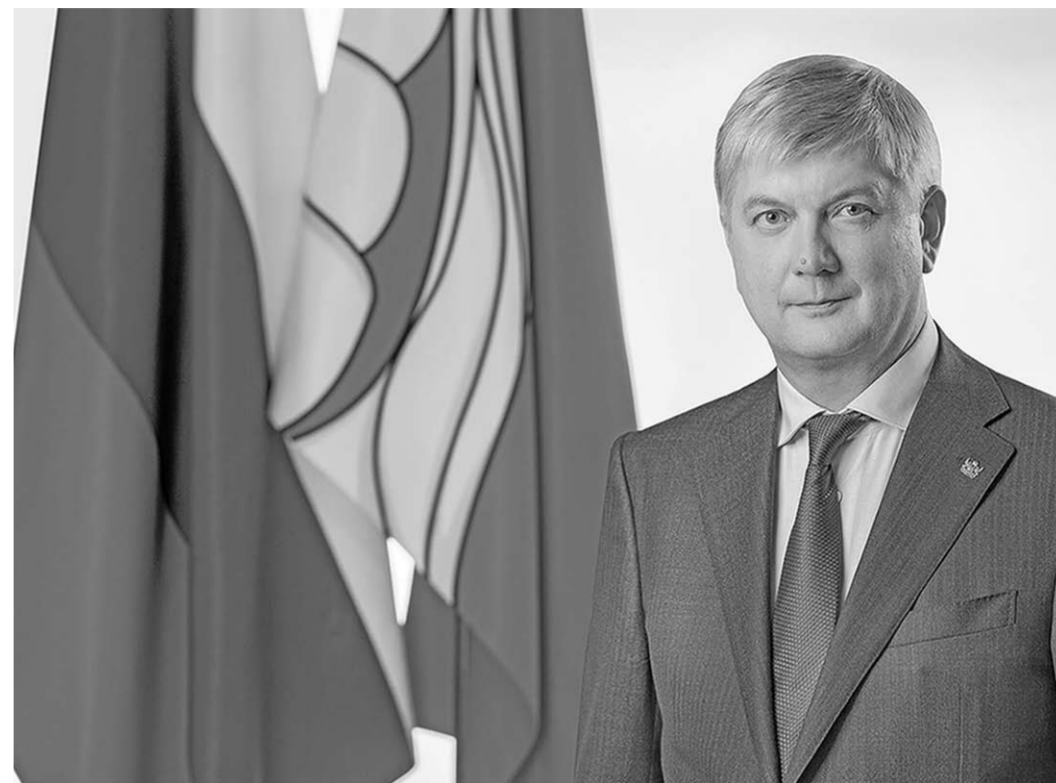
Особое внимание и одобрение со стороны предпринимателей привлек один из пунктов предвыборной Программы Александра Гусева: к 2023 году обеспечить рост количества предпринимателей до 40 субъектов в расчёте на тысячу населения.

Публикация оплачена из средств избирательного фонда кандидата на должность губернатора Воронежской области Гусева Александра Викторовича.