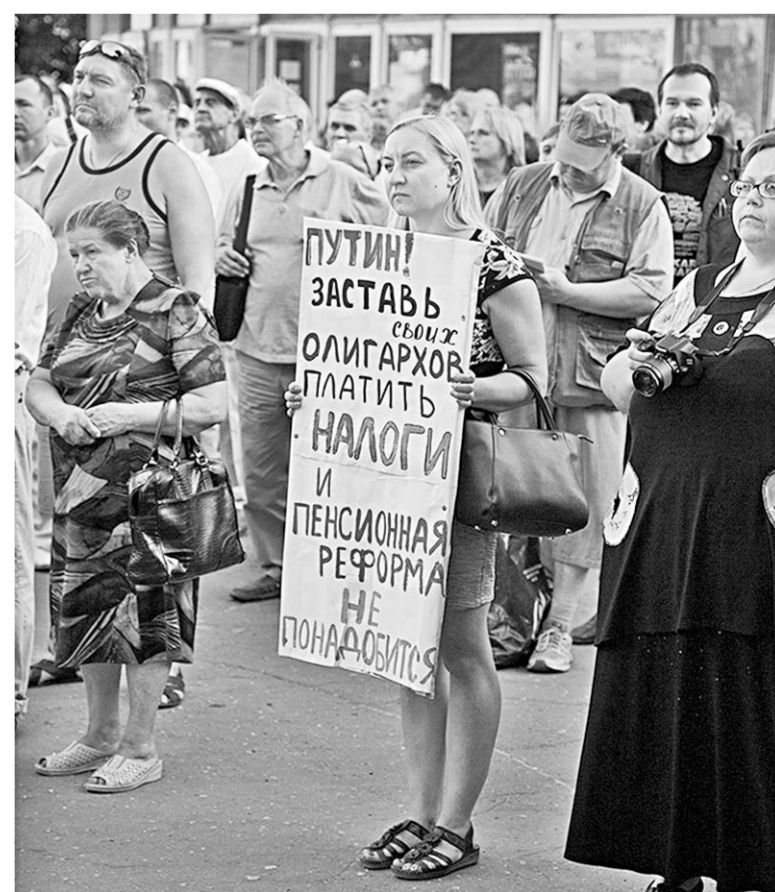
Содержание одного из плакатов митинга всё-таки говорит о том, что у воронежцев надежда на Президента жива.

В принятой резолюции заявлено о необходимости референдума по пенсионному вопросу, о недоверии не только либеральному правительству и депутатам фракции «Единая Россия», поддержавшим повышение пенсионного возраста, но и Президенту, в предвыборной программе которого ничего не говорилось по пенсионной реформе. Участники митинга заявили также о проведении 22 сентября ещё более массового митинга протеста в преддверии рассмотрения законопроекта о пенсионной реформе во втором чтении.