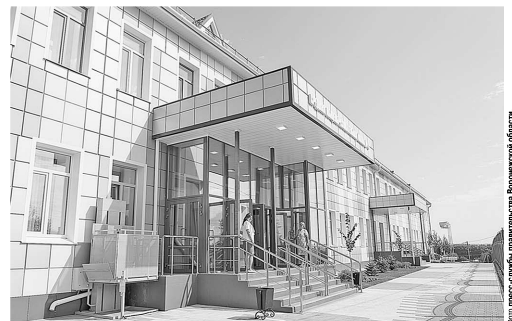
Александр Гусев: «Важно, чтобы эта школа являлась не только местом получения знаний, но и духовного воспитания».

Затем глава Воронежской области наградил лучших специалистов почётными грамотами, благодарностями, а также именными часами губернатора.