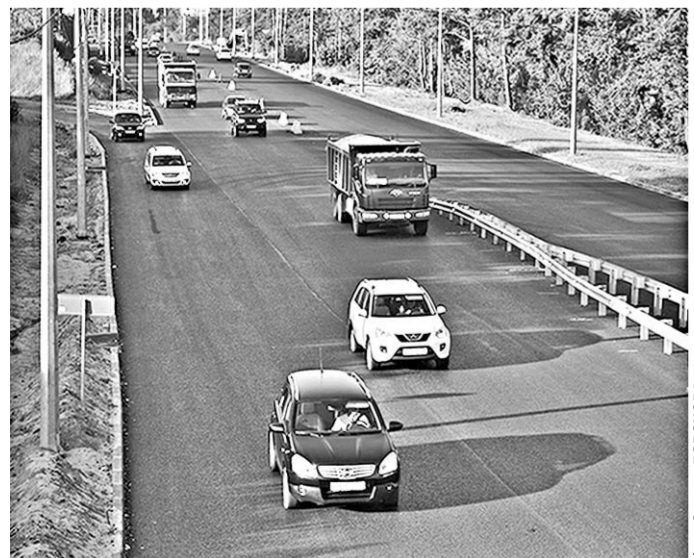
Автомобилисты надеются, что теперь развязку можно будет проехать без особых затруднений.

детей. Уже со второго класса гимназисты начнут изучать английский язык, а с пятого класса – немецкий язык. С первых дней учёбы ребята под руководством замечательных учителей пойдут по увлекательной дороге знаний, будут находить новых друзей, открывать неизведанный и волнующий огромный мир.