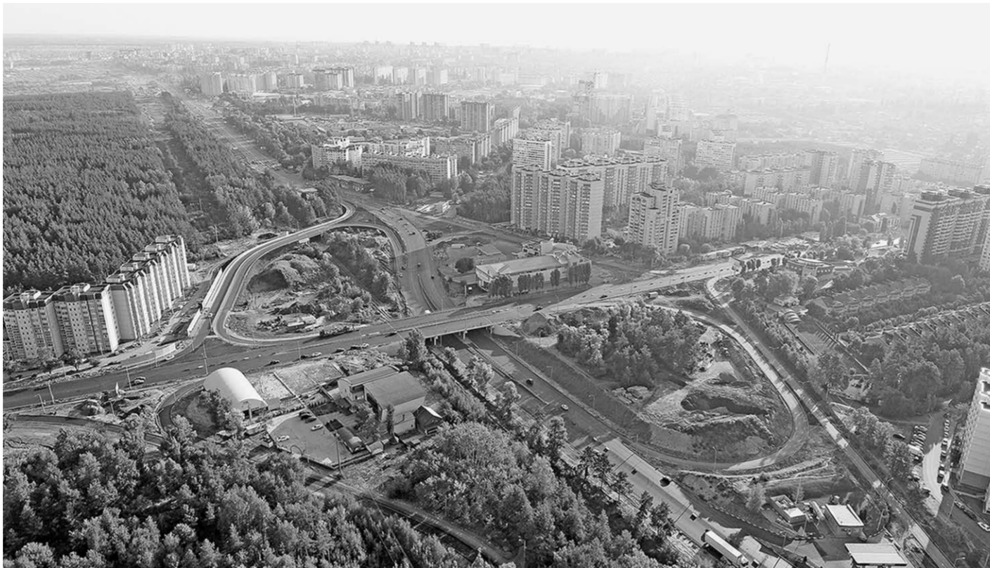
Воронеж, 1 сентября, раннее утро. Вот она, красавица-развязка, на пересечении улиц 9 Января – Антонова-Овсеенко – Героев Сибириков – с двумя путепроводами, одетая в брендовую строгую дорожную одежду, которую в скором времени украсит новая разметка. И эта красота подкрепляется на совесть выполненными дорожными работами.

В последнее время ситуация изменилась кардинально. Из федерального и регионального бюджетов стали выделяться немалые суммы на строительство, ремонт и содержание