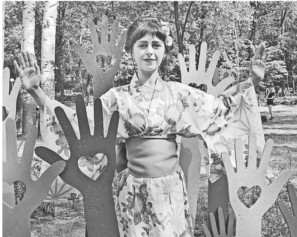
Год Японии в России и Год добровольца нашли отражение в композициях фестиваля.

В Воронежском центральном парке четыре дня радовал горожан и гостей столицы Черноземья международный фестиваль садов и цветов «Город-сад». Цель фестиваля, который уже в восьмой раз прошёл на воронежской земле, – демонстрация лучших достижений садово-паркового искусства и ландшафтного дизайна, повышение уровня экологической культуры.