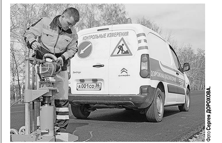
Качество работ находится под постоянным контролем.

Мы заинтересованы в том, чтобы скоординированно решать возникающие проблемы, поэтому мы и вступили в Союз дорожных организаций.