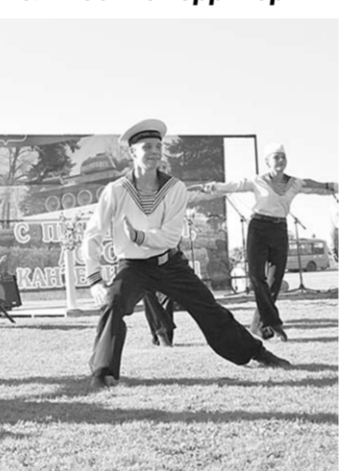
«Матросский танец» занял особое место в большой хореографической программе.

Степаний праздничного представления был насыщен яркими концертными номерами лучших творческих коллективов района. Вновь зрителей порадовали ансамбли «Бондаряночка», «Провинция», «Славяночка». Завершился концерт масштабным флешмобом детских хореографических коллективов.