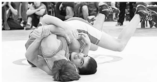
Воронежские атлеты успешно выступили на мемориале Алёхина.

В воронежском спорткомплексе «Звёздный» прошёл XXIV Всероссийский турнир по греко-римской борьбе, посвящённый памяти мастера спорта СССР, заслуженного тренера России Владимира Николаевича Алёхина (1940 – 1994).