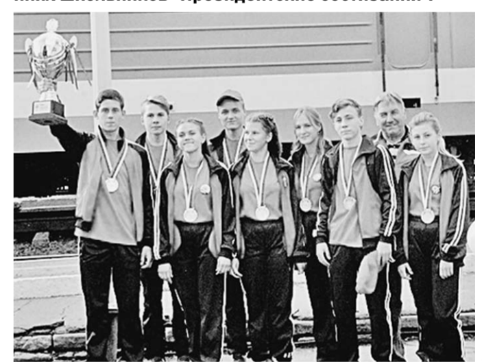
Спортсмены-победители из Краснянской средней школы.

Юные спортсмены из Новохопёрска завоевали «серебро» на XX Всероссийских спортивных соревнованиях школьников «Президентские состязания».