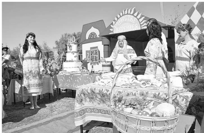
Порадовали своим гостеприимством сельские подворья.

С самого утра на ипподроме любителей конного спорта азартно следили за скачками. За приз, учрежденный в честь празднования юбилея района, состязались наездники из Россоши, Павловска, Богучарского и Кантемировского районов, а также Белгородской области.