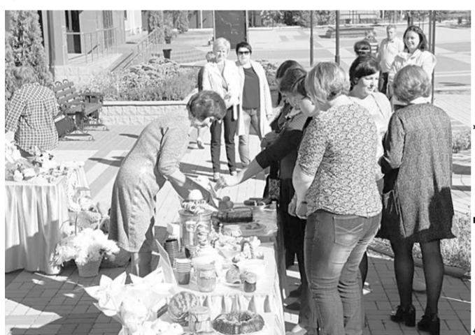
Кулинарные изыски были приготовлены по старинным рецептам.

Работники Подгоренской районной библиотеки недавно организовали для местных жителей своеобразное литературное кафе в рамках благотворительной акции «Белый цветок».