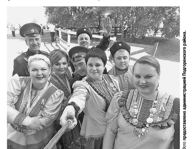
Вот она какая – «Забавы».

Подгоренский ансамбль казачьей песни «Забавы» стал лауреатом первой степени VIII Международного фестиваля «Казачья станица Москва».