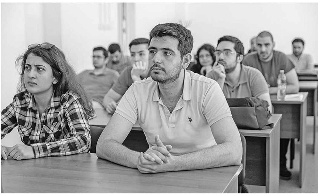
Турецкие студенты обучаются «атомному ремеслу» в Международном центре подготовки персонала.

«Росатома» и Всероссийским научно-исследовательским институтом по эксплуатации АЭС.