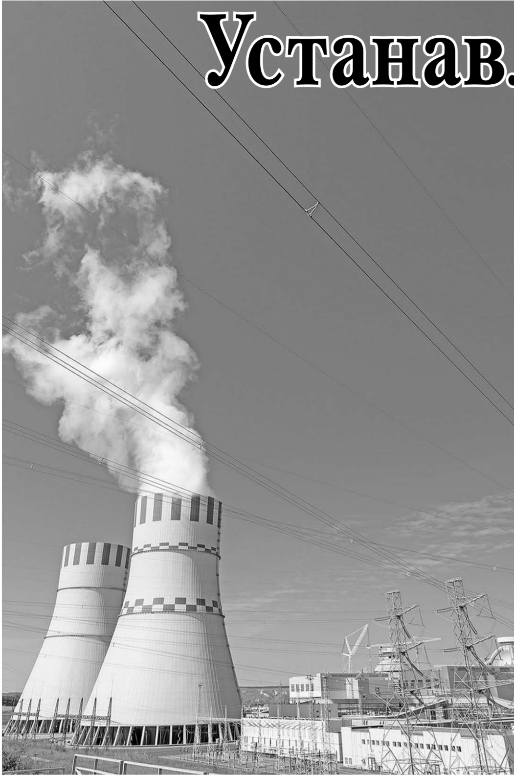
Энергоблок нового поколения.

электроэнергии: мы превысили отметку в 200 миллиардов киловатт-часов — выработано было 203, — сообщил глава «Росатома». — Советский рекорд — с учётом тогдашних Украины, Армении, Литвы — был 212. Мы будем к нему стремительно двигаться. Наработки в нашей энергетической повестке дня позволяют сохранять международное лидерство. Несмотря на жесточайшую конкуренцию, мы строим сегодня за рубежом больше блоков, чем все остальные страны, вместе взятые.