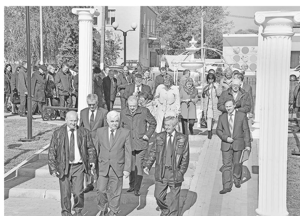
Участники выездного заседания в Воробьёвке с удовольствием приняли участие в открытии сквера Комсомольской славы.

В минувшую пятницу в центре Воробьёвки с утра играл духовой оркестр, а потом зазвучали комсомольские песни. Здесь проходило совместное выездное заседание областного организационного комитета по подготовке и проведению мероприятий, посвящённых 100-летию со дня создания комсомола, и областного Совета общественной организации «Воспитанники комсомола – моё Отечество».