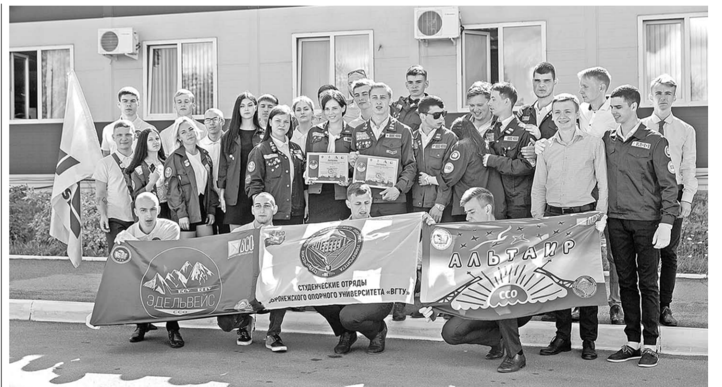
Участники Межрегиональной студенческой стройки «Мирный атом-2018» в Нововоронеже.

В задачи Проектного офиса входит: согласование учебного плана зарубежными специалистами с заказчиком, координация работы с Учебно-тренировочным пунктом НВ АЭС и другими подразделениями, на рабочих местах стажировать зарубежных гости. Обучение осуществляется совместно с Технической Академией