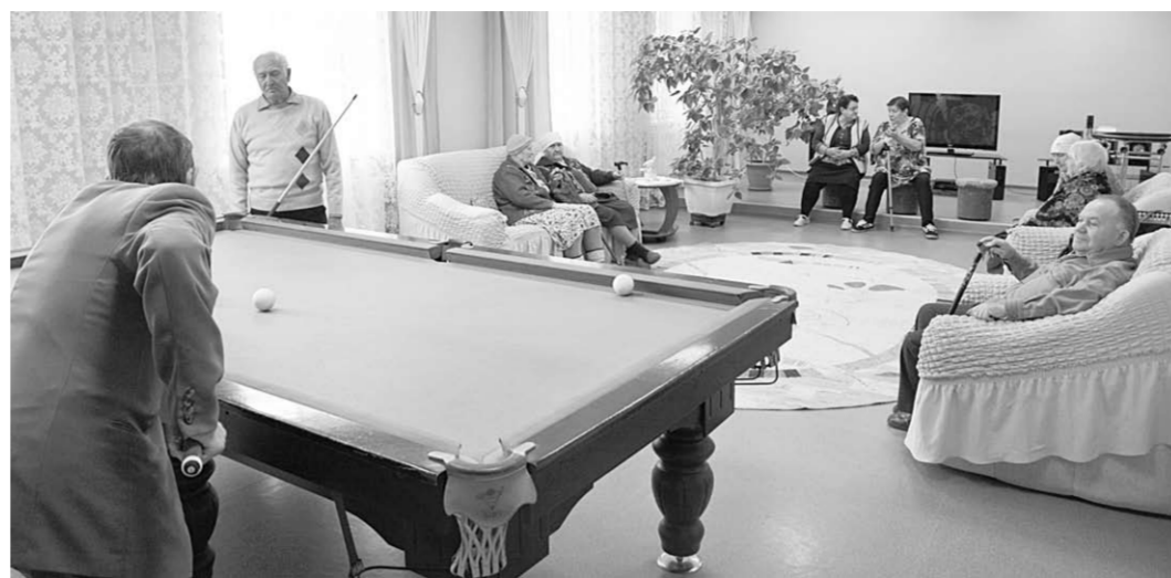
Комната отдыха в Липовском доме-интернате.

– На территории Воронежской области реализуется проект «Единой России» «Старшее поколение», который ориентирован на строительство домов-интернатов нового типа для одиноких пожилых людей или тех, кто оказался в трудной жизненной ситуации. Шесть таких современных комплексов уже успешно работают, – рассказывает Владимир Нетёсов. – Для комфортного проживания людей старшего поколения там созданы все условия, к тому же и в круглосуточном режиме оказывается многопрофильная медицинская помощь. В каждом