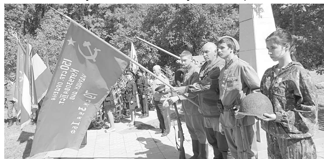
Минутой молчания почтили поисковики память защитников Сторожевского плацдарма.

– Двадцати двух воинских захоронениях Острогожского района нашли свои последний приют свыше пяти тысяч защитников и освободителей нашей земли. И каждая новая Вахта памяти множит эту