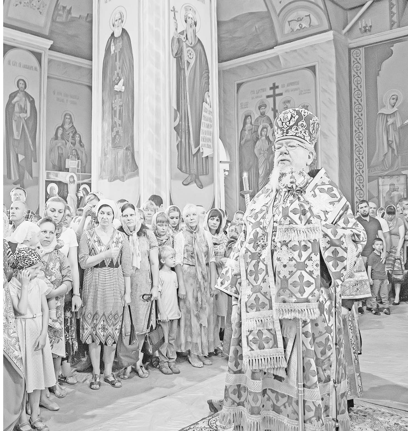
Митрополит Воронежский и Лискинский Сергей.

для нас «стройки века», электростанции, заводы. Всё это воспринималось как должное, пока не началась перестройка, конца 1980-х. Слава Богу, это политическое перерождение страны прошло бескровно. Тогда тесные контакты с США привели к экономическому контролю производства и банковской системы нашей страны Америкой и Западной Европой. Нависла реальная угроза раздробления России на составные части. К счастью, вскоре пришло время пересмотра политического курса. Главное – что среди всех нападков и испытаний того времени сохранилась целост-