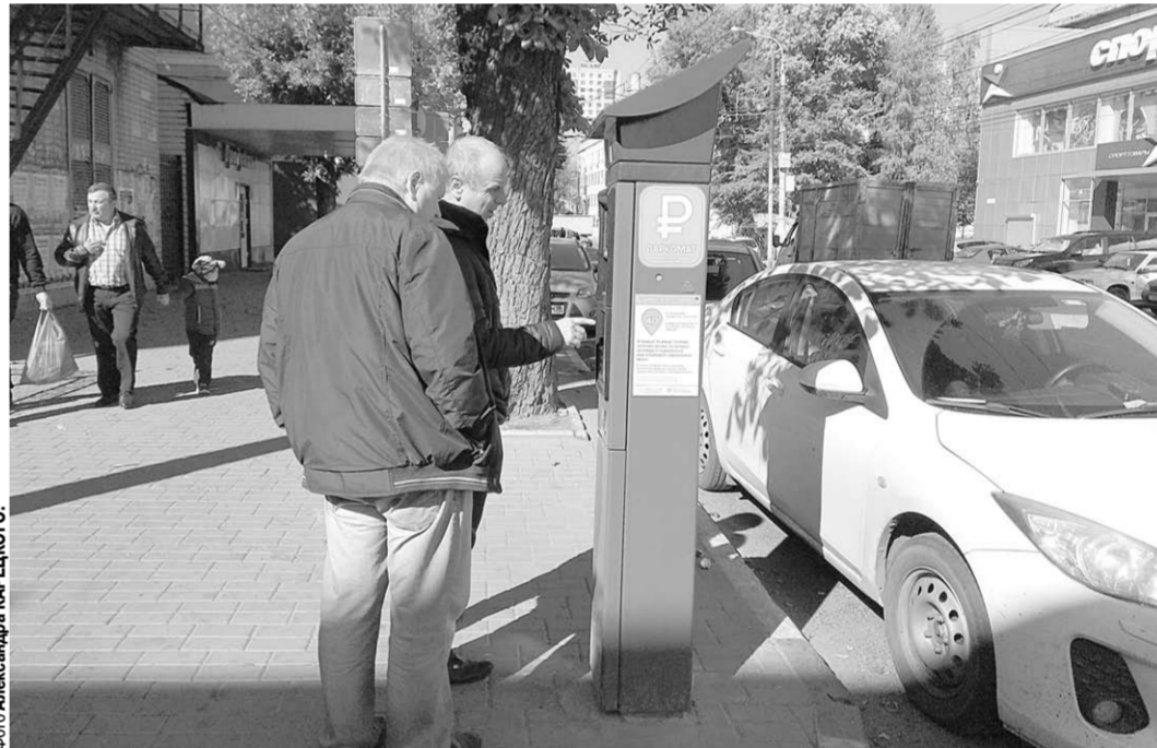
Водители у паркомата: «И куда здесь нажимать?».