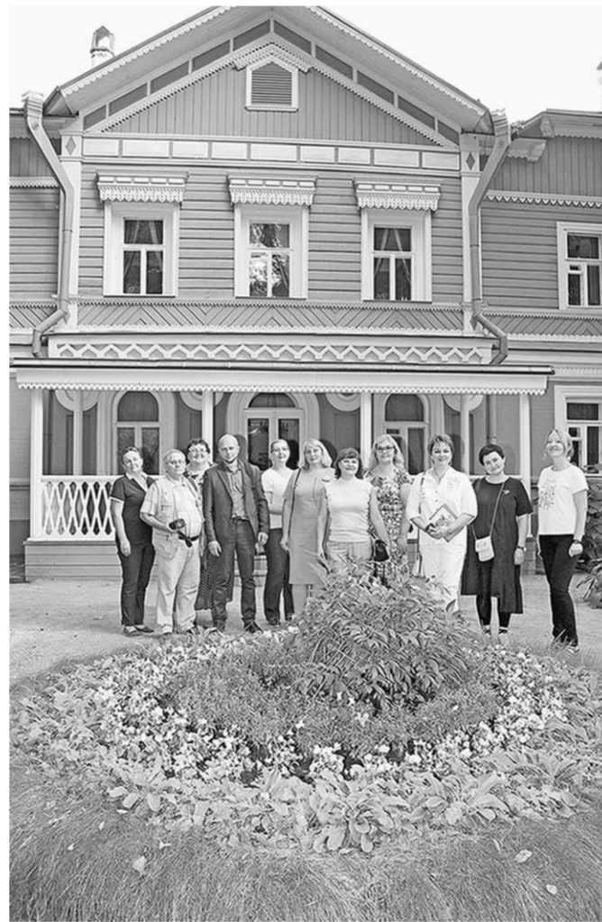
Дом в Клину, где прожил последние годы П.И. Чайковский.