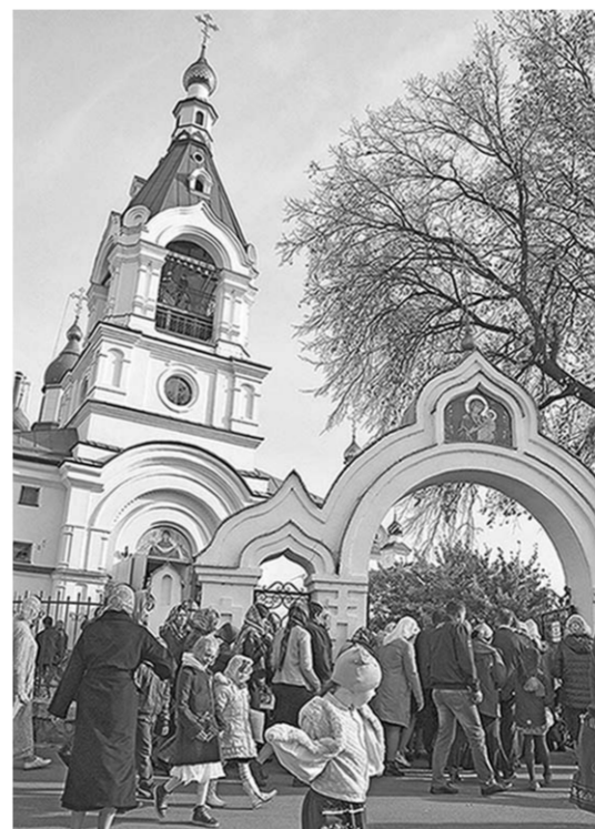
У храма Покрова Пресвятой Богородицы.

Сотни нарядных людей не спеша двигались в обоих направлениях. Здесь состоялся большой праздник – фестиваль «Отрадные вечера под Покровом Пресвятой Богородицы».