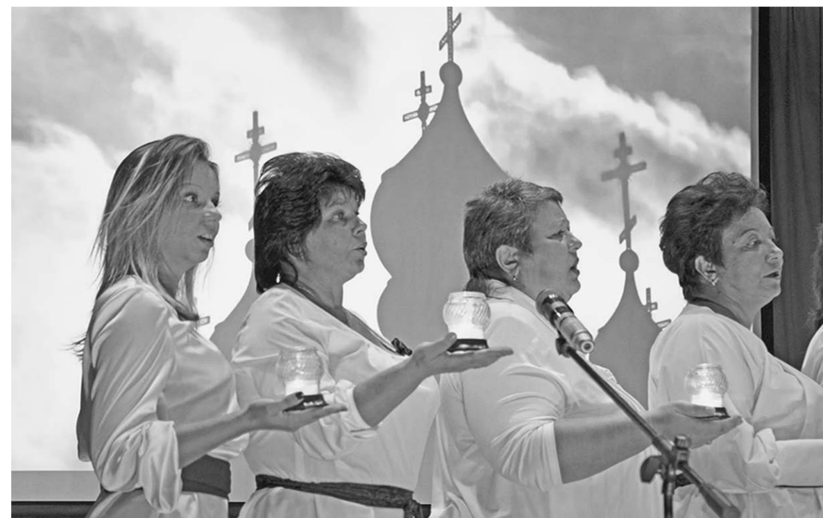
Звучат духовные песнопения.

Православие | К храму и Дому культуры посёлка Отрадное в прошедшие выходные шёл и шёл народ