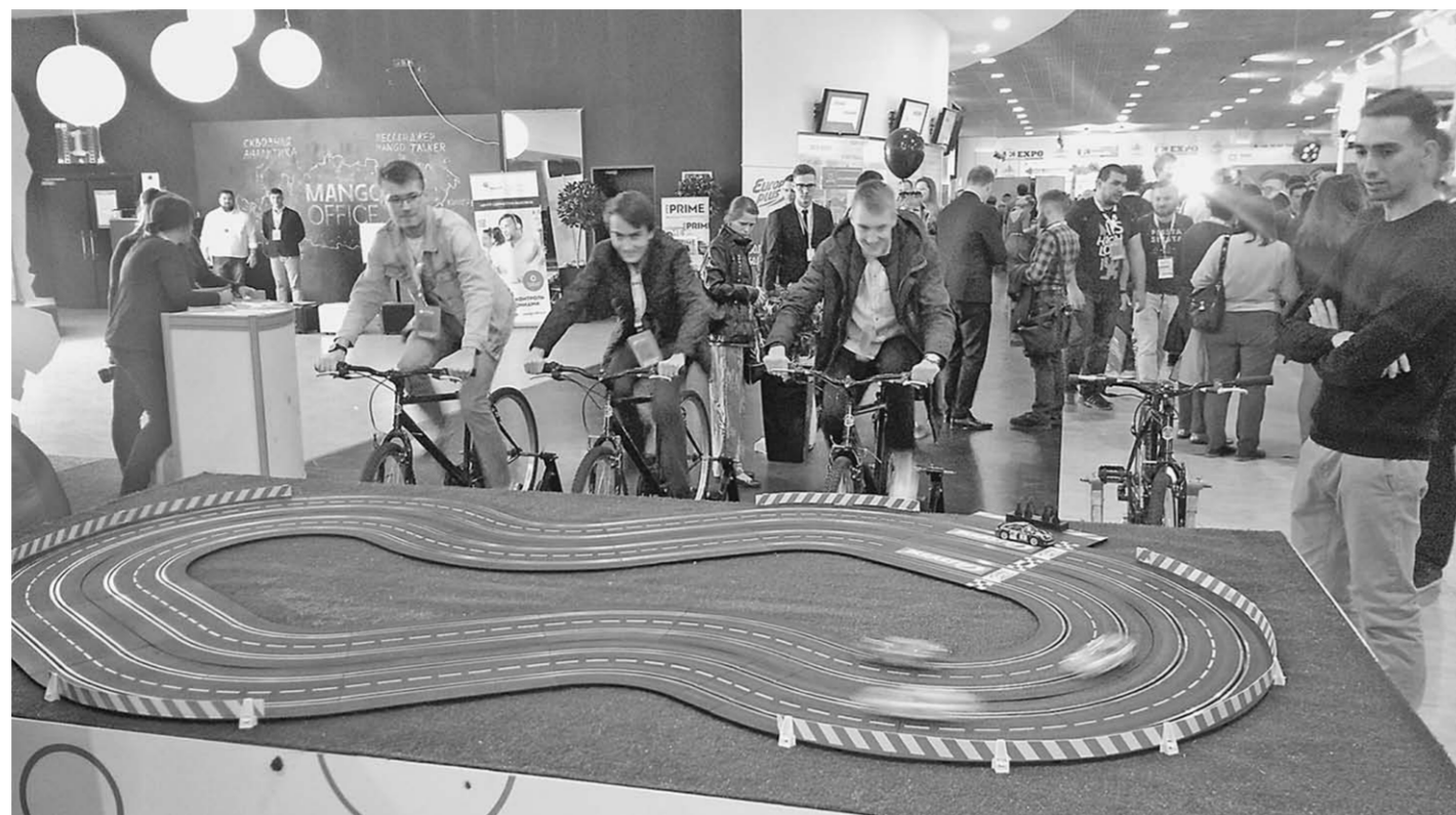
Участники выставки РИФ-2018 представили различные интерактивные площадки. Например, игровые автомобили гоняли по «трассе», а для их привода использовали велосипеды.

Российские правозащитники свободы слова в виртуальном пространстве убеждены в недопустимости блокировки сайтов без судебного решения (такую возможность сегодня предусматривает действующее законодательство). По их мнению, требования к операторам собирать и хранить контент пользователей также противоречат Конституции. В частности, по мнению руководителя