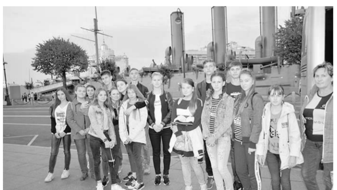
Команда юных экологов в Санкт-Петербурге.

Из своей поездки на Международный и межрегиональный молодежный БИОС-форум и БИОС-олимпиаду воспитанники Новохоперской станции юннатов привезли шестнадцать дипломов.