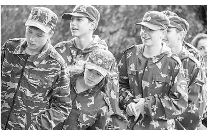
Участников «Зарницы» не было хмурых лиц.

На территории борисоглебской школы №3 прошла окружная военно-спортивная игра «Зарница» для членов детских общественных организаций.