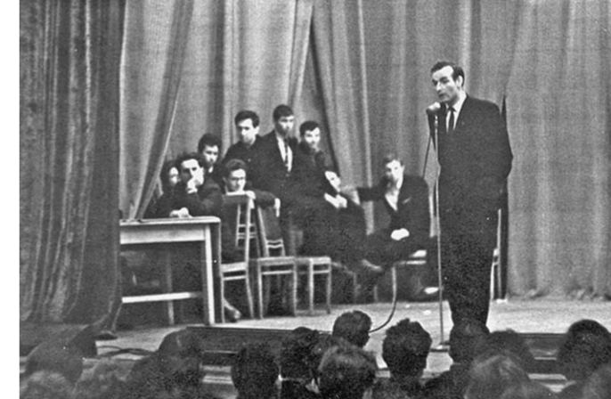
Один из первых Дней поэзии ВГУ. 1959 год