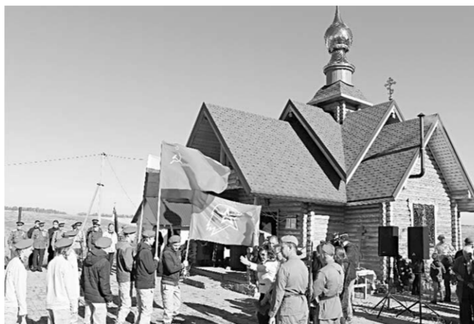
В церемонии перезахоронения активное участие приняла молодёжь.

— Очень важно, что место перезахоронения стало более доступным для населения и сюда может прийти каждый,