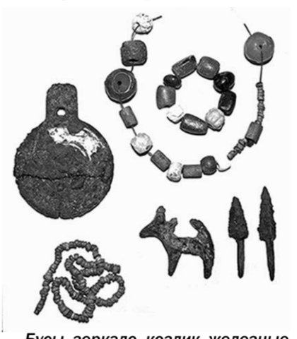
Бусы, зеркало, козлик, железные наконечники стрел из Березовки.

вращение к истокам» продолжила исследование курганов у села Березовка Воробьевского района. Среди исследованных курганов особо поразили студентов гуманитарного факультета ВГПУ, проводивших раскопки, один из небольших курганов. В нем они обнаружили погребение женщины сарматского времени II века н.э. Немалых усилий потребовалось для того,