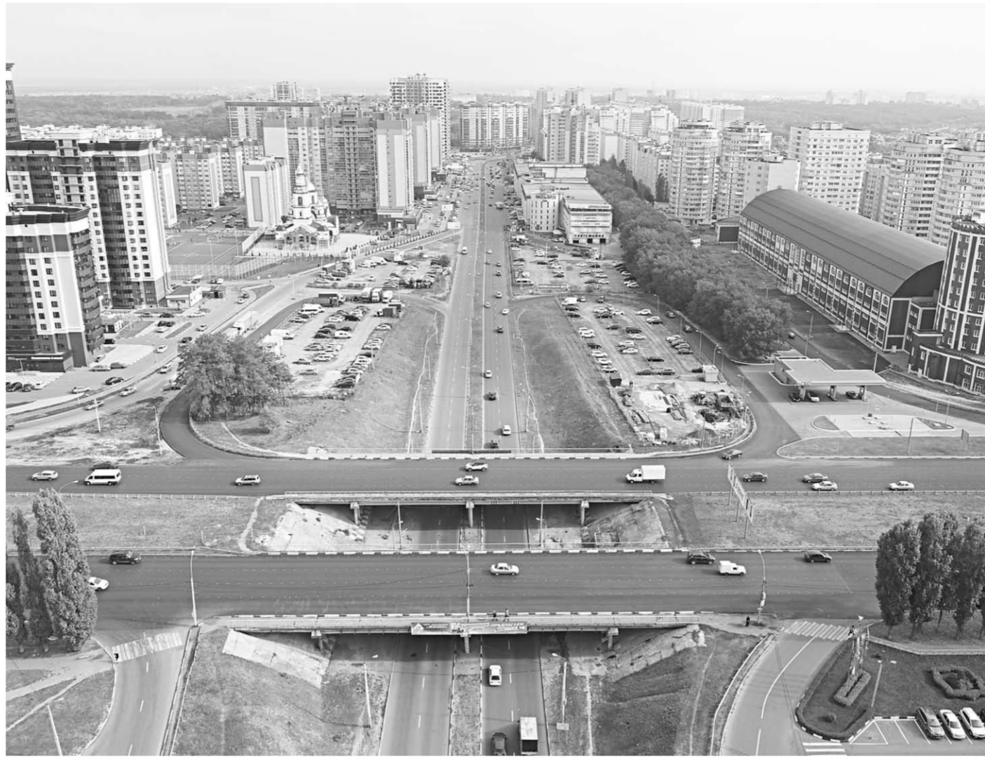
Глядя на эту фотографию, невольно приходит на память стихотворная строка: «Дорога – это жизнь, призвание, судьба».

сохранить стабильное финансовое этого направления. В текущем году бюджет дорожного фонда Воронежской области составил почти 11,5 миллиарда рублей.