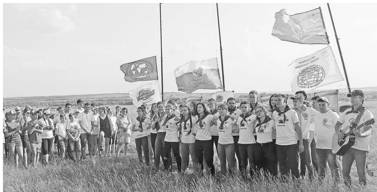
Ребята из «Возвращения к истокам» исполняют гимн своего историко-археологического движения.

«За научные кадры». 24 февраля, 1959 год.