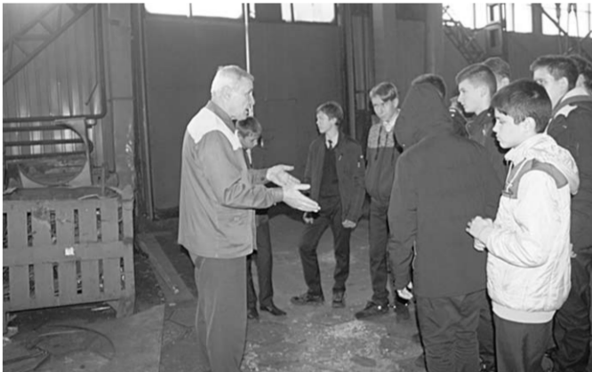
Восьмиклассники в цехе завода «Патрон».

Специалисты борисоглебского Центра «Социальной адаптации молодёжи» ведут целенаправленную профориентационную деятельность.