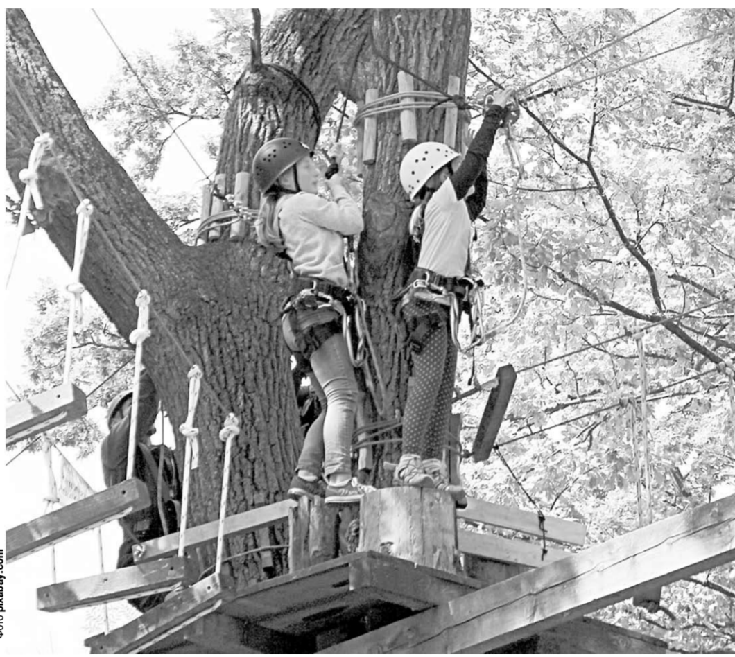
Обеспечить детям безопасный отдых – прямая обязанность взрослых.