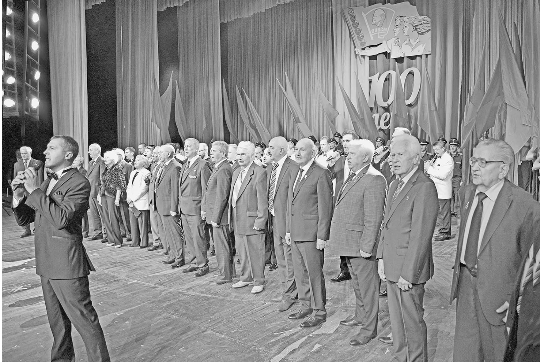
Заключительным аккордом праздника стало приглашение на сцену лидеров воронежского комсомола разных лет.

Каждая страница его истории наполнена трудовыми и воинскими подвигами комсомольцев. Воронежская областная комсомольская организация была одной из самых массовых и активных. Наши