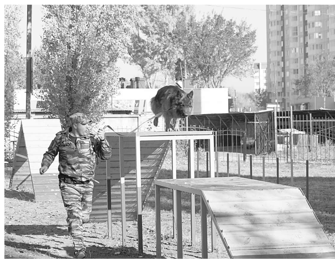
Служебная собака покоряет снаряд «окоп».