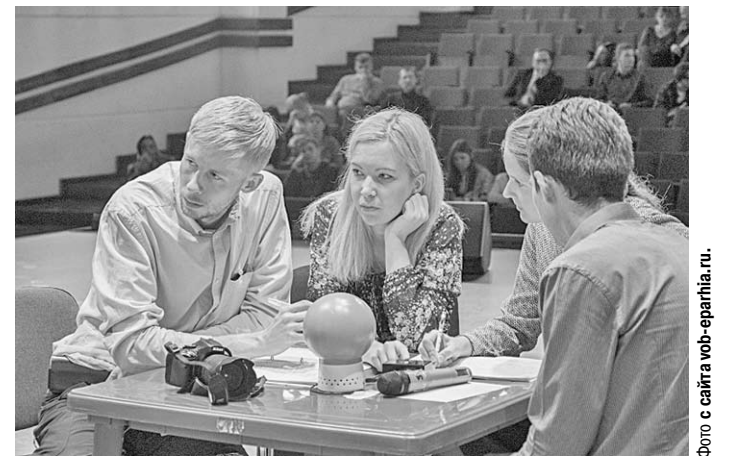
Интеллектуальная игра потребовала концентрации внимания у всех её участников.

Во Дворце творчества детей и молодёжи в Воронеже прошла интеллектуальная игра на тему «Николай II и его время».