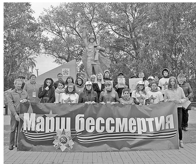
Участники экскурсии у мемориала в селе Стадница.

Профессиональные активисты Воронежской области совершили автобусную поездку по маршруту «Марш бессмертия». Она включала экскурсию по десяти воинским памятникам и мемориалам Семилукского района: в посёлке Новый, сёлах Девица, Нижняя Ведуга, Стадница, Землянка, Перлётка, Губарево, Семилуки и городе Семилуки и проходила в рамках проекта «Наш общий дом – Россия», при реализации которого используются средства Президентского гранта.