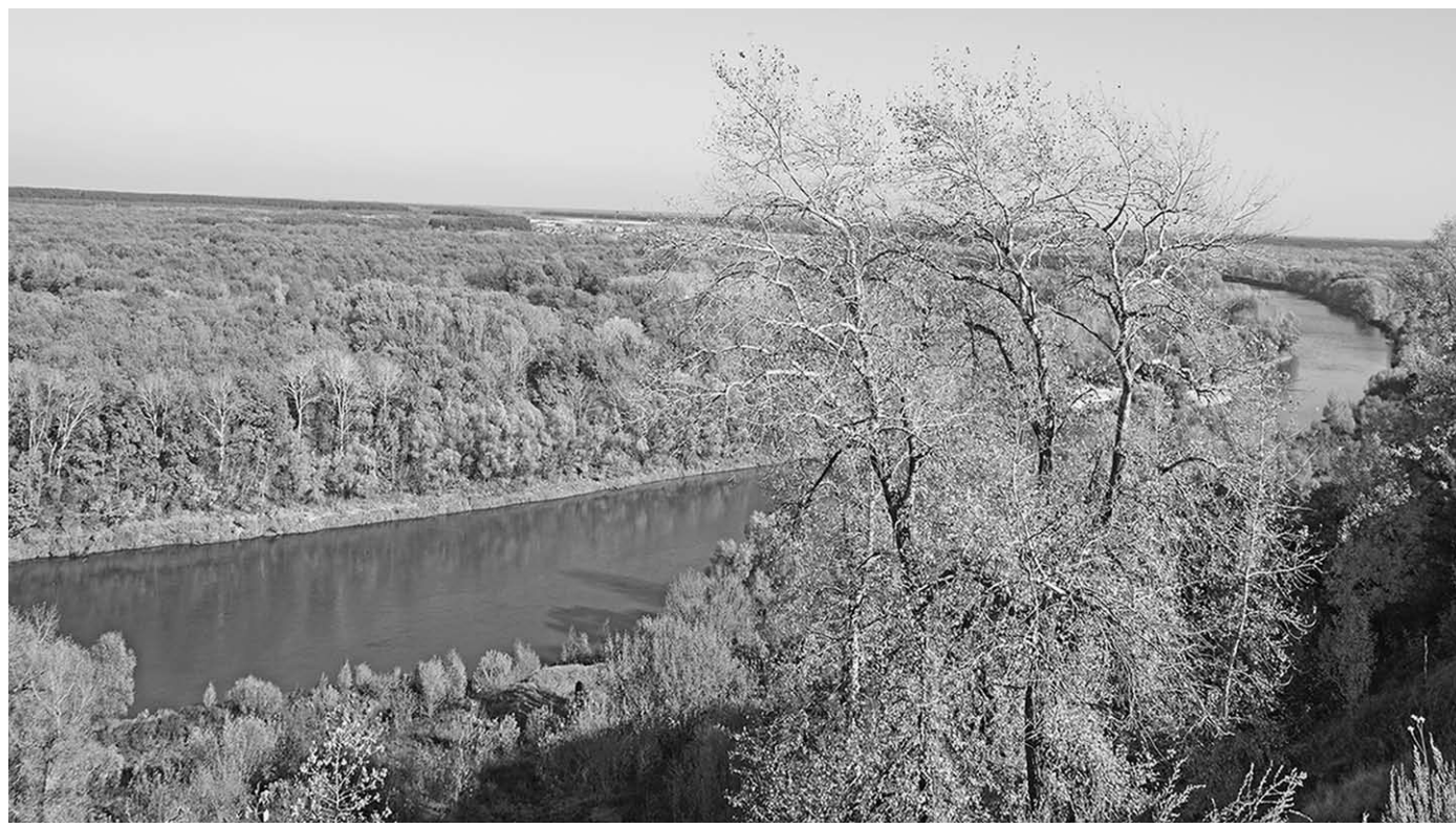
Такими со смотровой площадки предстают Новохопёрский заповедник и река Хопёр.

установить фонтан, организовать прокат велосипедов, создать детский развлекательный центр. Идей много!