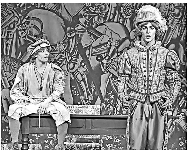
Сцена из спектакля «Принц и нищий».