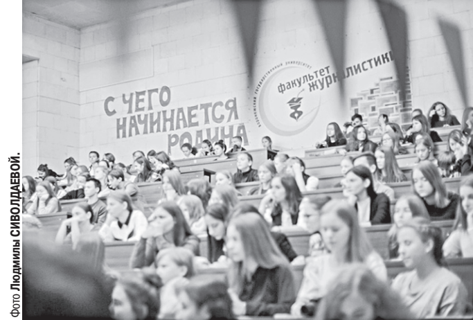
Юные журналисты обсуждают тему фестиваля.

Первый этап областного фестиваля школьных и студенческих СМИ «Репортёр-2019» состоялся на факультете журналистики ВГУ.