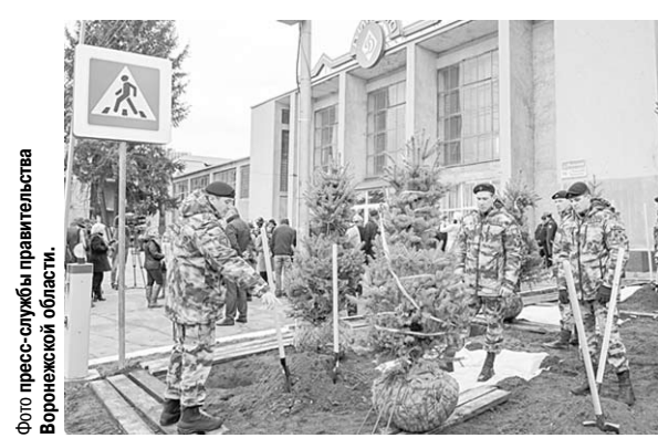
Аллею Славы Воронежского отделения общества «Динамо» украсили именные ели.