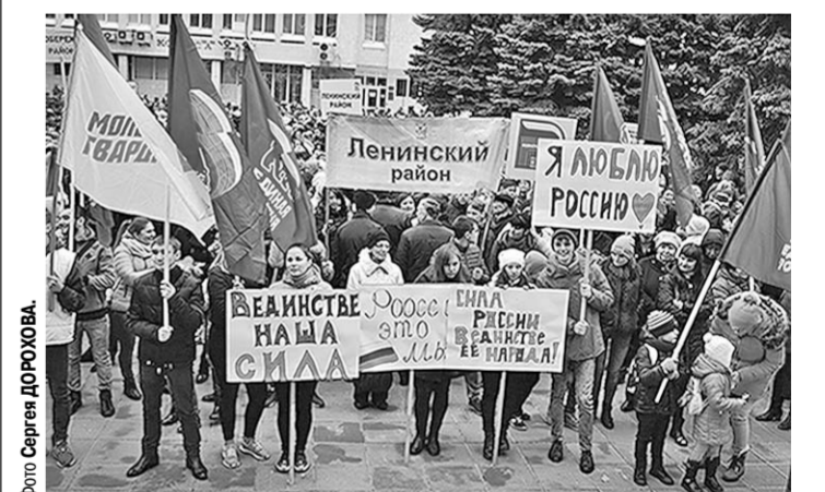
На митинге ощущалась атмосфера праздника.

День народного единства воронежцы отметили митингом. Он прошёл четвёртого ноября на площади у здания Воронежской областной Думы и собрал сотни горожан.