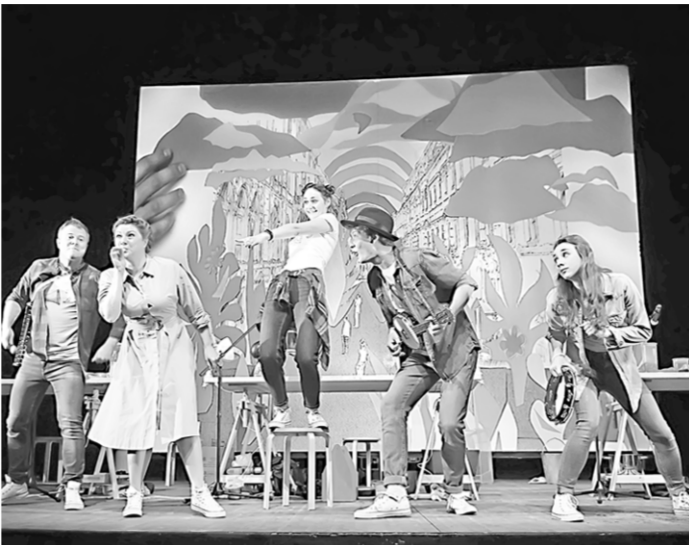
В спектакле звучат и вполне привычные музыкальные инструменты.

ролд Санкт-Петербурга. Главное в спектакле – звуковая ткань, которую артисты Театра на Литейном создают совместно с публикой.