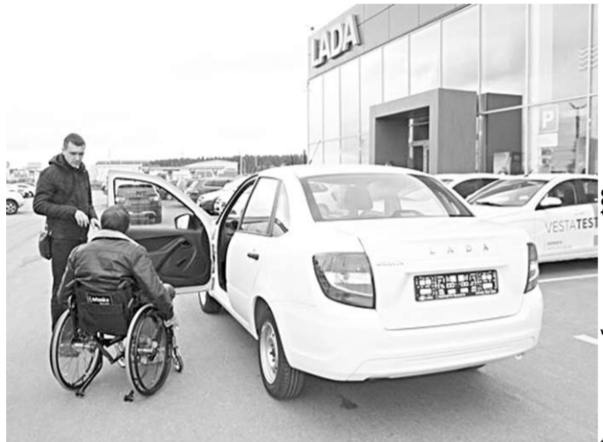
Одна из машин, адаптированных под физические возможности инвалидов-колясочника.

Новые автомобили, оснащённые ручным управлением и индивидуальными адаптивными, получили восемь жителей Аннинского, Каширского, Лискинского, Семилукского, Петропавловского, Ольховатского и Бобровского районов.