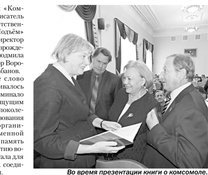
Во время презентации книги о комсомоле.

В той или иной мере слово выступающих не ограничивалось рамками темы и более широко дискуссии по животрепещущим вопросам подрастающего поколения, практического использования опыта комсомольских организаций в работе с современной молодёжью. Книга «Это память моя, это вера моя. К 100-летию воронежского комсомола» стала для многих той живой нитью, соединившей разные поколения.