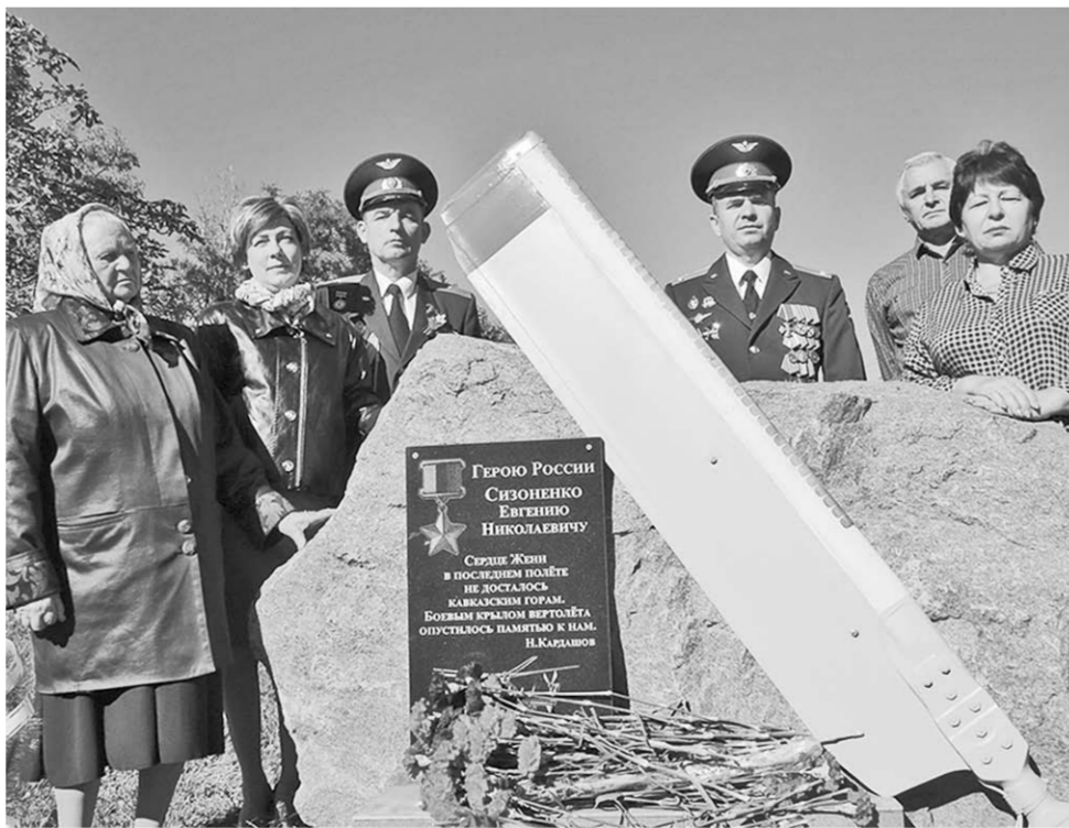
Мама и вдова Героя России вместе с однополчанами у памятника Евгению Сизоненко.

Никто не забыт, ничто не забыто | Герою России Евгению Сизоненко в его родной школе в Лисках открыли памятник