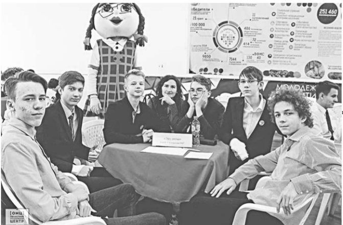
Команда «Эрудиты» гимназии №2 Воронежа заняла второе место в областном чемпионате «Что? Где? Когда?».

Шестнадцать команд школьных эрудитов сразились в финале областного чемпионата по интеллектуальной игре «Что? Где? Когда?».