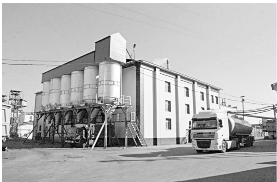
Обновлённое здание завода растительных масел.

– Прессы из Германии ставились повсеместно, – уточнил наш собеседник. – Надёжность