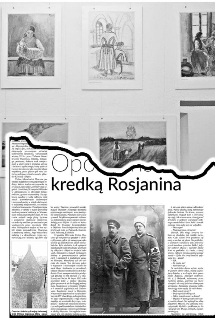
Справа: страницы польского еженедельника с публикацией о Тихоне Ткачёве.