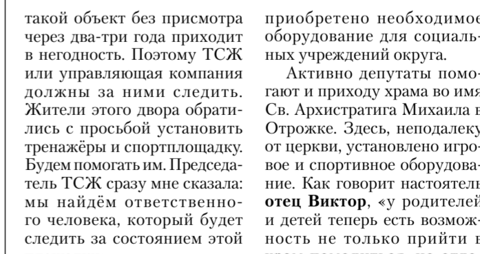
Вот так выглядит результат совместных забот жителей и депутатов гордумы.

такой объект без присмотра через два-три года приходит в негодность. Поэтому ТСЖ или управляющая компания должны за ними следить. Жители этого двора обратились с просьбой установить тренажеры и спортивную площадку. Будем помогать им. Председатель ТСЖ сразу мне сказал: мы найдём ответственного человека, который будет следить за состоянием этой площадки».