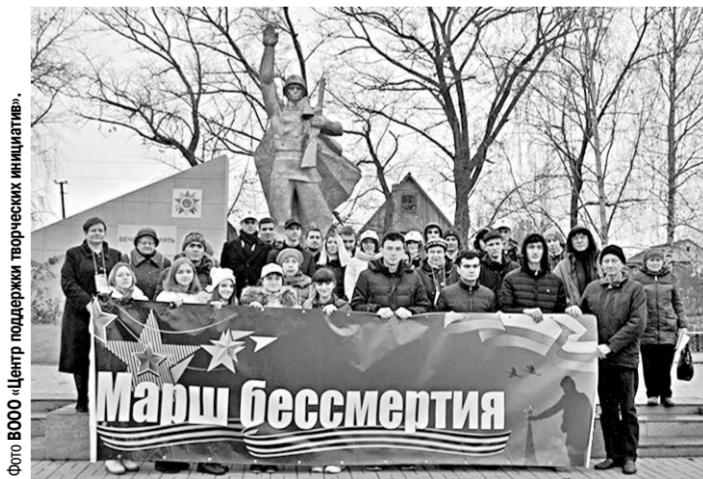
Участники «Марша бессмертия» сфотографировались у мемориала на память.

Студенты Культурно-досугового центра института международного образования ВГУ из Туркменистана, Китая, Узбекистана, Арганистана проехали по маршруту «Марш бессмертия».