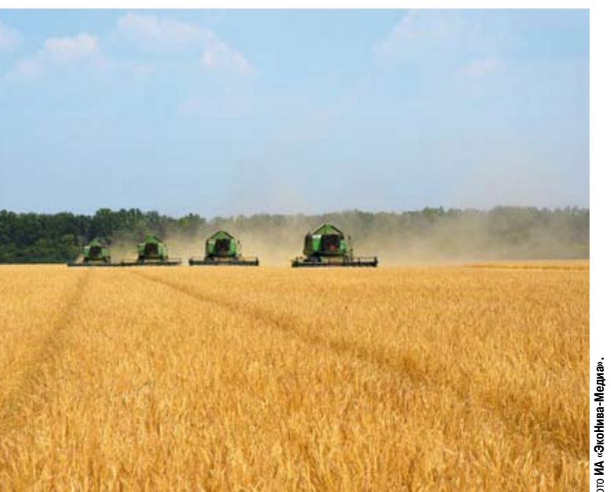
«ЭкоНиваАгро» успешно занимается производством зерновых, зернобобовых, кормовых культур, высококормительных технических культур и семеноводством.