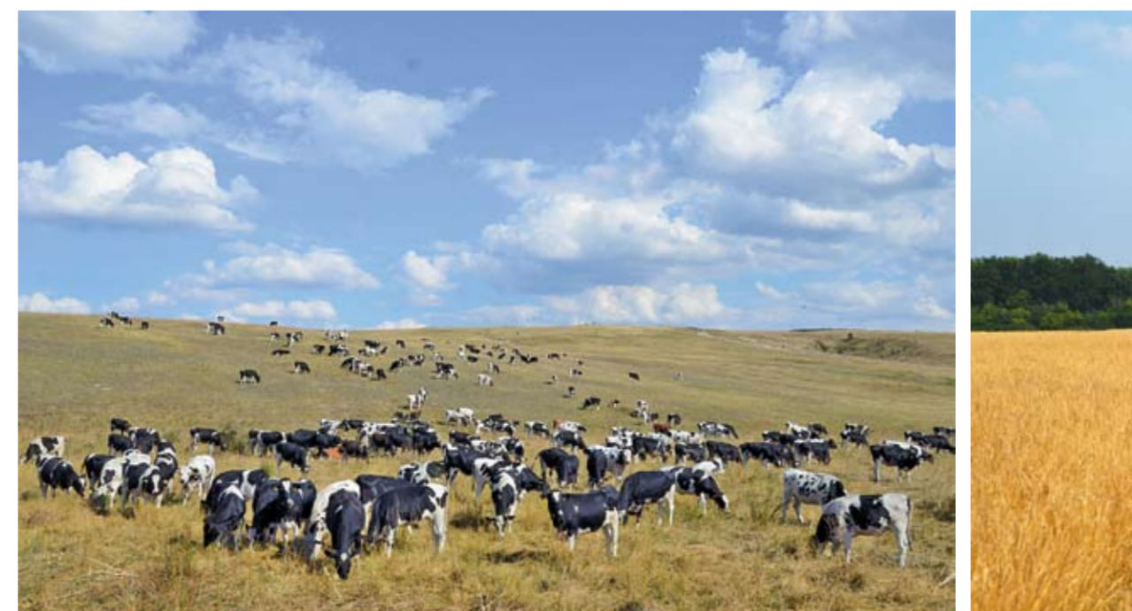
Предприятие является племязаводом по разведению скота голштинской и симментальской пород.

ООО «ЭкоНиваАгро» – самое крупное сельхозпредприятие ГК «ЭкоНива». Объединяет 28 хозяйств на территории Лискинского, Каменского, Бобровского, Аннинского и Каширского районов Воронежской области.