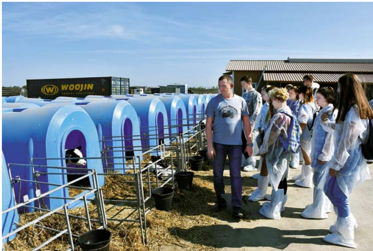
«ЭкоНиваАгро» использует уникальные современные технологии, интерес к которым есть и у аграриев, и у жителей и гостей Воронежской области.