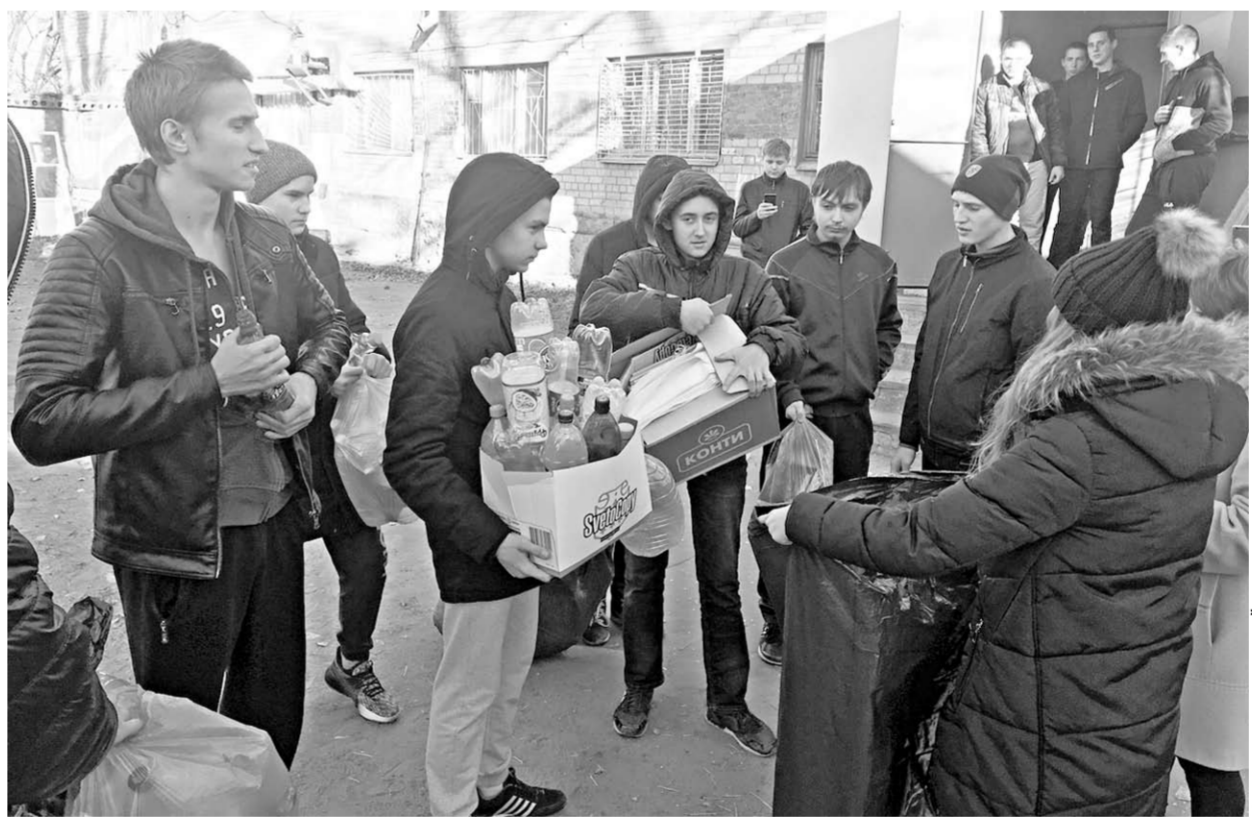
Участники акции по сбору вторичных отходов.

С учащимися проводились беседы, на которых рассматривались вопросы сроков разложения разных видов отходов в природе, разбирались существующие способы обращения с отходами. Эксперты подчеркивали, что раздельный сбор является самым грамотным и экологичным способом утилизации мусора. Особое внимание уделялось опасным отходам, таким как батарейки и отработанные ртутные лампы. Ведь они несут колоссальный вред окружающей среде, если их выбрасывать в общий мусор. В одной батарейке содержится множество опасных металлов. Например, свинец, который со временем накапливается в костях, приводит к их неизбежному разрушению. Ртуть – опасный и токсичный металл, который имеет свойство накапливаться