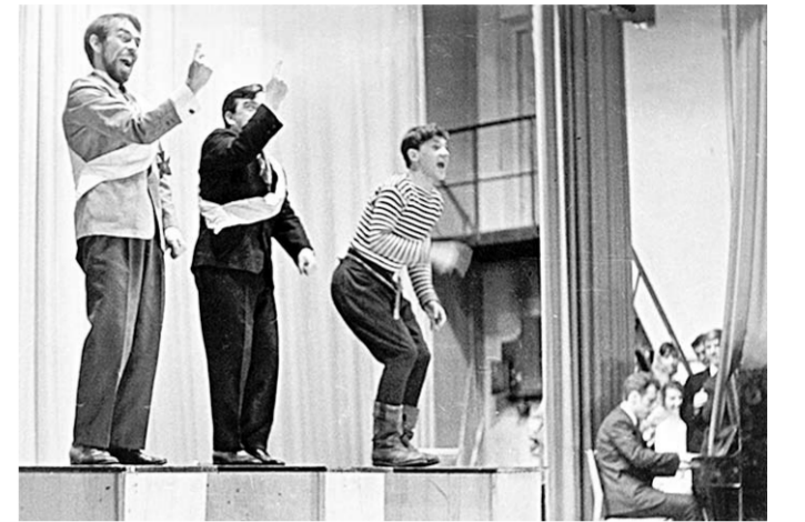
На сцене – Театр миниатюр ВГУ.

Учли причины провального выступления в Москве – решили принципиально обновить репертуар – обратиться к классическим текстам. Для начала выбрали «Записные книжки» Ильи Ильфа.