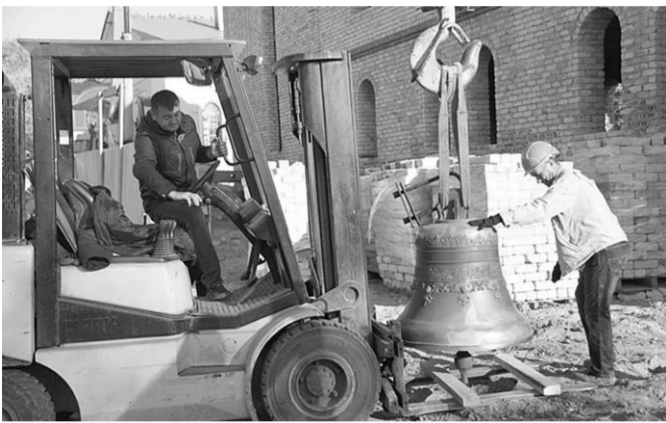
Идёт подготовка к установке колоколов.

На колокольне строящегося Духовно-просветительского центра установили шесть колоколов разного размера: самые большие весом в 500 и 100 килограммов, самый маленький – 10 килограммов.