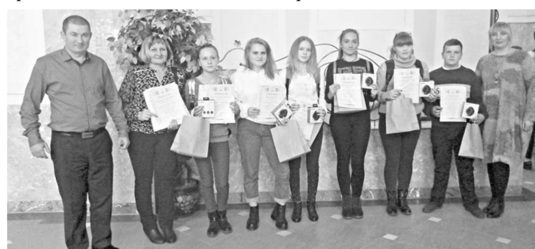
Участники творческого конкурса «Природные территории – для будущих поколений» МКОУ «Поддубенская ООШ».

Также были рассмотрены вопросы о возможности поиска перспективных ООПТ. Школьники под руководством преподавателей проявили ак-