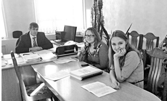
Участники Дня дублёра.

В администрации Богучарского района прошёл День дублёра.