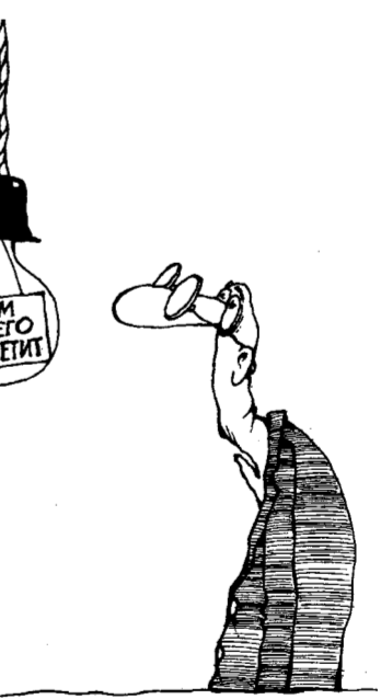
Рис. Михаил ПАРНИЧЕВ

Этот же сайт информирует: средняя пенсия по России составляет 14 тысяч рублей. Средний же размер назначенных в Воронежской области месячных пенсий на 1 октября 2018 года, по данным Отделения Пенсионного фонда РФ