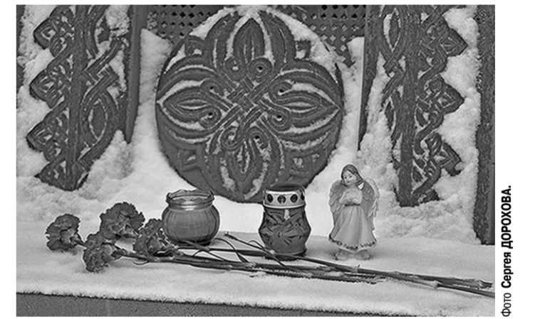
Цветы и свечи стали главными символами поминовения.

Воронежцы почтили память погибших при землетрясении в Армении, которое произошло 7 декабря 1988 года.