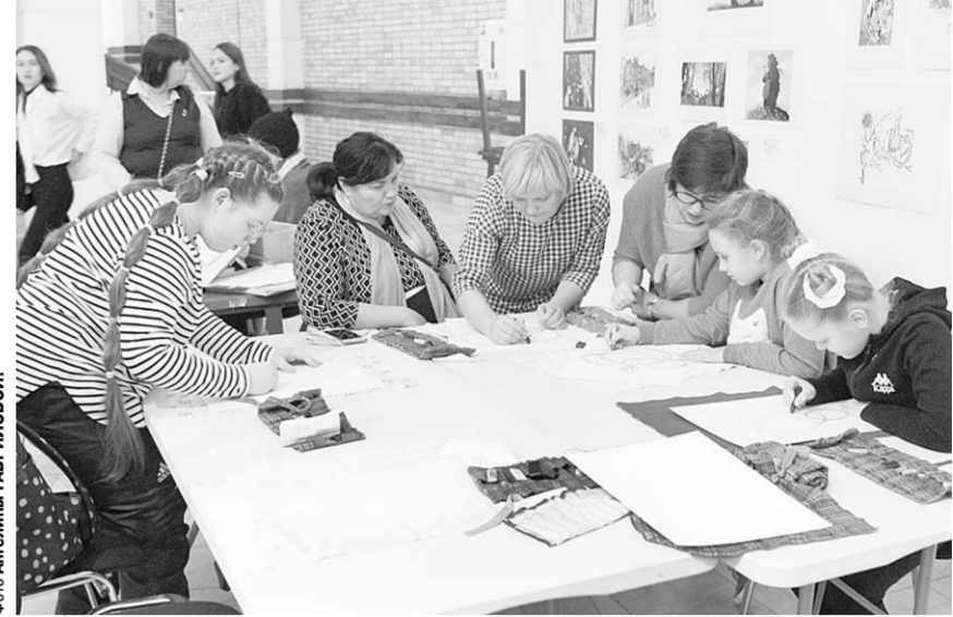
На фестивале работали творческие площадки.

открытки, классная серия книг про искусство, цикл «Белль и Бу»... Ещё появилась серия по истории городов. Вышли книги про Санкт-Петербург и Новгород. Будет ли про Воронеж? Пока нет. Всё-таки издательство питерское. Но, думаю, когда ваш фестиваль по-настоящему выстрелит, возможно, сделаем и книгу про Воронеж!