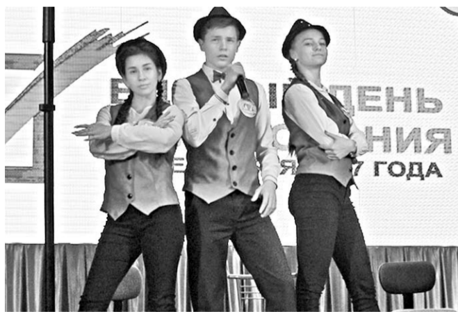
На сцене – «Поколение «NEXT».

С наградой вернулась из Воробьевки команда второй городской школы Богучара «Поколение «NEXT». Она представляла Богучарский район на зональном туре областного конкурса агитбригад по избирательному законодательству.