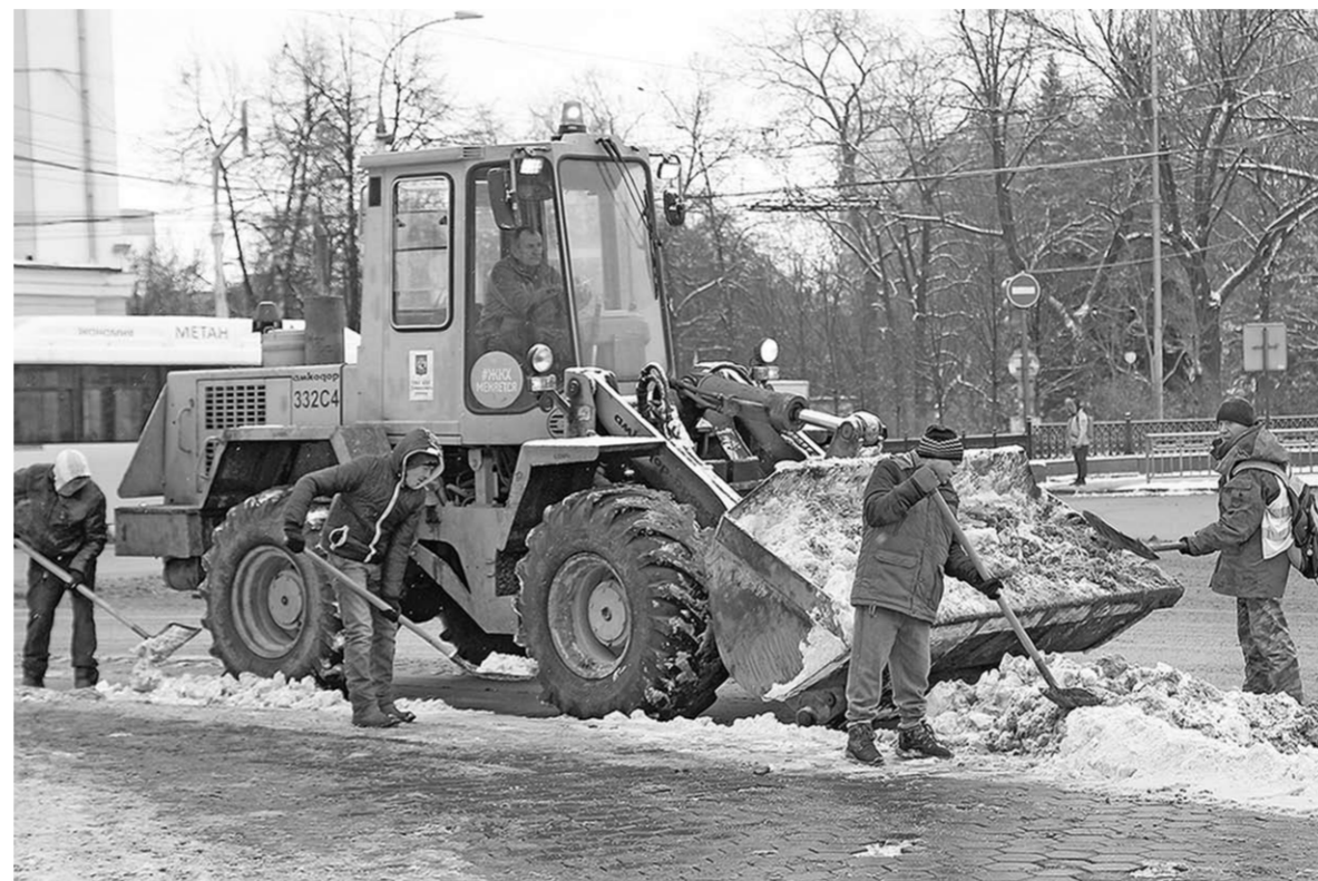
Спецтехника работает на городских улицах круглосуточно.

При зимней уборке комбинаты благоустройства отдают приоритет магистральным дорогам с наибольшим потоком транспорта и людей. В первую очередь чистят проезжую часть основных улиц и прилегающие к ним тротуары.