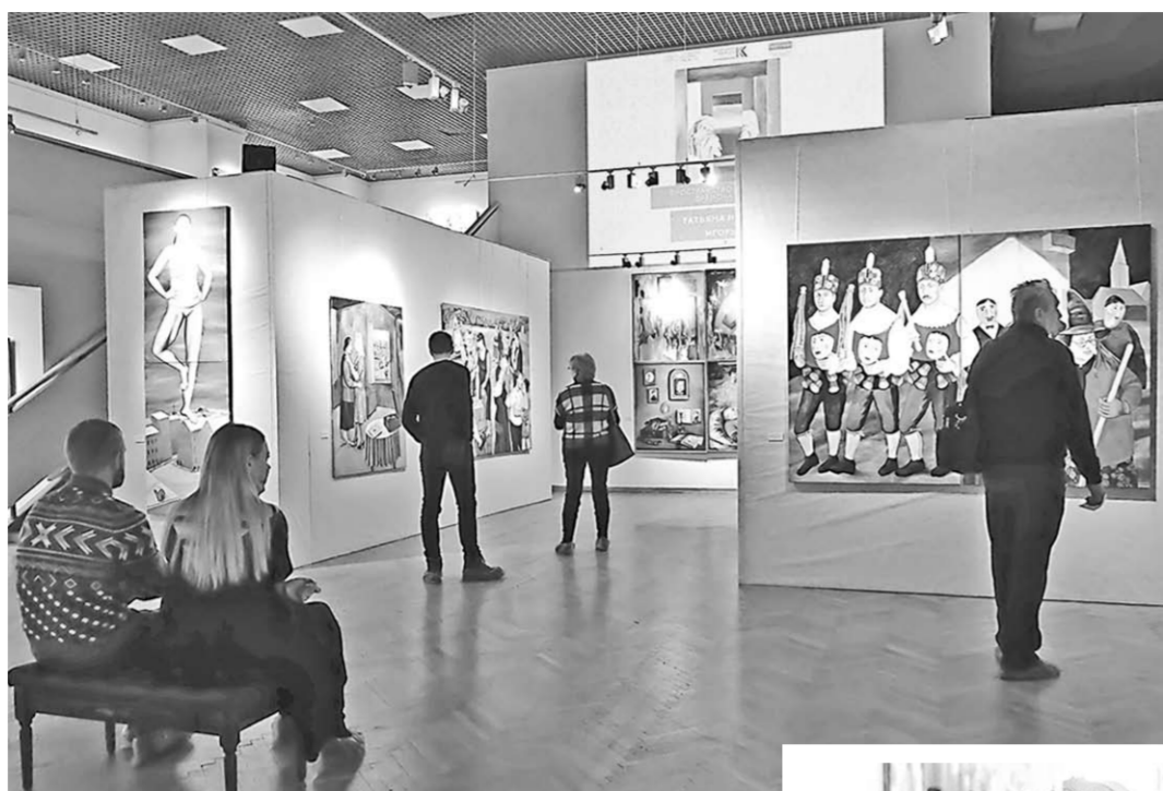
На выставке «Пространство времени».

Все герои инсталляций выполнены из крашеной фанеры в натуральный размер. А на заднем плане эту причудливую композицию дополняет картина «Стена», нарисованная сразу на трёх больших холстах, плотно подогнанных друг к другу. На импровизированной стене можно увидеть все атрибуты современного городского арта: граффити вперемешку с обрывками каких-то объявлений, математические уравнения, указатели, цифры, упрощённый портрет девушки и многое другое. Всё это вместе образует сложносочинённую композицию – своеобразное письмо потомкам, над которым придётся изрядно поломать голову, ведь оно не имеет ни ключа, ни шифра. Татьяна Назаренко уже со времён учёбы в Суриковском институте тяготела к большому формату. Художница черпает вдохновение в современной жизни, изображая её правдиво и без прикрас. Все её крупноформатные картины заполнены персонажами, которые постоянно чем-то заняты: то спешат по своим делам или