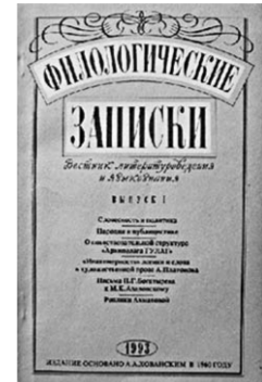
Возобновлённое издание знаменитых «Филологических записок».