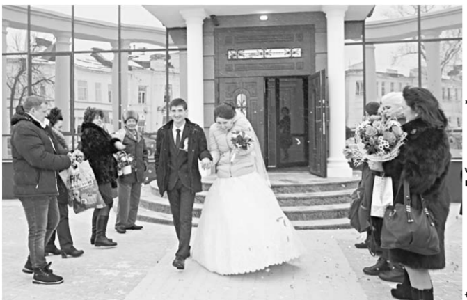
Вот и первая пара молодожёнов, которая соединила свою судьбу в новом Дворце бракосочетания.

Открытие нового заезда в Боброве стало настоящим праздником не только для двух пар молодожёнов, которые в этот день зарегистрировали свой брак, но и для всех жителей города.