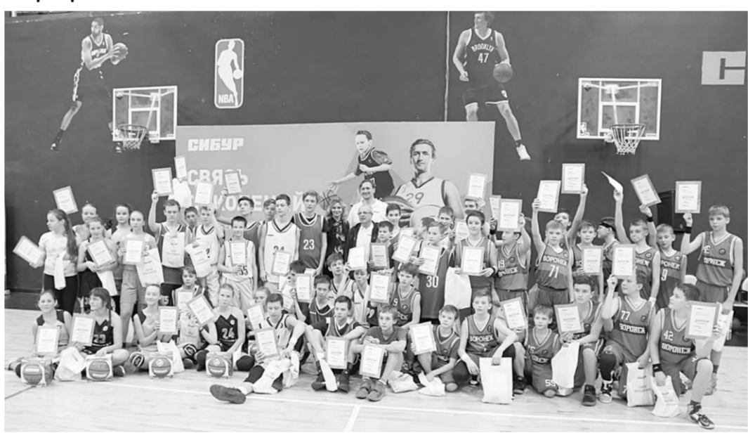
Участники проекта «Связь поколений».

После 32 проведённых игр в активе «Бурана» стало тридцать очков. Наша ледовая дружина занимает 22-е место в турнирной таблице.