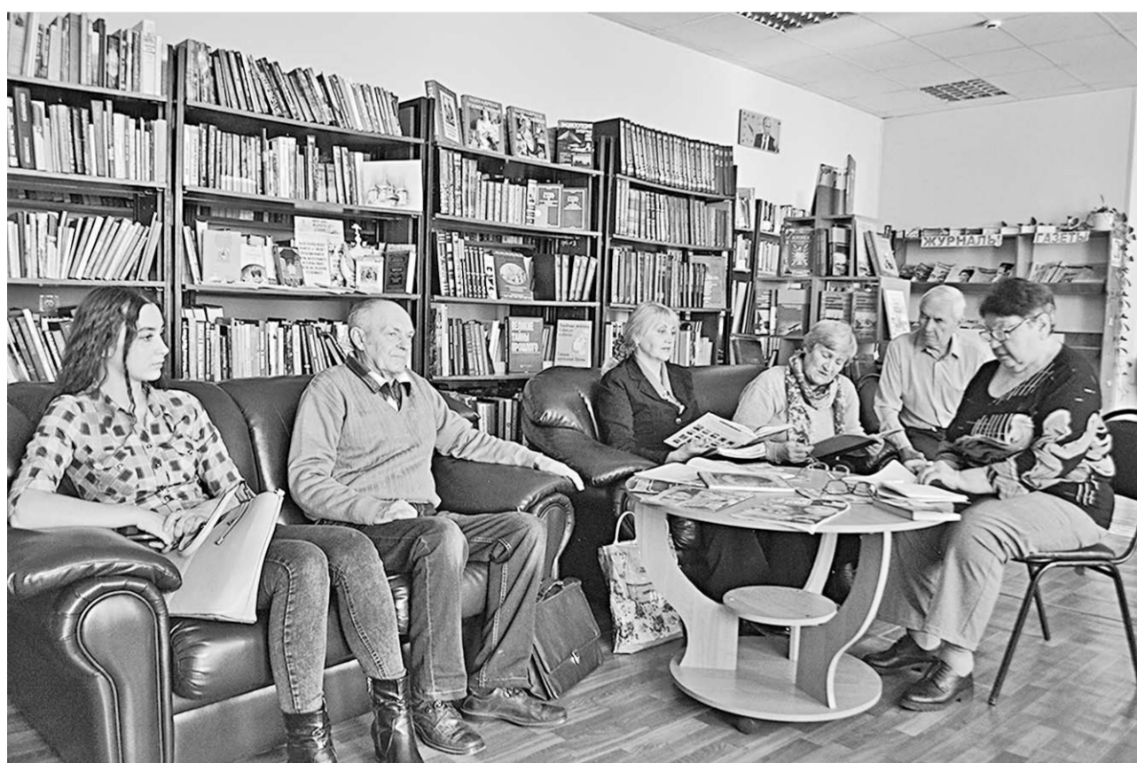
На очередной встрече «Острогских родников».

Увлечённые | Участники литературно-музыкального объединения «Острогские родники» помнят и чтут напутствие Самуила Маршак