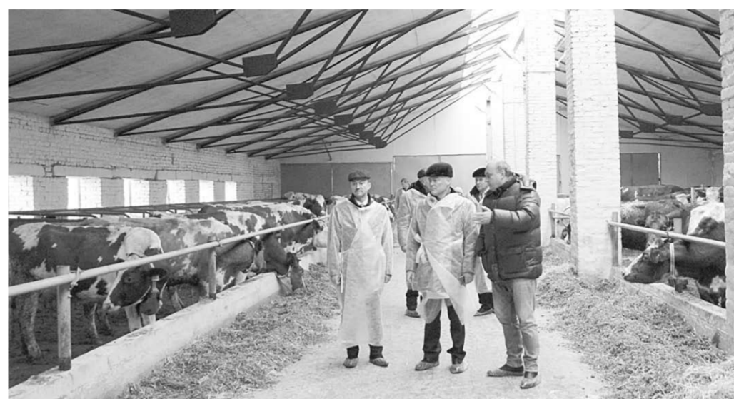
На новом комплексе в Нижнем Кисляе.

Изменились и условия работы доярок. Если раньше им