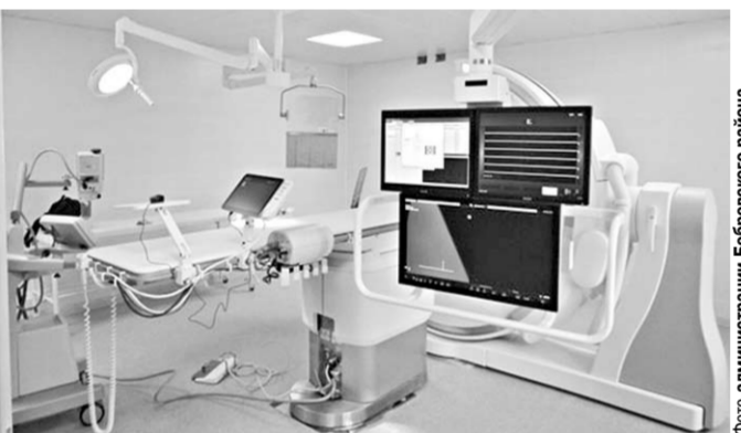
В новой рентгеноперационной.

В Бобровской районной больнице начала работать рентгеноперационная с уникальным оборудованием.