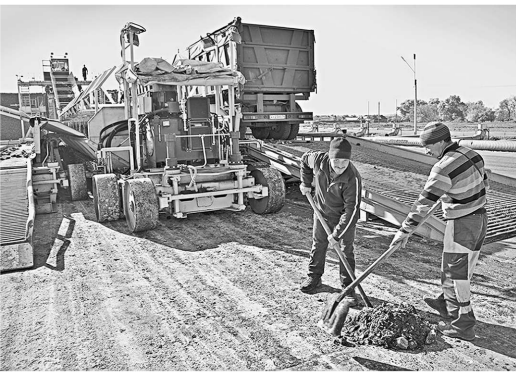
Этот снимок наш фотокорреспондент Михаил Перязовый сделал во время массового приёма сахарной свёклы. Тогда в сутки перерабатывали до 9 тысяч тонн сладких корней.

— Нам необходимо создавать дополнительные рабочие места, открывать новые производства, не связанные с градообразующим предприятием, то есть, скажем так, уйти от полной «сахарной» зависимости,