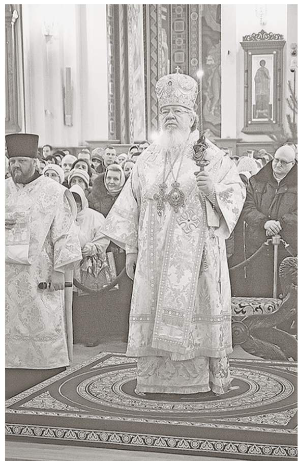
Возлюбленные о Господе и Спасителе нашем Иисусе Христе досточтимые отцы, всечестные иноки и инокини, дорогие братья и сестры!

митрополита Воронежского и Лискинского Сергея