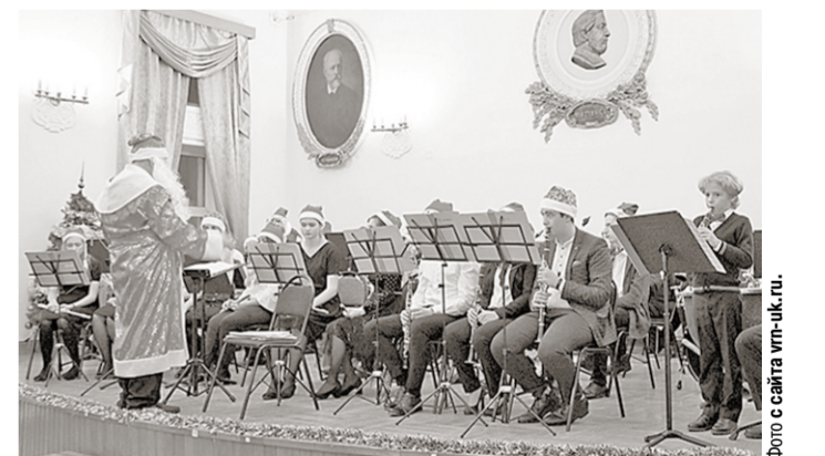
Звучат рождественские мелодии.

Молодые музыканты – творческие коллективы и солисты отделений музыкального колледжа имени Ростроповичей подготовили специальные праздничные программы для любителей музыки разных стилей.