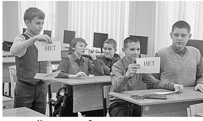
На занятиях ребята изучали самые разные темы.

Семиклассники из борисоглебской школы №12 на протяжении трёх месяцев проходили обучение по краткосрочной дополнительной общеобразовательной общеразвивающей программе «Кузница ведущих».