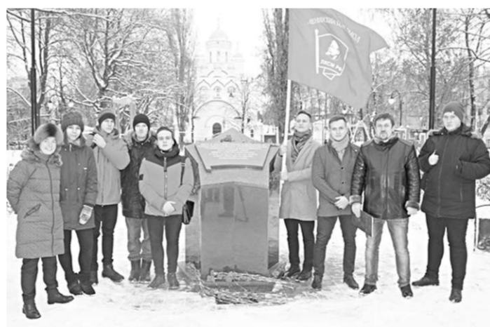
Новое поколение воронежских комсомольцев у почётного знака в честь 100-летия ВЛКСМ.