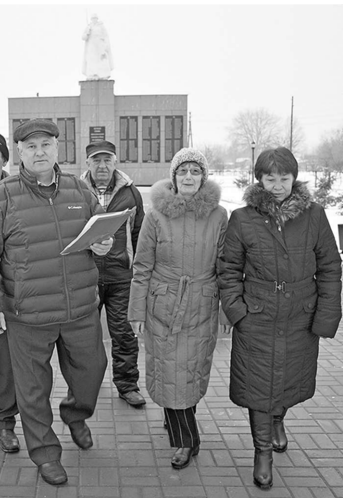
У одного из обновлённых памятников воинам, погибшим в годы Великой Отечественной войны.