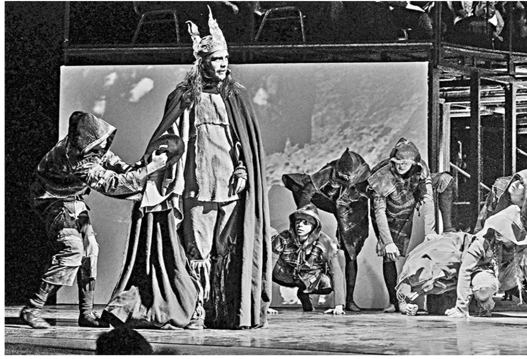
Сцена из спектакля «Пер Гюнт».