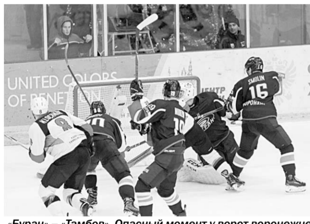
«Буран» — «Тамбов». Опасный момент у ворот воронежцев.