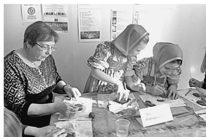
Мастер-классы на все вкусы.

В Борисоглебском филиале ВГУ состоялась II региональная научно-практическая конференция преподавателей, студентов и школьников «Литература, фольклор, история и язык в региональном контексте».