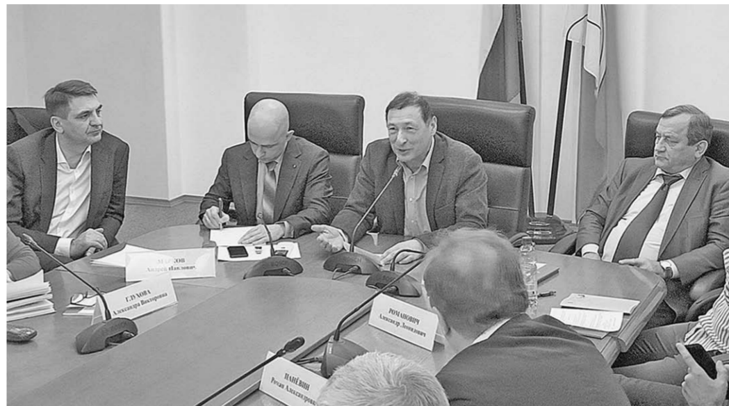
Воронежский клуб политологов – площадка для серьёзных дискуссий.

В качестве одного из путей выхода из тупика Борис Кагар-