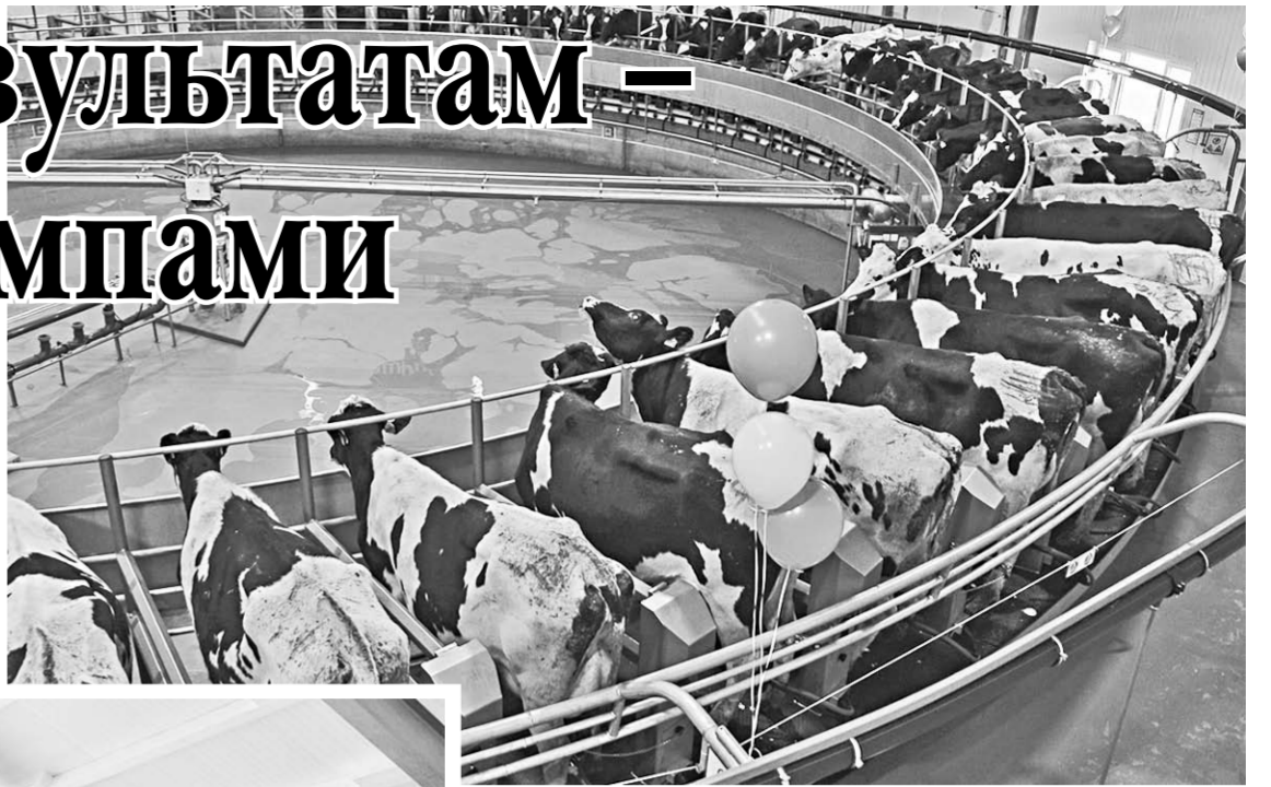
На современных фермах доение производится в залах «ёлочка» и «карусель».

Губернатор подчеркнул, что развитие сельского хозяйства в Воронежской области не будет останавливаться. В то же время глава региона отметил, что молочная отрасль не требует такого пристального внимания и регулирования, поскольку в ней работают опытные компании, которым важно просто не мешать.