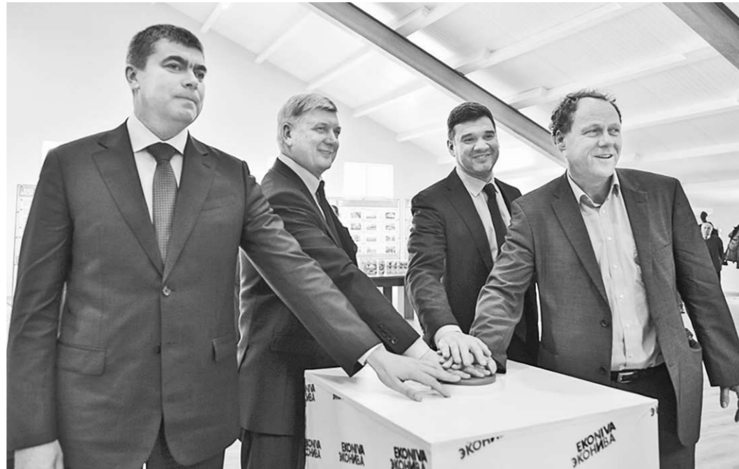
Дан старт ещё одному молочному комплексу, рассчитанному на 2,8 тысячи коров.

Перехав в Лискинский район, губернатор принял участие в запуске КРС «Добрино» и КРС «Бодеевка». Первый животноводческий комплекс рассчитан на 2800 коров с площадкой для выращивания молодняка крупного рогатого скота молочных пород на 5200 голов соответственно. Руководство компании «ЭкоНиваАгро» уделяет большое внимание развитию спорта и вовлечению в занятия физкультурой подрастающего поколения. Именно поэтому открытия всех четырёх комплексов прошли в спортивно-игровом стиле. Героями церемонии стали юные спортсмены и персонажи «Академии Мо-