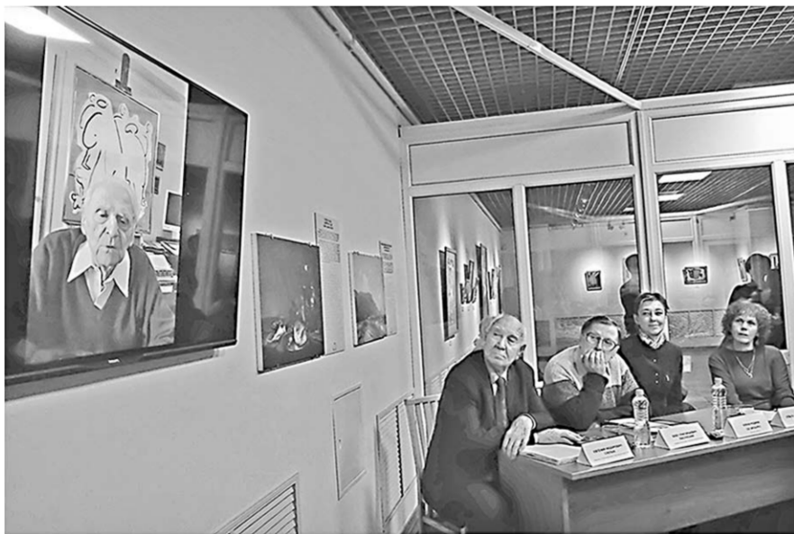
Первым посетителям выставки было показано видеобращение живущего в Америке художника.