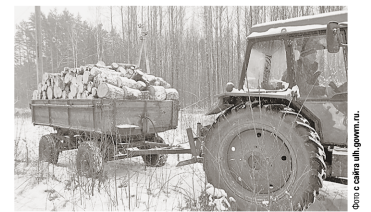
Идёт вывоз дров.

Бобровские лесники оказывают помощь малоимущим жителям района и многодетным семьям, обеспечивая их дровами в зимние месяцы.