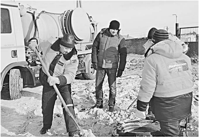
Установка новых крышек.

В Воронеже участились факты исчезновения крышек колодцев.