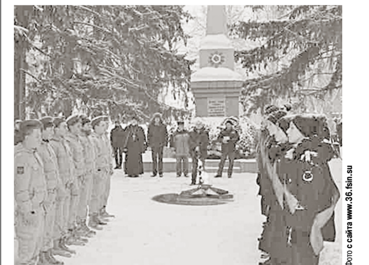
Молодое поколение — на митинге у памятника погибшим.