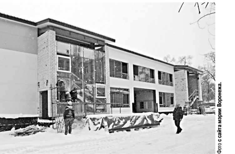
В новом ФОКе будут заниматься не только воспитанники спортивных школ, но и жители района.

– Если раньше молодежь и подростки, по крайней мере, в своём кругу, хвастались тем, что у них есть опыт употребления наркотиков, рассказывали какие-то истории о «крутых бизнесменах», которые «сидят на коксе» и при этом суперуспешны, то реальность развела все эти мифы. Те деловые люди, которые действительно употребляли наркотики, давно потеряли свой бизнес. С наркоманам никто не хочет иметь дела даже в криминальных кругах. Наркомания сегодня – это преимущественно удел социально неблагополучных слоёв населения, и, к сожалению, при ухудшении экономической ситуации это общество обострится, – считает заведующий отделением профилактики и лечения наркомании. – Если наркотики начинают употреблять ребёнок из