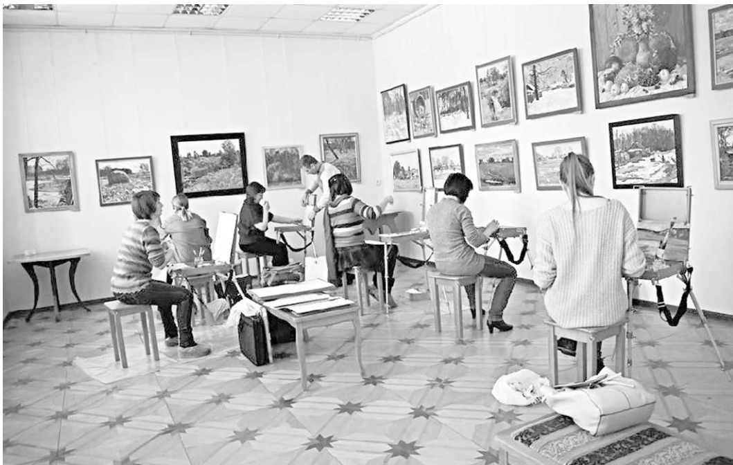
Копиисты за работой.