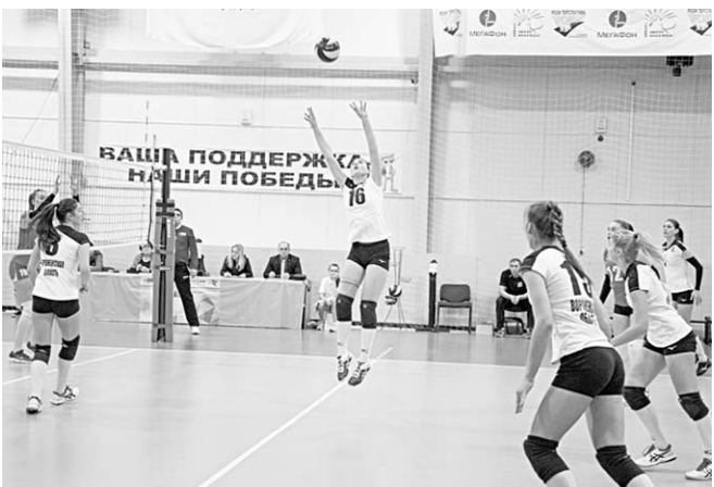
Воронежские волейболистки, одержав всего три победы в турнире, завершили предварительный этап первенства России на последнем месте.

Подопечные Лёвона Джиганяна провели турнир в зоне «Центр», где заняли последнее, десятое место. В 36 проведённых матчах наши девушки смогли одержать лишь три победы, одолев в родных стенах пензенский «Университет-Визит» со счётом 3:1 и дважды «Гатчинку» из Ленинградской области – 3:1 и 3:0.