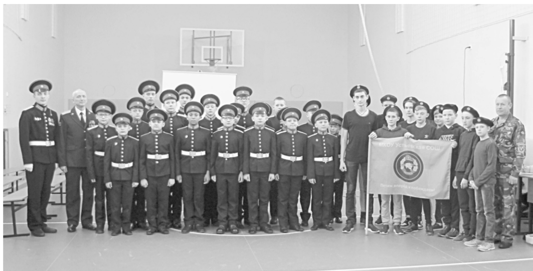
Фотография на память: кадеты и ученики школы.