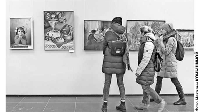
На выставке «Мой мир без маски».

Недавно в Выставочном зале Воронежа, что на улице Кирова, была представлена экспозиция работ участников областного конкурса «Педагог-художник». Он проводился среди преподавателей детских школ искусств. В рамках этого конкурса приняли участие преподаватели из пятнадцати городских детских школ искусств и из двадцати четырёх муниципальных районов Воронежской области. Все работы конкурсантов объединила тема «Мой мир без маски». Тема по-своему простая и требующая от всех участников быть в своих работах предельно честными и искренними.