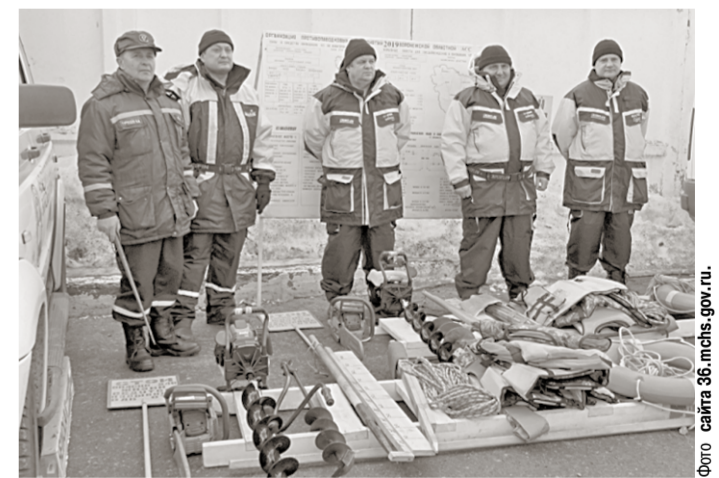
Спасатели готовятся к выполнению работ по ликвидации ледяных затворов взрывным способом.

На территории аварийно-спасательной службы Воронежской области 12 марта с личным составом подразделение проведено учебно-методическое занятие, посвящённое предстоящему весеннему паводку.