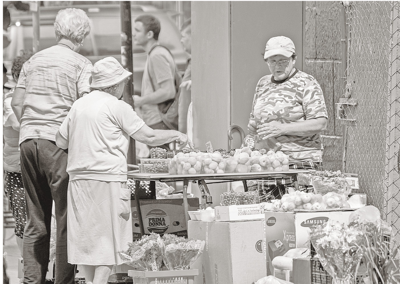
Уличная торговля позволяет людям заработать на хлеб, что актуально круглый год.

Самым первым «звоночком» для мелких торговцев стал запрет на продажу пива в ларьках, что сильно ударило по оборотам их владельцев, пишет «РГ». Потом из палаток исчезли сигареты, сделал этот бизнес ещё менее рентабельным. А затем нестационарные торговые объекты (НТО) начали убирать с улиц. Так, в Калуге городская управа в феврале 2014 года разослала предпринимателям уведомление о расторжении договоров аренды земельных участков и о сносе ларьков, павильонов, палаток. В соседней Туле, как и в Калуге, предприниматели активно протестовали несколько лет назад, когда мэрия начала расторгать с ними договоры аренды. Тем не менее всё, что