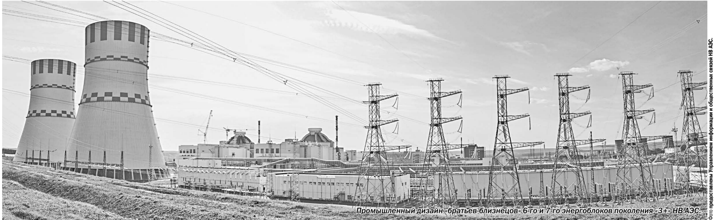
Промышленный дизайн «братьев-близнецов» 6-го и 7-го энергоблоков поколения «3+» НВ АЭС.

На Нововоронежской АЭС в соответствии с графиком начался этап физического пуска энергоблока №7 поколения «3+» с реактором ВВЭР-1200. Эта новость вмиг облетела все средства массовой информации нашей страны. И не только! Всё мировое ядерное сообщество узнало, что энергоблок стал третьим в серии энергоблоков подобного типа, построенным в России. Журналисты сообщили: 19 февраля в 16 часов 10 минут по московскому времени в активную зону реактора была загружена первая тепловыделяющая сборка со свежим ядерным топливом. Персонал атомной станции выполнил все работы в соответствии с выданной Ростехнадзором лицензией на эксплуатацию ядерной установки. В течение пяти дней все 163 тепловыделяющие сборки атомщики загрузили в реактор энергоблока.