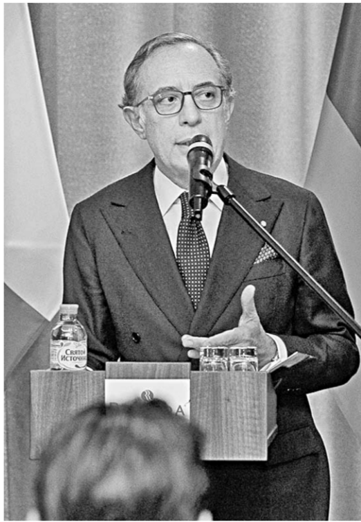
«Перед нами сложный, но захватывающий вызов: расширить итальянское представительство на российском рынке», – заявил Чрезвычайный и Полномочный Посол Республики Италия в РФ Паскуале Терраччано .

центров. Экономическое сотрудничество особенно процветает, когда есть хорошие основы культурных обменов и обменов знаниями между народами, – отметил Посол Италии.