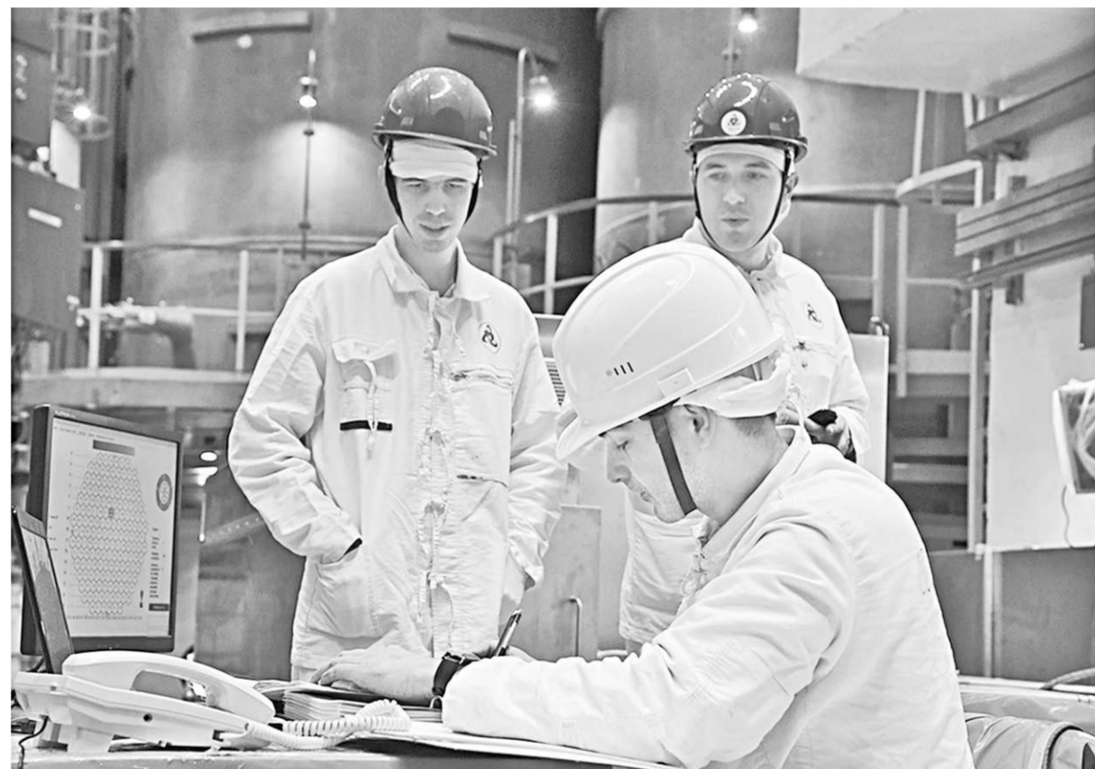
Инженеры-физики Нововоронежской АЭС на загрузке первой тепловыделяющей сборки.

В рамках сотрудничества БНТУ с НВ АЭС будущие белорусские атомщики приезжают в Нововоронеж пятый год подряд. Они знакомятся с особенностями экс-