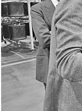
В ближайшей перспективе, благодаря вложениям Pirelli , объёмы производства на воронежской площадке должны возрасти в два раза.

При этом он добавил, что на современном этапе развития региональная власть намерена уделять ещё большее внимание созданию «безбарьерной комфортной среды для вложения капитала, в том числе иностранного».