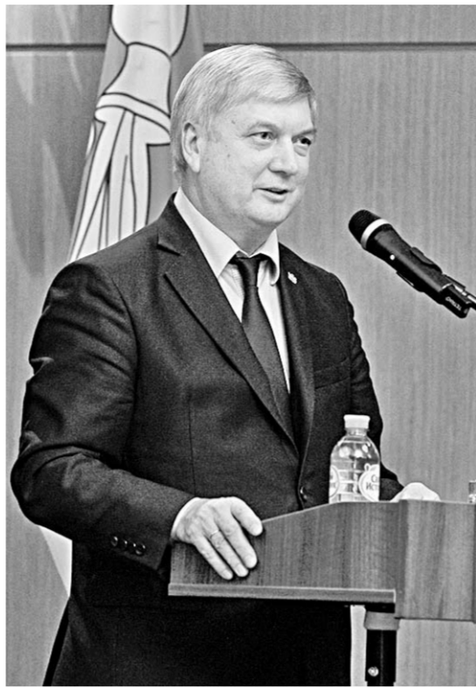
«Мы можем предложить потенциальным инвесторам широкий список направлений для нашего сотрудничества», – сказал губернатор Воронежской области Александр Гусев .

– Сразу заметно, что правительство успешно привлекает инвестиции и создаёт отличные бизнес-климат для иностранных партнёров. Воронеж не только промышленный центр, но ещё и университетский – у нас много вузов и научно-исследовательских