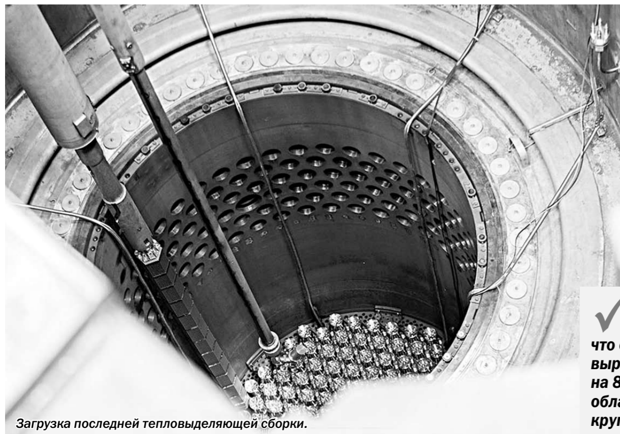
Загрузка последней тепловыделяющей сборки.

По итогам года Нововоронеж признан лучшим среди городов присутствия атомных электростанций России. За счёт дополнительных 306,4 миллиона рублей, поступивших в городской бюджет в 2018 году в рамках Соглашения, были решены городские проблемы: отремонтированы дорожные полотна в частном секторе, автодорогу на Нововоронежскую АЭС. Обновили фасады Дворца культуры и детской школы искусств им. В.В.Силина. Капитально отремонтирован детский сад № 10, построены универсальные спортивные площадки во всех детских садах. В марте 2018 года открылась Ледовая арена «Остальная», которая стала тренировочной базой для местных и иногородних спортсменов, площад-