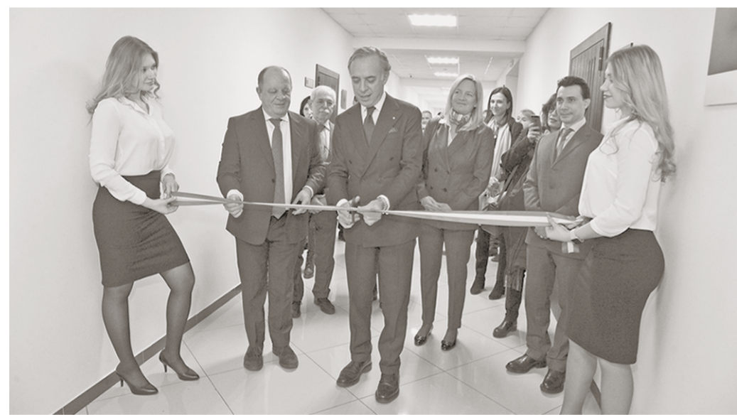
Открытие консульства будет способствовать укреплению российско-итальянских отношений.

Событие | В Воронеже открыто Почётное консульство Италии