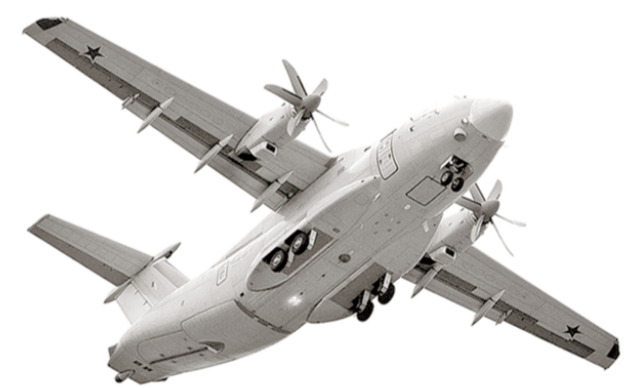
В небе – Ил-112В.

Воронежский Ил-112В успешно совершил свой первый полёт