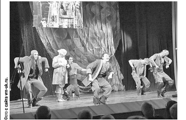
Актёрский ансамбль ТЮЗовского «Острова сокровищ» был отмечен призом секции критики.

Стоит напомнить, что условия конкурса уже не раз менялись, как и его название. Чем вызвано решение отказаться (надеюсь, временно) от выдвижения в каждой номинации нескольких претендентов на награду с последующим определением победителей за пару часов до торжественной церемонии, честно говоря, не очень понятно. Допустим, сезон-2018/2019 оказался не самым удачным; но следует ли из этого, что найти кого-то для включения в номинацию, скажем, «Женская роль второго плана» не представлялось возможным? Не сомневаюсь в том, что лауреаты нынешнего фестиваля отменены заслуженно, но хочется всё-таки познать действительность благодаря этим ролям в этих спектаклях мы будем вспоминать сезон-2018/2019? И почему иные яркие постановки (например, «Антигона» Камерного театра или хореографические спектакли на той же сцене) членами Экспертного совета оказались не замечены?