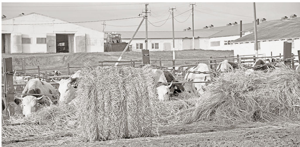
Фермы в Новобелой пережили 90-е и надеются на достойное будущее.

стадо. Не бросили животноводство на произвол судьбы и не вырезали скот, как это случилось со многими фермами, и в трудные 90-е годы. В наше время нашли поддержку в лице дочернего предприятия компании «Продимекс». Одно из её подразделений – филиал «Новобелаянский» ООО «ЦЧ АПК» – в 2011 году стал владельцем трёх ферм и практически всей земли в Новобелой. Так, у 250 жителей села появилась работа, достойная зарплата. А сельская жизнь обрела крепкую финансовую базу – налоги в местный бюджет, постоянную помощь от компании для решения самых обычных вопросов. Например, таких, как ремонт школы, проведение праздников.